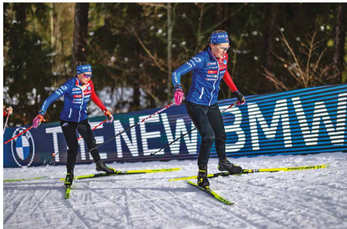
Vedenie Slovenského zväzu biatlonu pozerá najmä smerom do budúcnosti. Cieľom je vychovávať mladých biatlonistov, ktorí sa nestretajú ani v medzinárodnom meradle.

- Predovšetkým som rád, že som sa po profesionálnej kariére športovca vrátil do domovských klubov v Predajnej a Podbrezovej, kde som vyrastal. V prvej sezóne som pôsobil najmä ako asistent hlavného trénera pre preteky dorastu v biatlone a mohol som odovzdať svoje skúsenosti mladým športovcom. Toto pôsobenie hodnotím pozitívne. Dosiahli sme viaceré výborné výsledky a na tomto základe bu-