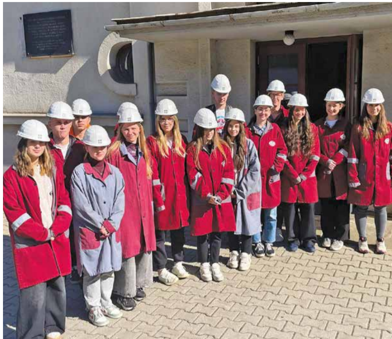
Naši žiaci spoločne s chorváckymi kamarátmi počas návštevy Železiarní Podbrezová.

Skutočnosť, že si zahraniční partneri vybrali práve našu školu ako miesto profesionálneho vzdelávania je veľkým ocenením a dôkazom, že škola môže byť príkladom dobrej praxe. Program bol od pr-