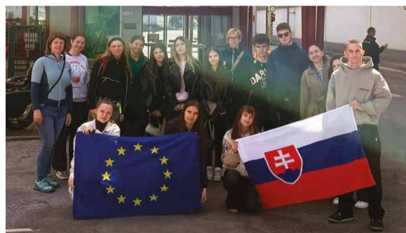
Spoločná fotografia pred vstupom do starého závodu.