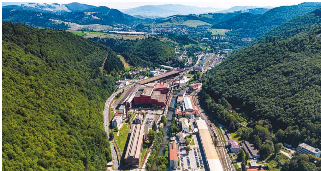
Pohľad na starý závod z vtáčej perspektívy.

Veríme, že sa nakoniec nejakej pomoci dočkáme. Rôznymi opatreniami sa pritom snažíme zlepšiť výsledky hospodárenia, čo je vidieť aj na medziročnom znížení strát. Pripravujeme pritom opatrenia pre rok 2027, v ktorom by sme už mohli dosiahnuť kladný hospodársky výsledok. Sme presvedčení, že naša spoločnosť prežije aj toto zlé obdobie a udržíme si, aj vzhľadom na rozbehnuté investície, špičku v kvalite, termínoch a v celom servise tak, ako sú na to naši odberatelia zvyknutí.