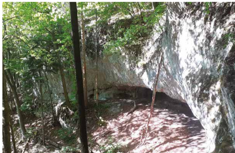
Počas trasy sa zastavte aj pri malej jaskyni Mažarná. Ide o zaujímavý prírodný úkaz. Na snímke hore Ostrá.