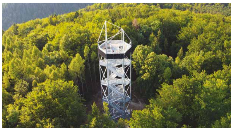
Vyhliadková veža Horné Lazy nad Breznom.