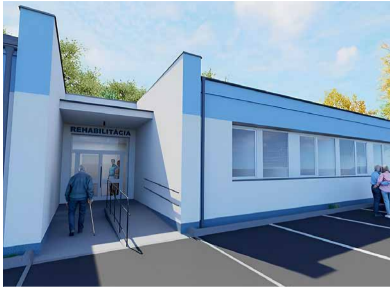
Vizualizácia nového fyziatrcko-rehabilitačného oddelenia.

- Vďaka tejto investícii sa nám odľahčí oddelenie dlhodobých chorých (ODCH). Často sa stáva, že blízki nedokážu zabezpečiť prí-