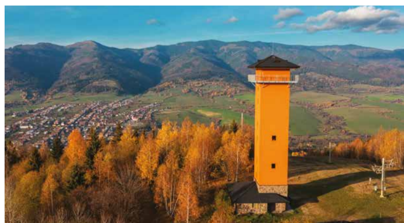
Poloméské očko.

Rozhľadni a pekných vyhliadkových miest je však ešte viac. Napríklad, v minulom roku otvorili rozhľadňu v Telgarte a ďalšie by ste našli v okolí Banskej Bystrice či Liptova. Stačí si len vybrať a o pekné výhľady nebude núdza.