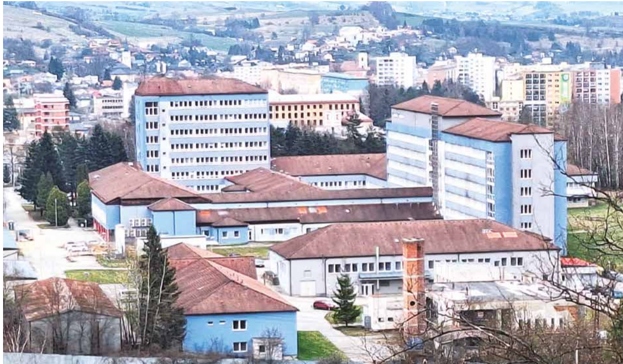
Pohľad na Nemocnicu s poliklinikou v Brezne.