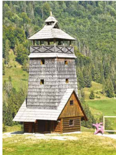
Rozhľadňa Zbojská.

Rozhľadne sú ideálnou voľbou na prechádzku či rodinný výlet s deťmi. Ponúkajú zväčša nenáročnú turistiku, ktorú zvládnu aj tí menej zdatní, prípadne deti. Azda najznámejšia je Vyhliadková veža v Brezne v lokalite Horné Lazy, ktorá so svojimi 40 metrami patrí k najvyšším na Slovensku a vybudovaná bola len nedávno. Pri výstupe na kovovú konštrukciu musíte zdolať bezmála 200 schodov, no výhľady stoja skutočne za to. Ako na dlani