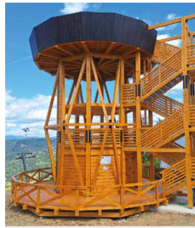
Urbanov klobúk.

Zbojská len pár minút od cesty Z Čierneho Balogu sa presunieme na Zbojskú, kde sa nachádza vyhliadková veža hojne navštevovaná turistami. Postavená bola pred desiatimi rokmi na území Ná-