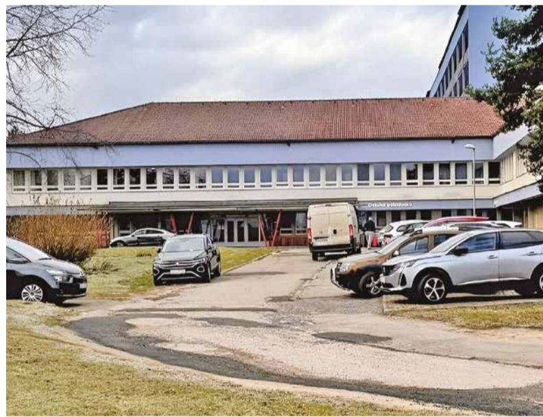
Jednou z momentálnych priorit vedenia nemocnice je aj zmena parkovacej politiky.