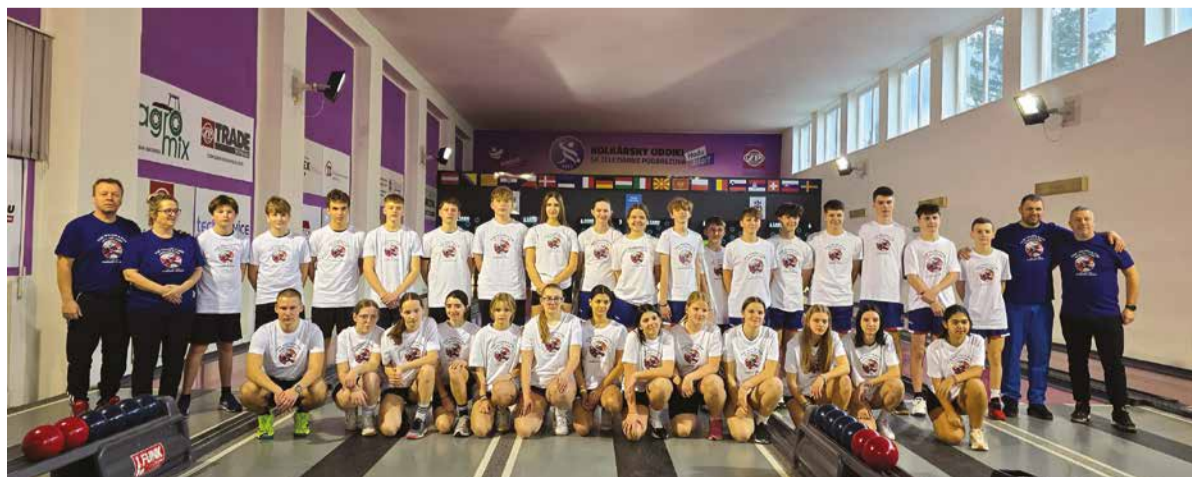
Počas kempu vládla v podbrezovskej kolkárni skvelá atmosféra