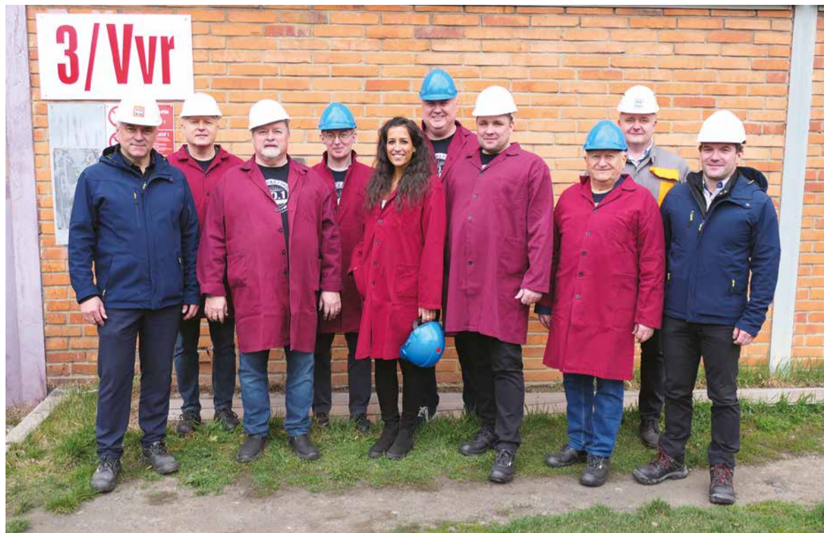
Spoločná fotografia zástupcov našej akciovej spoločnosti a hostí zo Strojníckej fakulty Technickej univerzity Košice pred budovou valcovne bezšvíkových rúr.

Železiarne Podbrezová spolupracujú s Technickou univerzitou Košice (TUKE) už dlhé roky, pričom ide o intenzívnu kooperáciu. Naša akciová spoločnosť aktívne podporuje technické vzdelávanie a profiláciu študentov v oblasti metalurgie a hutníctva, pričom viacerí naši zamestnanci získali titul práve na pôde tejto univerzity. Zástupcovia jednej z najvýznamnejších univerzít na Slovensku si najskôr pozreli výrobný proces v oceliarni, kde sa oboznámili s procesom tavenia oceľového šrotu, z ktorého sa neskôr stane výsledný produkt, ktorý putuje do celého sveta. Detailne im bol vysvetlený každý postup - od prvotnej vsádzky až po konečný výrobok pripravený na ďalšie spracovanie. Zaujímali sa o technológie, riadenie tavby, ale aj o mnohé iné úlohy, ktoré so spracovaním oceľového šrotu súvisia. Následne si pozreli výrobu v novom závode, pričom navštívili obe výrobné prevádzkarne. Videli, ako sa valcujú rúry za tepla a ťahané za studena, ich spracovanie až po skladovanie.