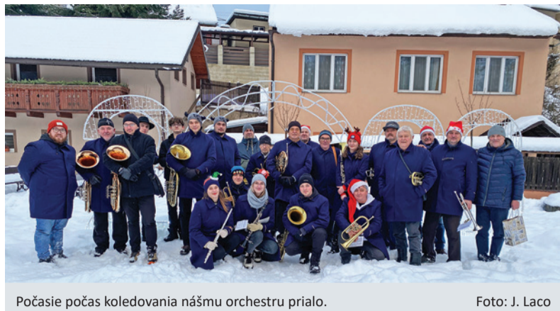
Počasie počas koledovania nášmu orchestru prišlo.