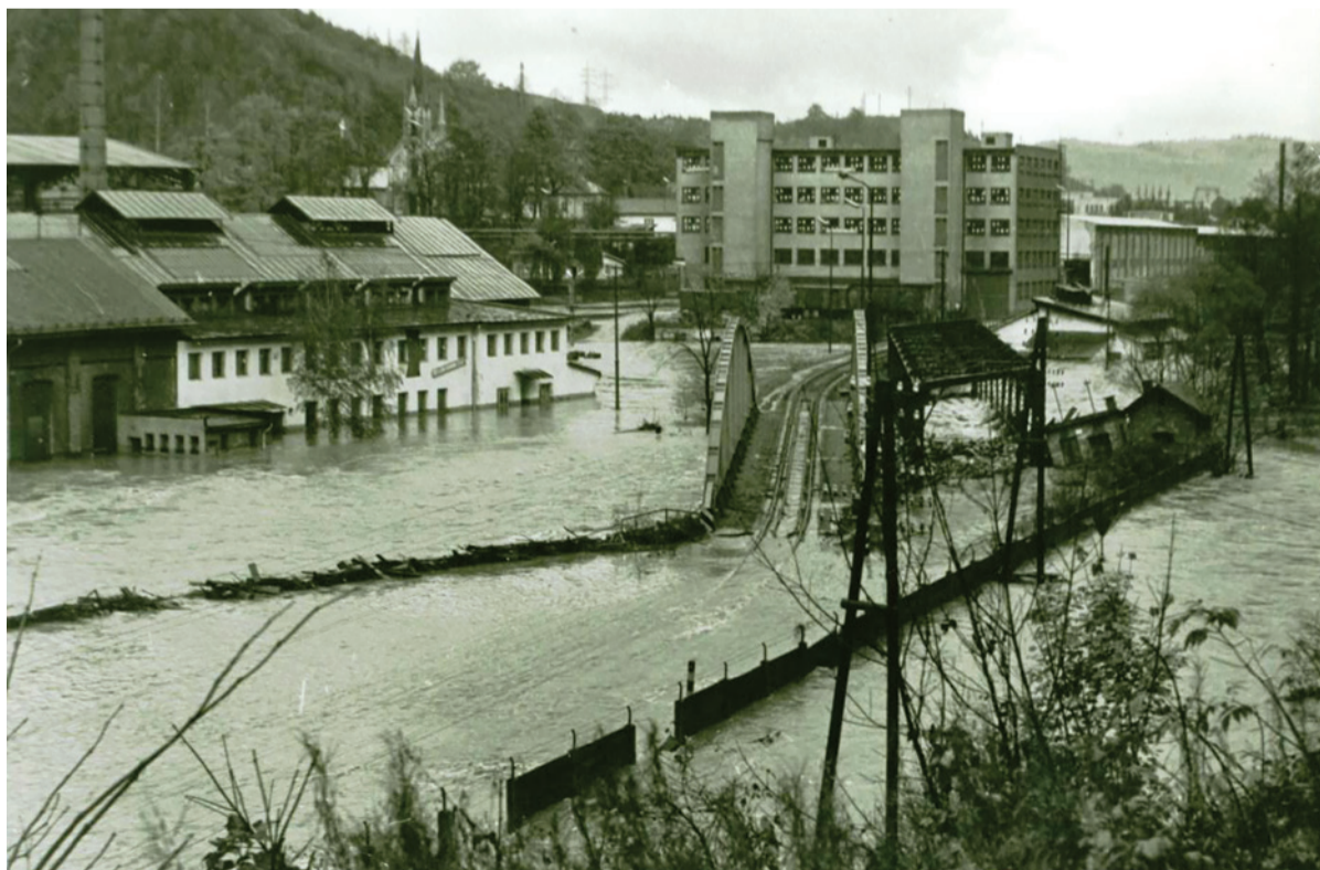
Most smerom do budovy zásobovania počas potopy v roku 1974.

K najväčším živelným pohromám minulého storočia patrila povodeň, ktorá v Podbrezovej odrezala nielen Kolkáreň od starého závodu, ale na úseku po Banskú Bystricu napáchala obrovské školy. Dňa 21. októbra 1974 sa vylial Hron zo svojho koryta a v starom závode voda zatopila výrobné prevádzkárne (v najnižšie položenéj prevádzkárni až do výšky 1,7 metra).