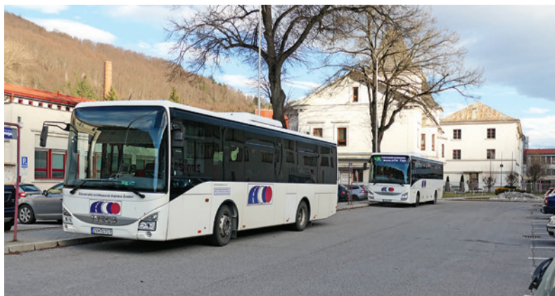
V januári môžete cestovať autobusmi zadarmo, napríklad do práce a naspäť.

Predplatené cestovné lístky na ďalšie mesiace, najskôr od 1. februára, si môžete zakúpiť cez webovú stránku https://idsbbsk.sk/ , kde získate aj viac informácií o tom, ako cestovať zadarmo ďalší celý jeden mesiac.