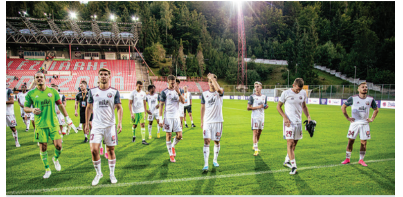
Káder FK Železiarne Podbrezová bude oproti jeseni značne pozmenený.

- Určite áno. Dnes vieme, že v jarnej časti dáme príležitosť viacerým našim dorastencom a je len na nich, akým spôsobom na seba upozornia. Súčasťou tímu bude i