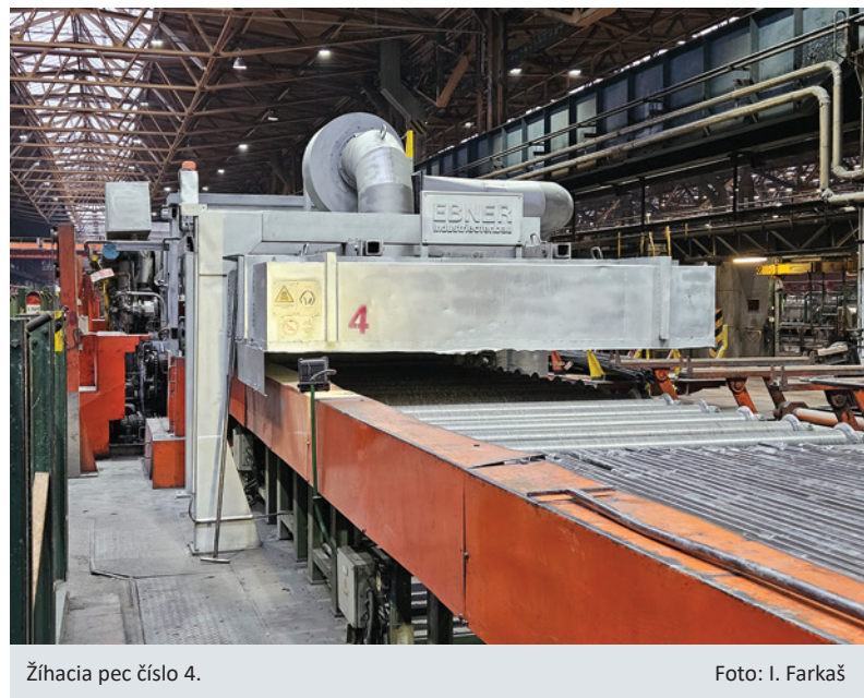
Žihacia pec číslo 4.

Len pre doplnenie informácií, stredné opravy v ťahárni rúr prebiehajú počas celého roka. Začiatkom novembra bola opravená žihacia pec číslo 3. V súčasnosti sa realizuje stredná oprava na žihacej peci číslo 7. Z toho jasne vyplýva, že zariadenia sú neustále kontrolované a v prípade potreby aj opravované, pretože len ich bezproblémové fungovanie zabezpečí plynulú výrobu v našej fabrike.