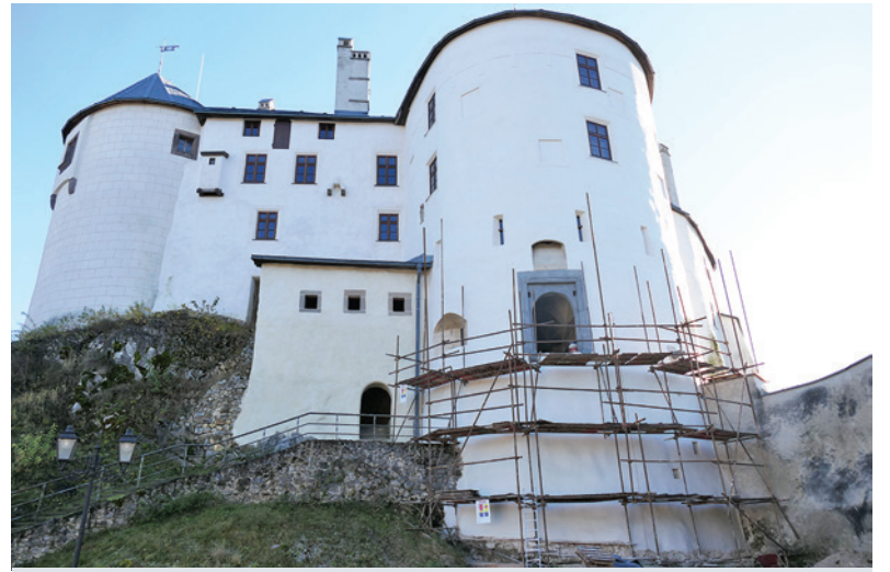
Obnovený barbakan bude ďalším lákadlom pre turistov.

Rekonštrukcia historických pamiatok je zložitý proces. Každý krok je potrebné zvážiť, aby sa zachovala pôvodná podoba. Na obnove