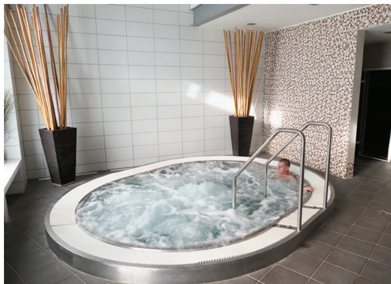
Relax vo vírivke.

S klasickými procedúrami začínali zamestnanci každé ráno približne od ôsmej a zvyčajne tesne pred obedom končili. Poobede mali okrem zvyšných procedúr aj viac osobného voľna, ktoré využívali aktívne, napríklad prechádzkami či hubárčením v okolí. Zašportovať si mohli tiež v priestoroch hotela, kde okrem posilovne mali k dispozícii aj pingpongový stôl.