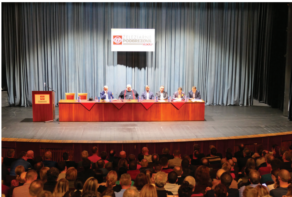
Členovia Predstavenstva ŽP a.s. počas aktívu v Dome kultúry v Podbrezovej.

Generálny riaditeľ tiež pripomenul neustále napredovanie Železiarní Podbrezová v oblasti modernizácie zariadení, ktorá je nevyhnutná z dôvodu konkurenčieschopnosti. Vyzdvihol fungovanie školy, nemocnice, futbalového klubu a ďalších odvetví, ktorých život ovplyvňujú železiarne. Pristavil sa tiež pri sociálnej oblasti, ktorá je jednou z priorit vedenia. „Vďaka výborným výsledkom sme vlni zvýšili mzdy až o 16 percent a každému zamestnancovi sme prispeli sumou tisíc eur na zvládnutie energetickej krízy. Myslíme aj na našich dôchodcov. Podobne ako vlni, aj tento rok dostanú na Vianoce mäsový balíček, rovnako tak všetci