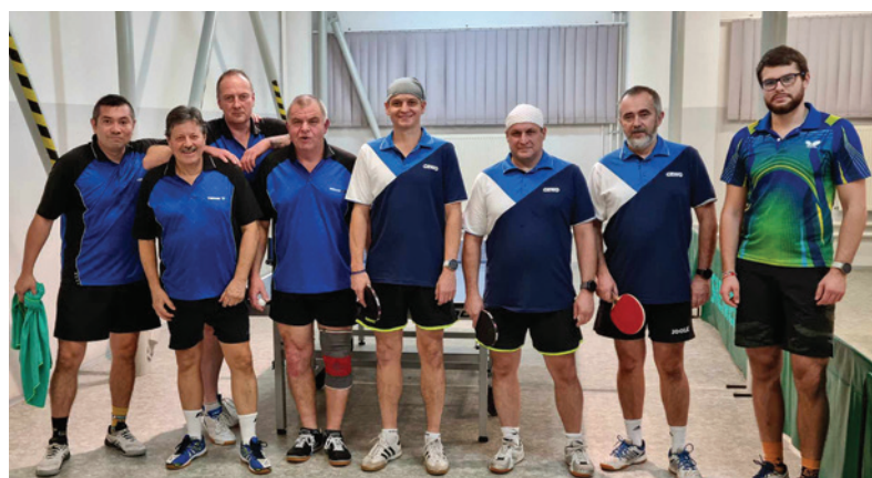
Družstvo Podbrezovej (vľavo v modro-čiernych dresoch) pred zápasom 4. ligy proti Starej Kremničke.

A dokedy by chcel vydržať aktívne za zelenými stolmi? „Mám známych, ktorí ešte aj v sedemdesiatke hrávajú súťaže. Stolný tenis je šport, ktorý sa dá robiť naozaj dlho. Všetko však záleží od zdravotného stavu. Pokiaľ zdravie vydrží, rád by som hral čím najdlhšie. Pingpong sa venujem od detstva a nechal som si ho teraz už ako jediný šport. Predtým som aktívne hrával volejbal a futbal. Samozrejme, na rekreačnej úrovni športujem doteraz. Idem si zaplávať, pocvičím, zahrám si tenis, ale stolný tenis je prioritou.“