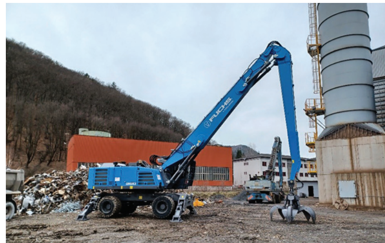
Nový hydraulický nakladač TEREX/FUCHS MHL 360F.

- Uvedené zariadenia zabezpečujú plnenie požiadaviek pre výrobu v ŽP a.s. a tiež zvyšujú bezpečnosť pri práci. Okrem lokomotív ide o nové zariadenia, ktoré nahradili pôvodné. Tie už po technickej stránke nevyhovovali ďalšiemu prevádzkovaniu. Pri lokomotíve ide o zmodernizovanie staršej mašiny, pričom