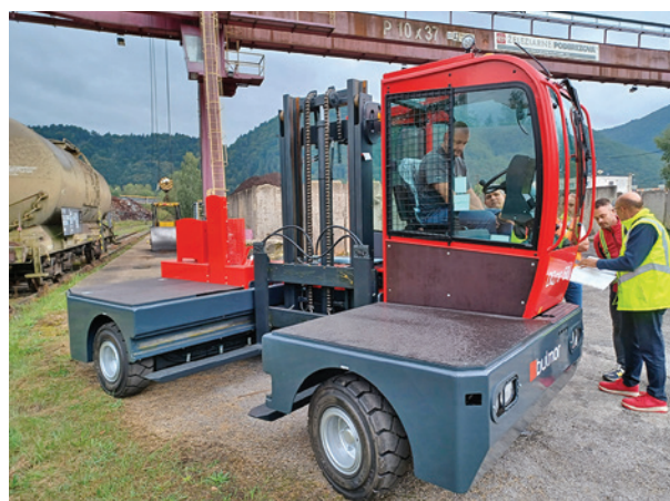
Vysokozdvížný vozík zakúpený pre odbor zásobovania.

V marci tohto roku boli do užívania odovzdané tri obnovené lokomotívy. Ako bolo avizované, ešte tento rok mala pribudnúť štvrtá.