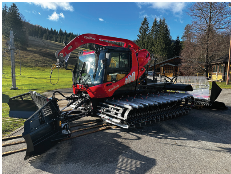
Nový ratrak bude pýchou nadchádzajúcej zimnej sezóny.

- Vlni sme vyhrali anketu o najlepšie golfové ihrisko na Slovensku. Tento rok sme skončili na druhom mieste. Čo ma ale teší, jamka číslo 9 sa stala tretíkrát po sebe najkrajšou v našej krajine. Za všetky ocenenia patrí veľká vďaka