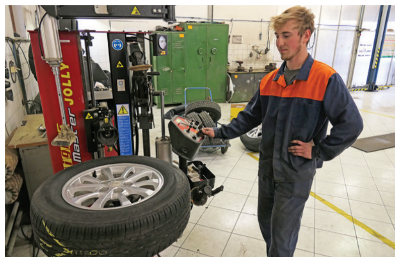
Pracovníci prevádzkarne doprava prezuli desiatky vozidiel.

„Vozidlám s pohonom len jednej nápravy odporúčam doplniť do výbavy snehové reťaze alebo