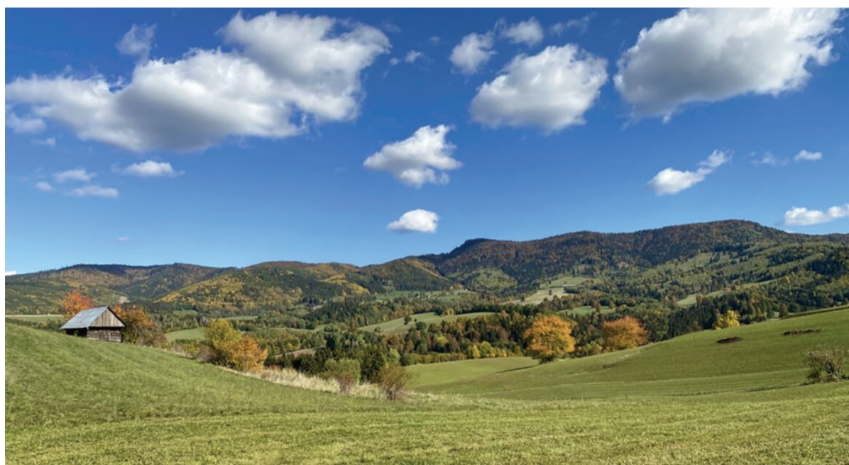
Jeseň pod Ľubietovským Veporom.