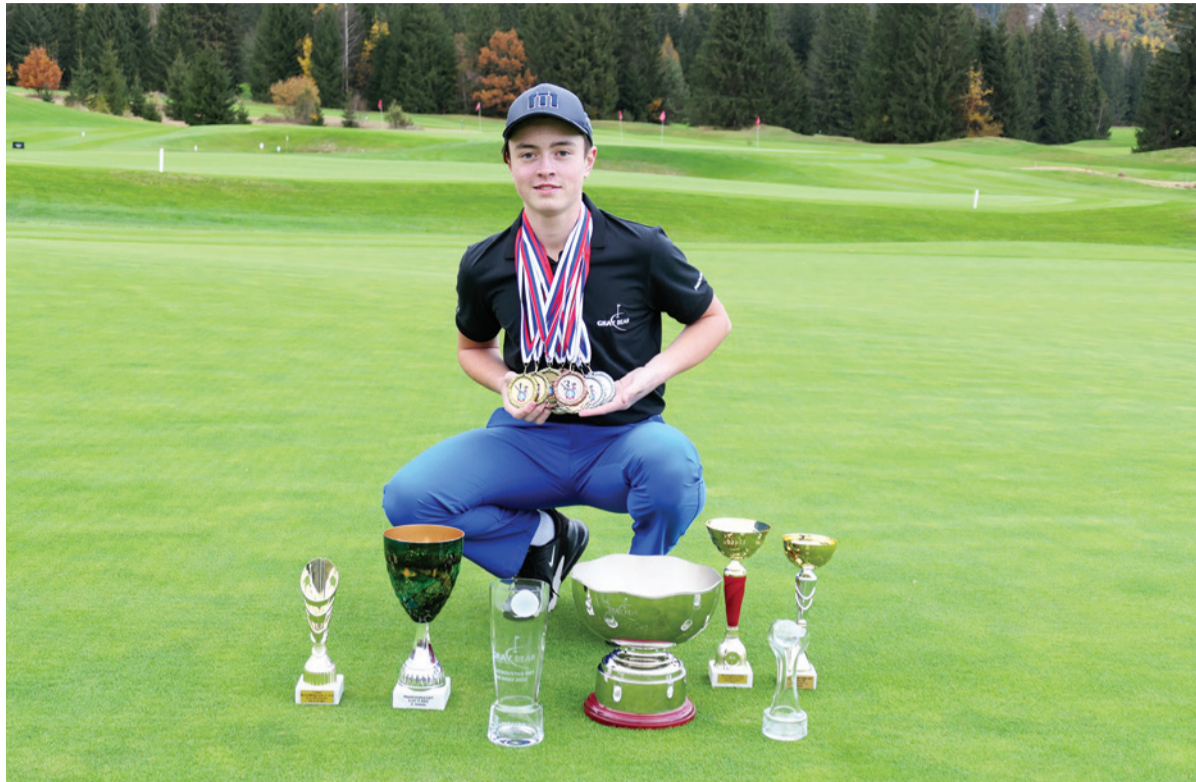
Martinova zbierka medailí a trofejí je už dnes bohatá a stále sa rozrastá.

Vstupom do golfovej akadémie na Táloch mal športový príbeh talentovaného chlapca z Horehronia