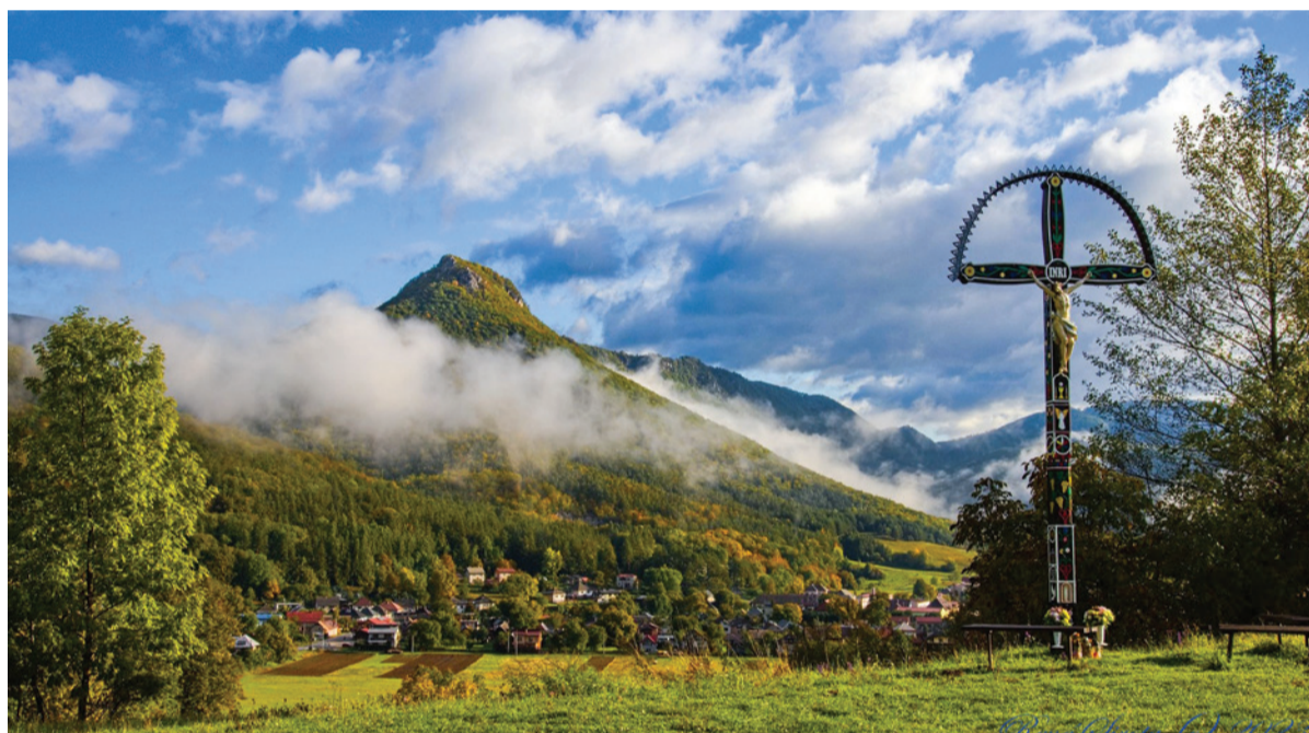
Z potuliek po Muránskej planine.