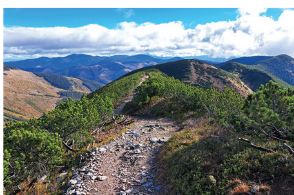
Na hrebeni Nízkych Tatier (vľavo) a túra z Majerovej skaly na Krížnu vo Veľkej Fatre (vpravo).