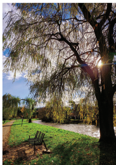
Jeseň pri Hrone v Brezne.