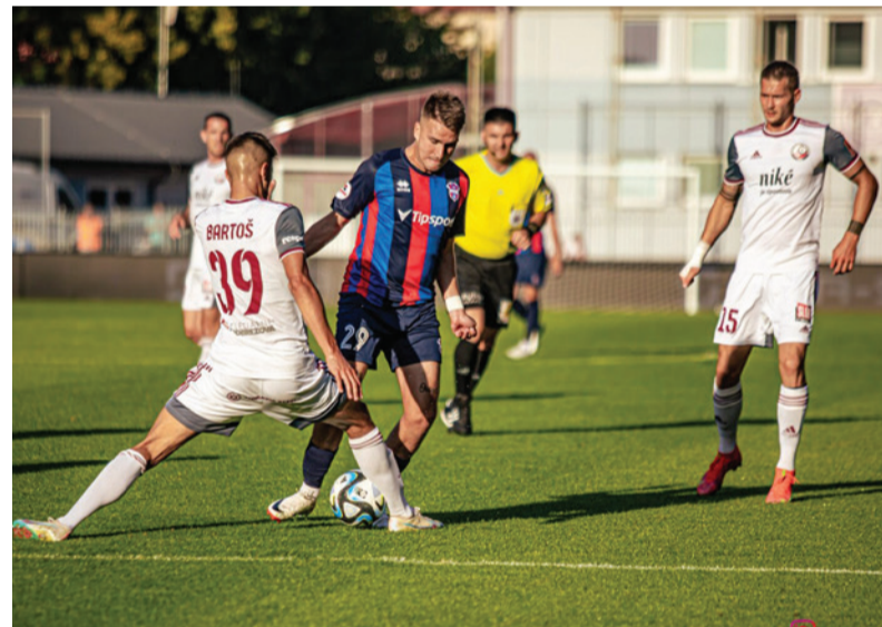
Zlaté Moravce sme zdolali aj druhýkrát v aktuálnom ročníku.

5. kolo, piatok, 17. novembra o 14.00 h: Zlaté Moravce – Podbrezová.