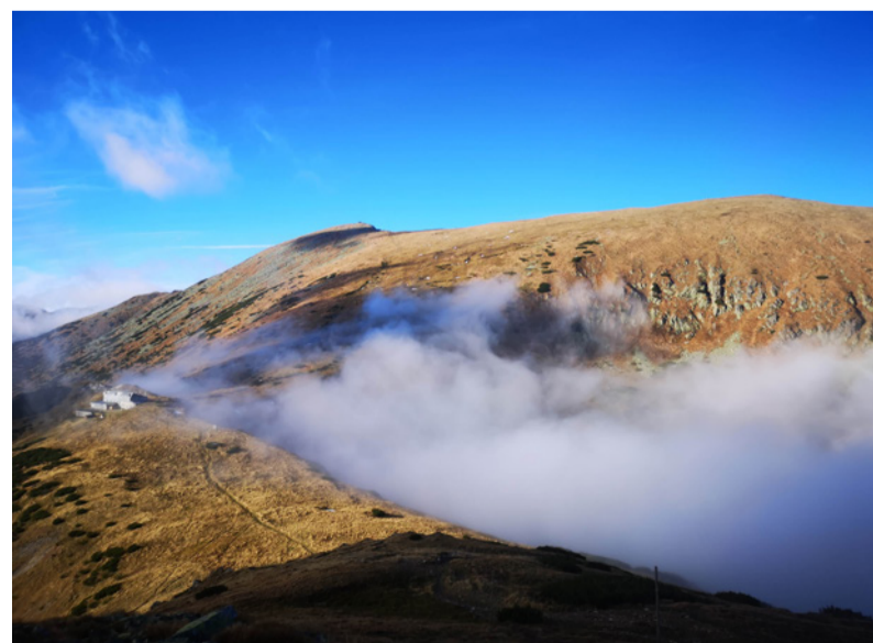
Nízke Tatry cestou na Chatu M. R. Štefánika.