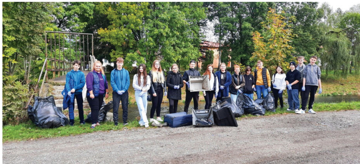
Žiaci z našej školy mysleli aj na životné prostredie. Upratili nábrežie Hrona i vybrané lokality v časti Lopej.

Aj my sme sa zapojili do tejto medzinárodnej iniciatívy. Naše Súkromné gymnázium Železiarne Podbrezová sme odprezentovali cez „Zelený Erasmus“. Už dlhšie sa snažíme riadiť heslom „Budúcnosť je v našich rukách“ a učíme