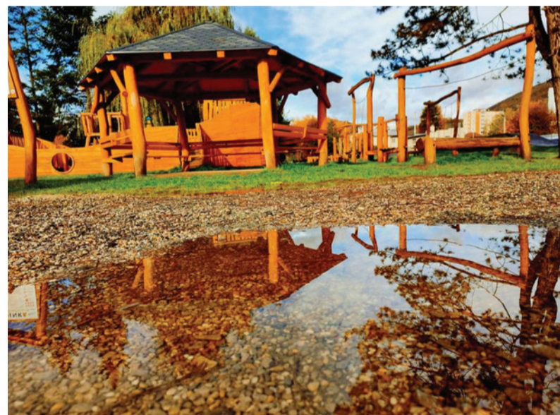
Pekný deň po daždi v Brezne.