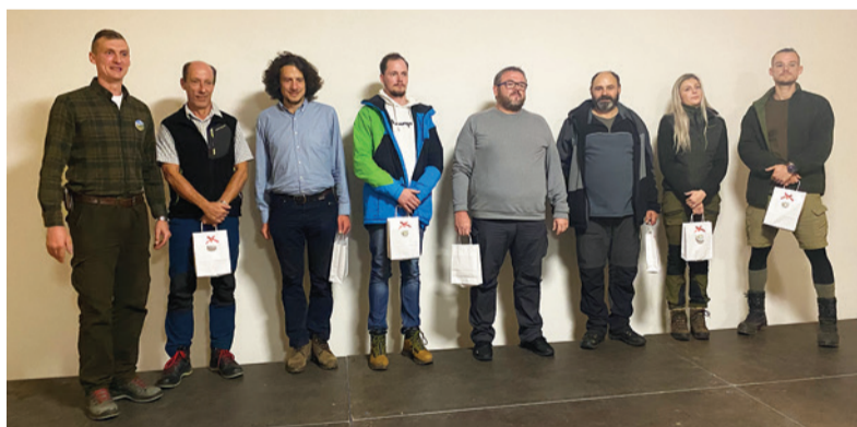
Niektorí z účastníkov vedeckého seminára.