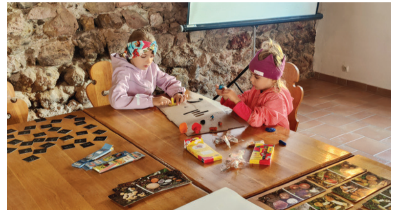
Deti uplatnili svoju tvorivosť pri kreslení, modelovaní a ďalších aktivitách.

na výstave zaujalo. Veľkej obľube sa tešila hra s hubovým pexesom a rozpoznávanie aromatických druhov aj podľa vône (ukrytej v dózach). Deti, ale aj dospelí si vyskúšali prácu s lupovým pohárikom. Prehliadka expozície sa nezaobišla bez múdrych alebo veselých detských komentárov a množstva hubárskych príhod detí s ich rodičmi či starými rodičmi, čím výstava mala okrem osvetového cieľa aj priateľský až rodinný charakter.