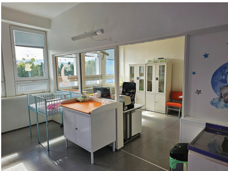
Vynovené priestory novorodeneckého oddelenia.