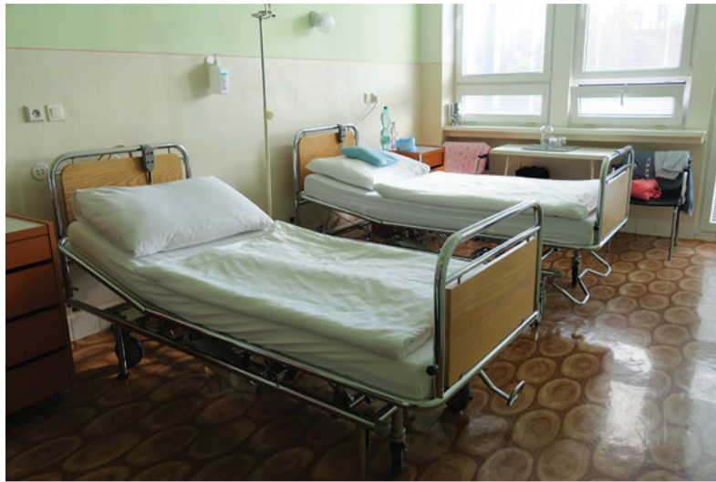
Pôvodná izba so staršími posteľami a nábytkom.