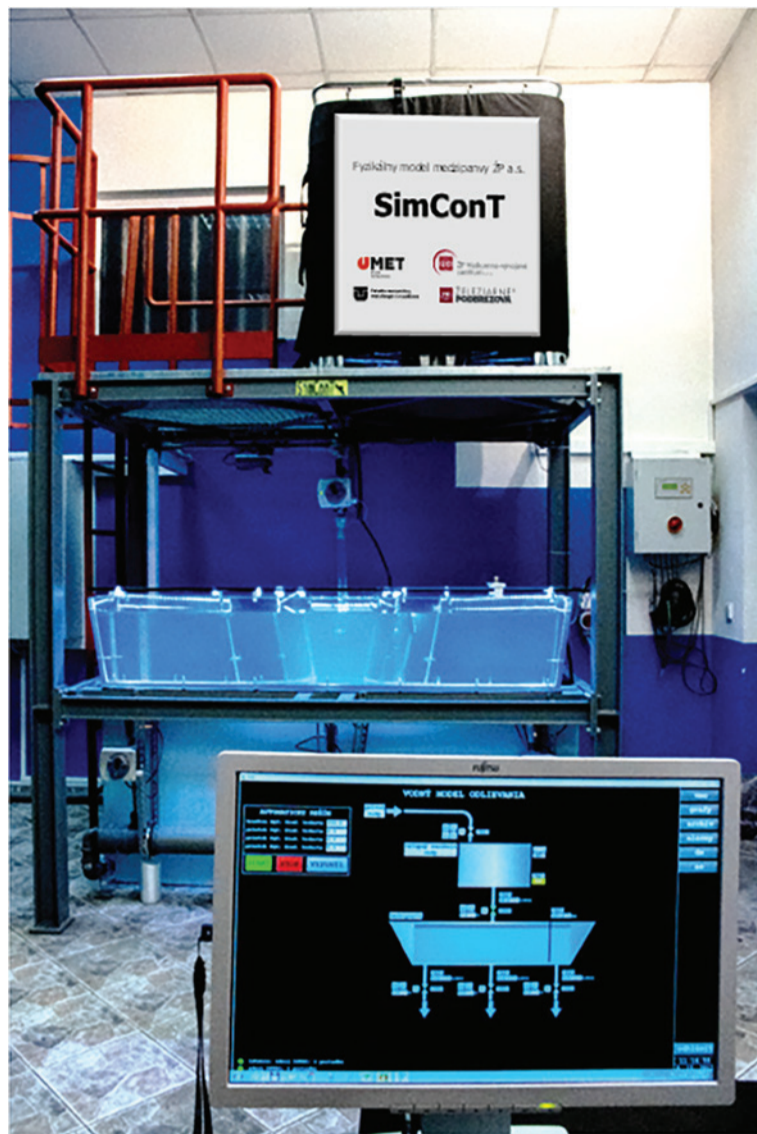
Laboratórium fyzikálneho modelovania prúdenia ocele v medzipanve.

Vybudovaním Laboratória vysokoteplotných korózných procesov, v spolupráci s Fakultou materiálov, metalurgie a recyklácie Technickej univerzity v Košiciach, sme získali možnosť vykonávať vo vlastnej réžii skúšky vzoriek rúr z ocelí určených do prostredia agresívnych spalín pri spaľovaní biomasy. Do