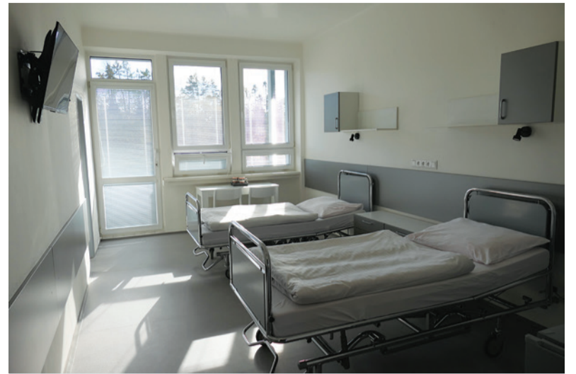
Pohľad na jednu z vynovených izieb.