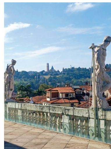
Strážcovia mesta Vicenza.