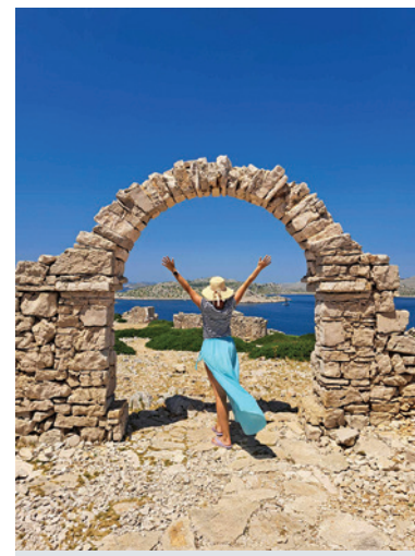
Národný park Kornati v Chorvátsku.