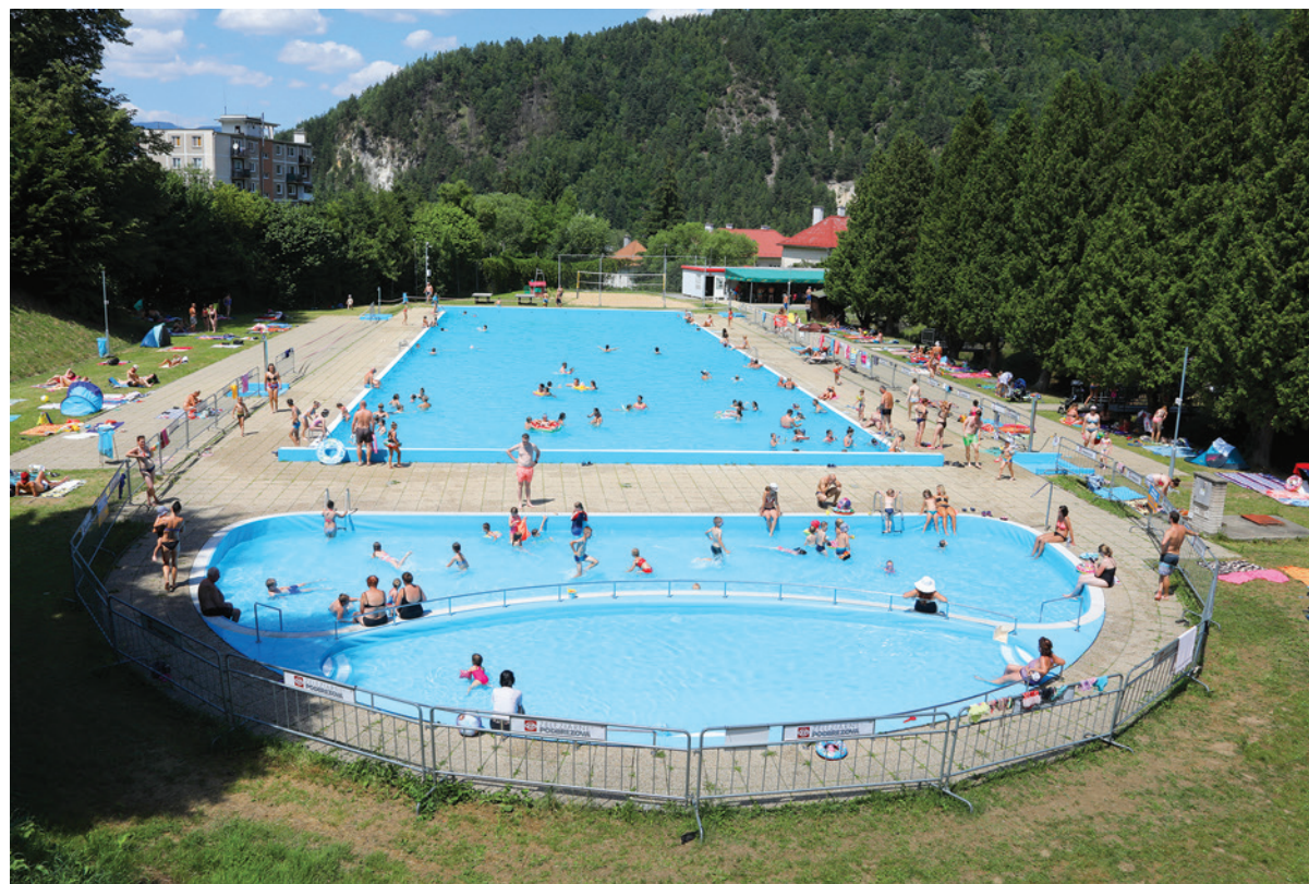
Kúpalisko v Podbrezovej navštívilo aj v tomto roku množstvo návštevníkov.