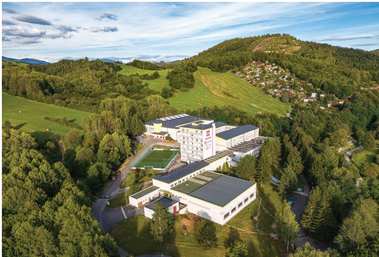
Súkromná spojená škola Železiarne Podbrezová po obnove.

Obnova školy sa netýkala len vonkajších priestorov, ale aj interiéru. Zamestnanci externých firiem realizovali väčšie či menšie stavebné práce, ktoré priniesú mnoho výhod. „V škole sme renovovali omietky, maľby, obklady či podlahy. Veľkou investíciou bola rekonštrukcia elektroinštalácie s novými zásuvkovými i svetelnými rozvodmi. Pôvodné interiérové svetlá sme