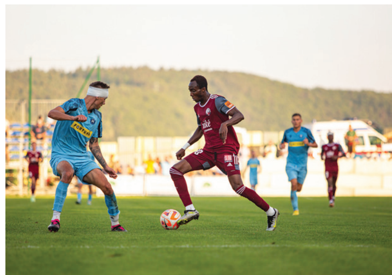
Základ víťazstva položili hráči Podbrezovej už v prvom polčase.

Následný žreb určil, že v ďalšom kole sa FK Železiarne Podbrezová stretne s druholigovým Trebišvom. Dátum a čas zápasu ešte nie sú známe.