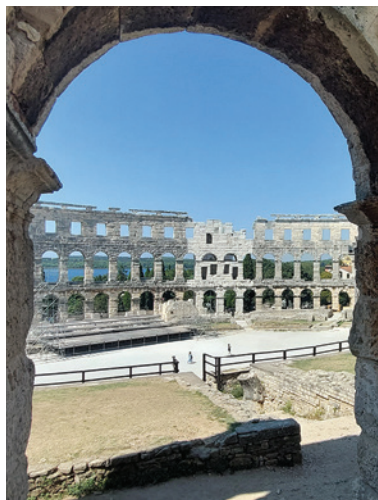
Amfiteáter v chorvátskom meste Pula na polostrove Istria.