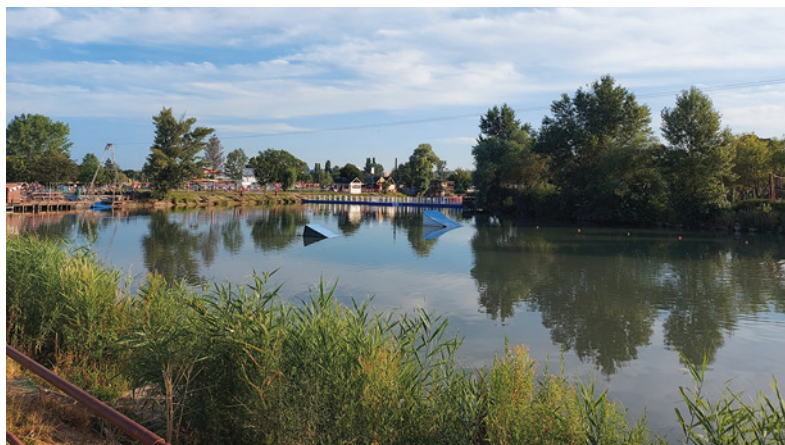
Dovolenka v Štúrove.