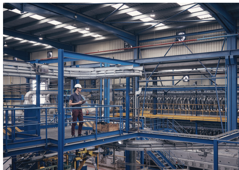
Ťaháreň rúr Transmesa v Arenys de Mar.

Uvedomujeme si, že dosiahnuté stanovené objemy a potrebnú cenovú úroveň bude v nasledujúcich mesiacoch mimoriadne náročné.