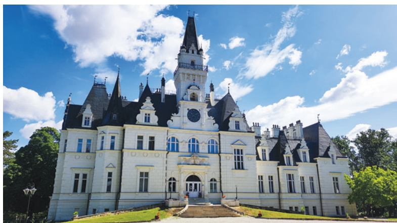
Kaštieľ Budmerice.