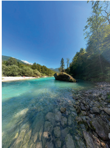
Krásy prírody v Slovinsku.

Niektorí ste dovolenkovali v zahraničí, iní doma, niekto dal prednosť pobytu v horách a ďalší si radšej oddýchli pri mori. V týchto dňoch je už leto definitívne za nami. Jeseň je však najfarebnejšie a najfotogenickejšie ročné obdobie, preto vás opäť vyzývame, aby ste sa pochválili svojimi zábermi. V niektorom z ďalších vydaní novín uverejníme vaše fotografie.