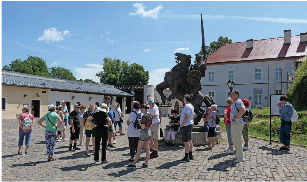
Na hrad Ľupča zavítali aj počas tohtoročnej letnej sezóny stovky návštevníkov.

Hradné múry sa počas letných mesiacov rozozvučali tónmi hudby popredných českých a slovenských umelcov. Publika sa postupne predstavili Lucie Bílá, Lenka Filipová a Pavol Hammel. Napriek tomu, že koncerty boli realizované prostredníctvom prenájmu priestorov, predstavovali organizačnú výzvu aj pre správu hradu, počas ktorej boli preverené technické