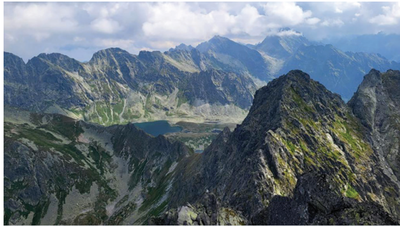
Túra vo Vysokých Tatrách.