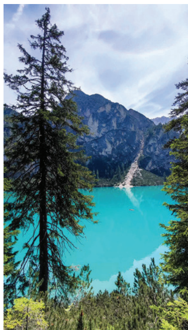
Letná dovolenka v Dolomitoch – Lago di Braies.