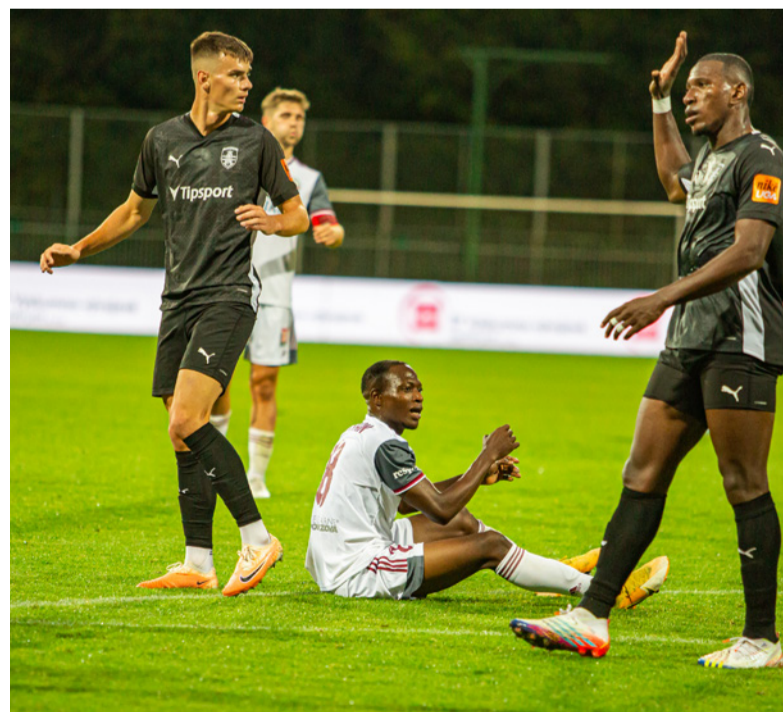
Hráči Skalice (v čiernom) bojovali nielen so súperom, ale aj so zdravotnými problémami.

A na otázku, či išlo o jeho životný gól, so širokým úsmevom dodal: „Určite nie. Strelil som aj krajšie, ktoré nie sú nikdy zaznamenané. Z oficiálnych gólov však bol určite životný. Verím, že krajšie ešte prídu.“