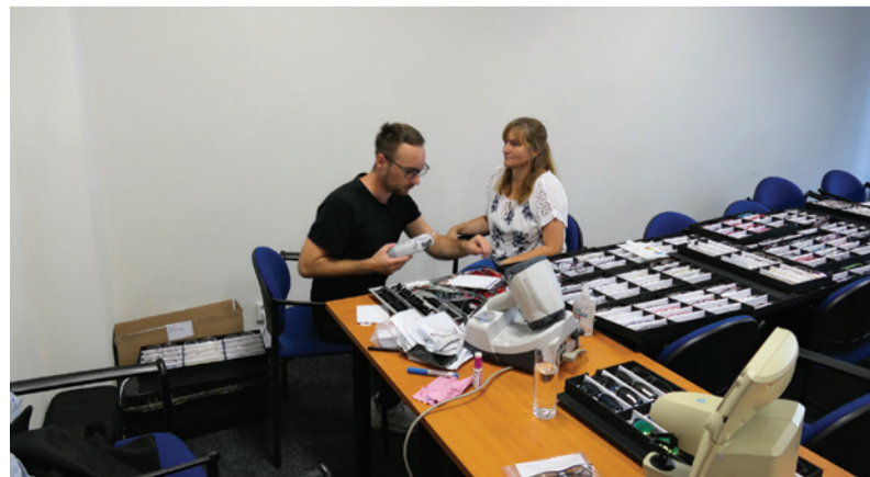
Naši zamestnanci mali možnosť absolvovať aj kontrolu zraku.