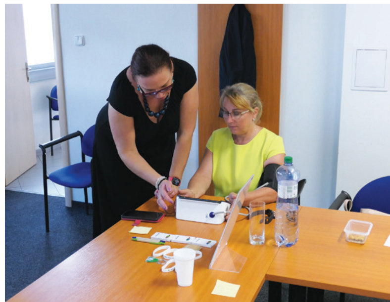
Zamestnanci ŽP a.s. mohli získať informácie o svojom zdravotnom stave.