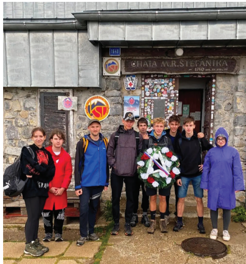
Naši žiaci s učiteľom J. Čieľom pred Chatou Milana Rastislava Štefánika.

Účastníci sa zhodli, že podobné stretnutia majú zmysel a tešia sa na podobné podujatia aj v budúcnosti.