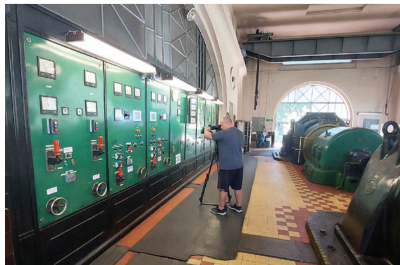
V interiéri hydrocentrály.

V závere minulého mesiaca zavítal do Jasenia štáb Rozhlasu a televízie Slovenska (RTVS), aby natočil reportáž práve o tejto výnimočnej technickej pamiatke. Filmári si pozreli historickú budovu hydrocentrály, ktorá bola postavená pred