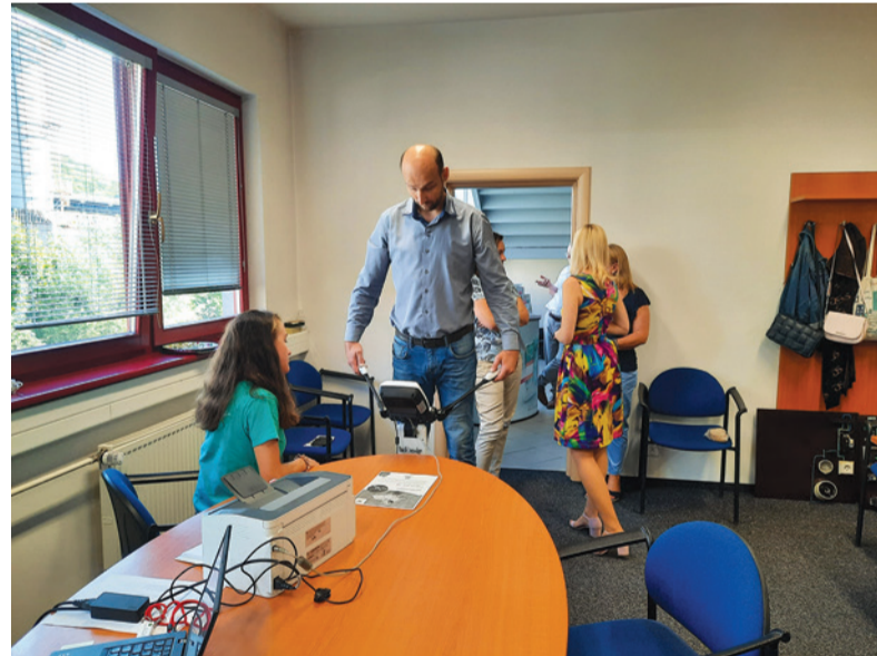
Meranie telesných hodnôt prístrojom InBody.

„Podujatia Dni zdravia sa zúčastnili desiatky našich kolegov, ktorí sa mohli bližšie oboznámiť so svojím zdravotným stavom. S odborníkmi z oblasti zdravotníctva mali možnosť konzultovať svoj zdravotný stav a poradiť sa, ako zmeniť životný štýl, byť zdravším a ako sa správne chrániť pred chorobami. Prevencia je totiž veľmi dôležitá, čo si mnohí ľudia neuvedomujú. Verím, že podobné akcie sa budú tešiť rovnakej priazni aj v budúcich rokoch,“ uzavrela koordinátorka.