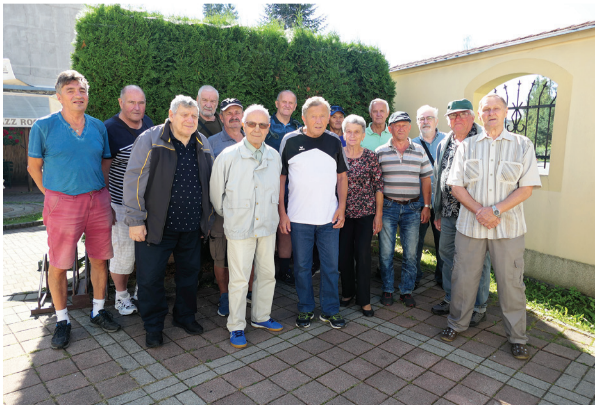
Účastníci stretnutia bývalých zamestnancov Železiarní Podbrezová.

Naši bývalí kolegovia v družnej debate rozoberali mnohé témy, no predovšetkým spomínali na časy, keď boli zamestnancami podniku. V pamäti im zostali spomienky na príjemné i ťažšie časy. Zhodli sa