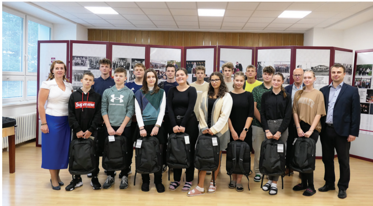
Gymnazisti majú pred sebou štyri roky štúdia na strednej škole. Uľahčia im ho aj nové notebooky.

„Dnes sa všetko točí okolo informačných technológií. Preto vám prajem, aby vám notebooky slúžili a prostredníctvom nich ste získali veľa nových vedomostí. Verím, že