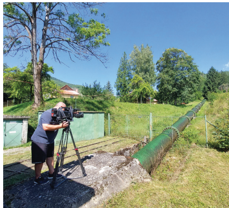
Počas nakrúcania reportáže o hydrocentrále v Jasení.