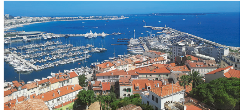
Júlový výlet do francúzskeho Nice.