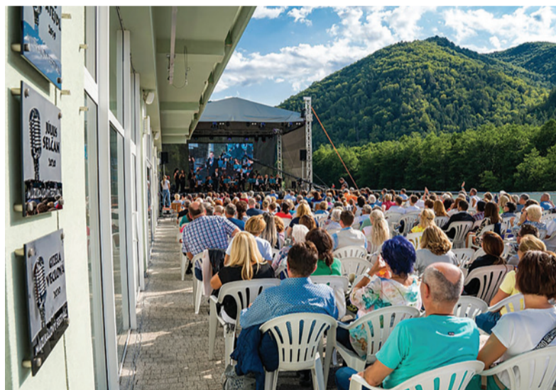
Podujatiu prialo aj počasie.

Krásne počasie prialo všetkým návštevníkom, ale aj oceneným