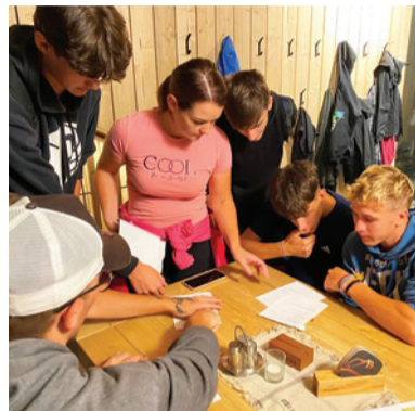
Podbrezovskí študenti boli úspešní vo vedomostnom kvíze.

Zúčastnené družstvá boli odmenené diplomom, pripravený bol