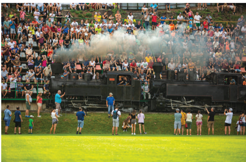
Prejazd historického vláčika bol pre všetkých veľkým zážitkom.