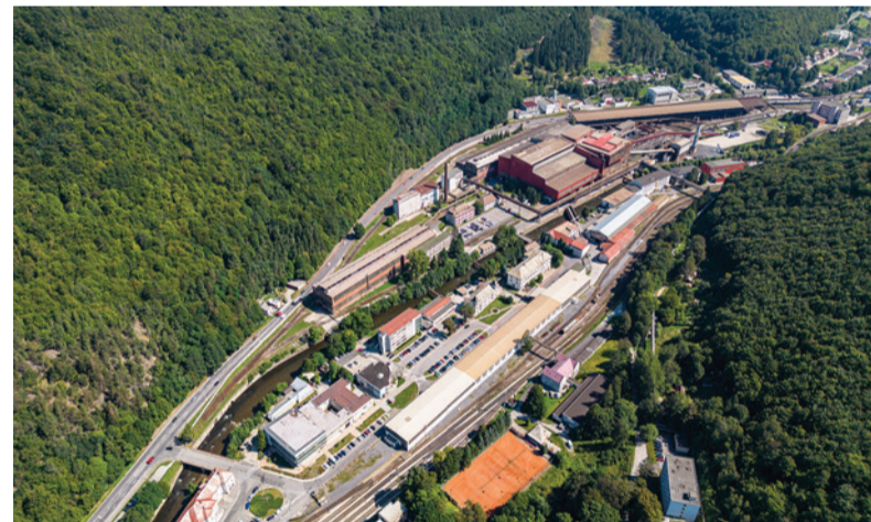
Pohľad na starý závod objektívom Ľudovíta Lacušku.

- Beriem so sebou ťažký batoh, v ktorom mám všetko potrebné. V súčasnosti mám niekoľko zrkadloviek, mnoho objektívov a ďalšie príslušenstvo. Ale keď chce človek urobiť dobrý záber a fotenie ho skutočne baví, nehľadí na to, čo má na chrbte, ale rozmýšľa, akú fotografiu urobí. Fotenie je skutočne láska na celý život. Ja som toho živým dôkazom.