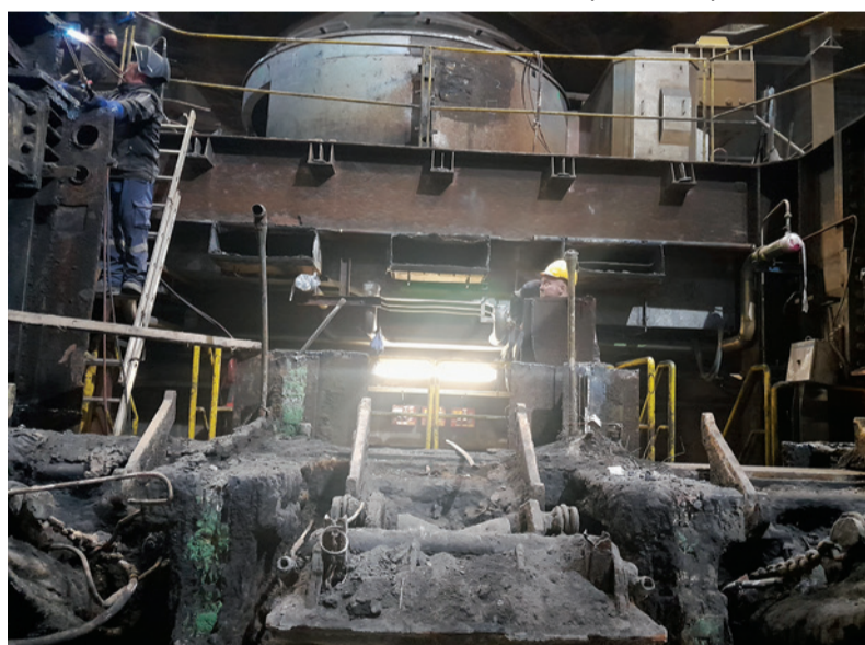
Demontáž pôvodnej sekundárnej komory ZPO.