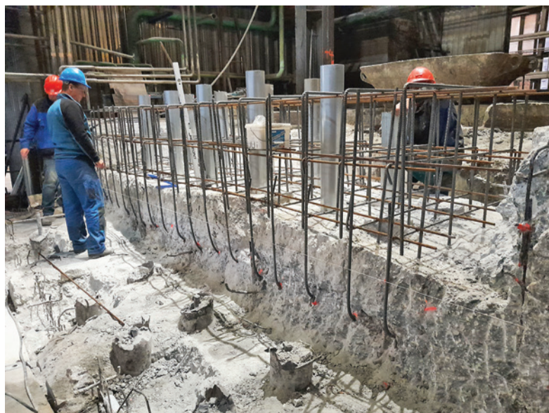
Zhotovovanie ocelevej armatúry pre vystuženie nových základov.