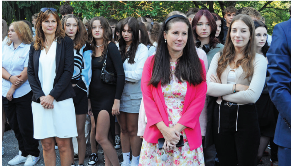
Nový školský rok prináša očakávania pre žiakov i pedagógov.