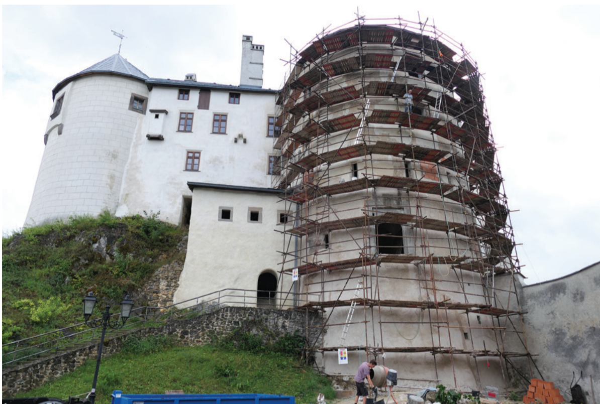
Súčasná obnova barbakanu.

V ďalších vydaniach novín Podbrezovan sa bližšie pozrieme na obnovu fasády barbakanu.