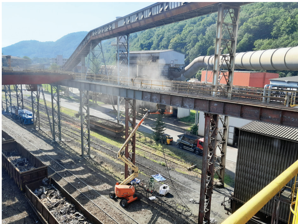
Obnovenie náteru žeriavovej dráhy prekládkového šrotového poľa.

„Betón bol viditeľne poškodený. Pri realizácii jadrových vrstov pre kotviace skrutky sme zistili vysokú degradáciu jeho štruktúry v celom priereze. Nenašli sme ani na oceľovú armatúru, čo malo za následok, že sme boli nútení riešiť rozsiahlu opravu. Za pomoci stati-