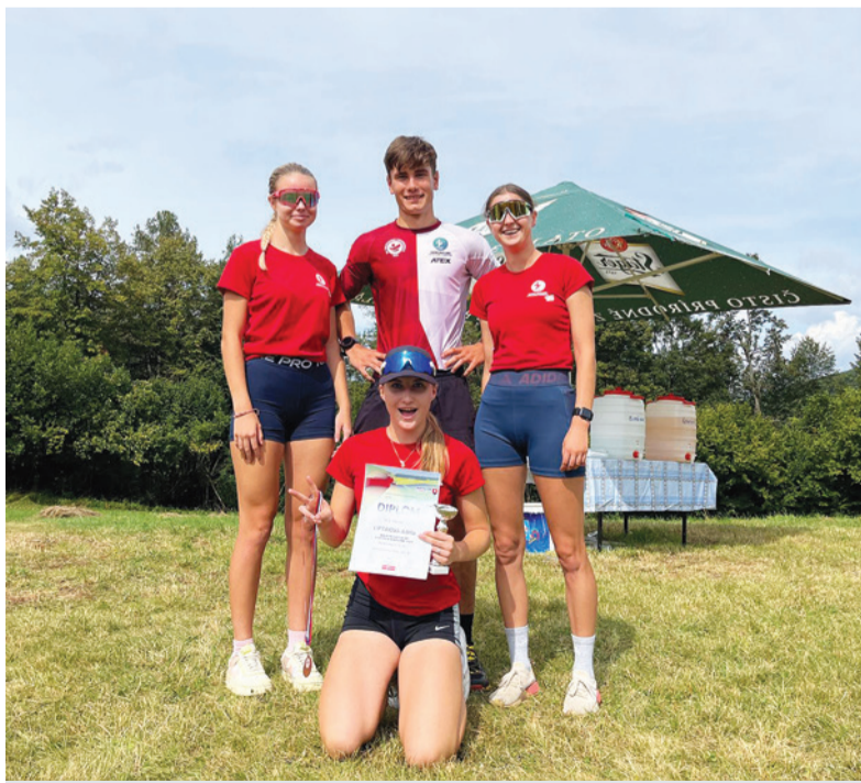
Členovia Biatlonového oddielu ŠK Železiarne Podbrezová na M-SR vo Vyhniach.