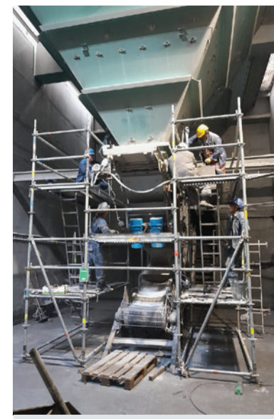
Výmena trasáku násypky hlbinného dopravníka dopravy prísad.