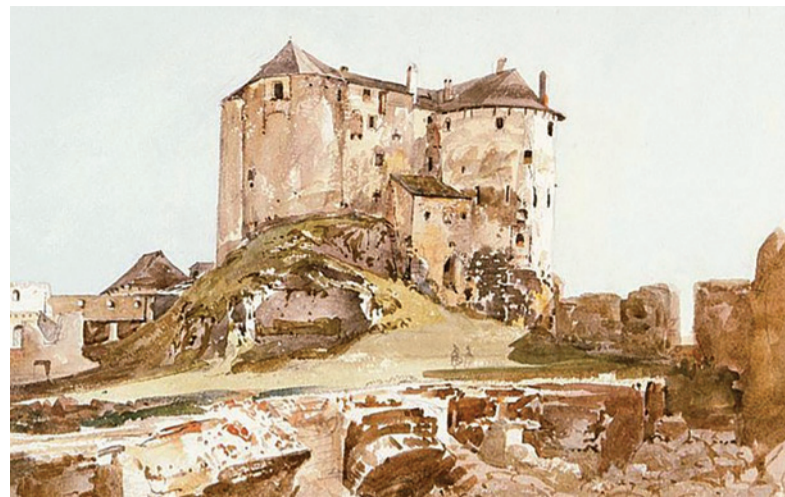
Hrad Ľupča z dolného nádvorja tesne po ničivom požiari v roku 1860. Celkom vpravo barbakan. Maľba Thomasa Endera

Torzovitý stav, poznačený zásahmi z mladších stavebných etáp, dosiaľ neposkytoval dokonalú prezentáciu pôvodnej obrannej funkcie barbakanu, ale plánovaná obnova s ňou počítala v plnej miere. Vzhľadom na to, že už základný architektonicko-historický výskum z roku 2003 zistil veľký rozsah zachovania pôvodnej neskorostredovekej bašty, bola navrhnutá rozsiahla prezentácia odkrytých detailov a odstránenie niektorých mladších konštrukcií. Aktuálny výskum doplnil poznatky o stavebnom vývoji bašty a predovšetkým detailne stanovil možnosti fortifikačných prvkov a omietok. Súbežne s architektonicko-historickým a umelecko-historickým výskumom prebiehali konzultácie s reštaurátorom o návrhu obnovy. Cieľom reštaurá-