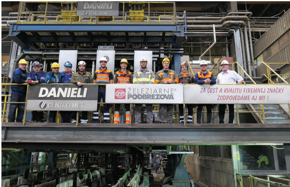
Zamestnanci prevádzkárni oceliaren, centrálna údržba a odboru technického a investičného rozvoja, spolu s externými pracovníkmi firiem Danieli, MONTIS BAU a PKS service, krátko pred ukončením veľkej strednej opravy.

de potreby, vedeli jednotlivé väčšie úlohy postupne naplánovať. Investície podobného charakteru sa nedajú uskutočniť hneď. Niektoré veci sa plánujú mesiace, niekedy aj roky dopredu. Počas bežnej výroby sledujeme nielen činnosť jednotlivých zariadení, ale vyhodnocujeme aj ich životnosť či cyklus výmeny. Na základe týchto poznatkov prehodnotíme, čo je nutné opraviť a kedy,“ vysvetlil.