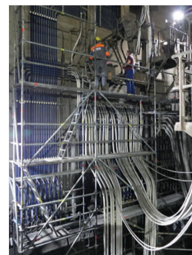
Výmena rozvodov vody chladenia ramien EAF.