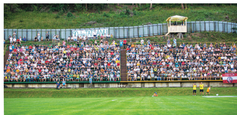
Na tribúne vládla počas zápasu skvelá atmosféra. Atraktívny duel si nenechali ujsť stovky divákov.

Pohárová súťaž na Slovensku opäť ukázala, že píše pekné príbehy. Ten horehronský sa určite zaradil medzi najkrajšie. Znovu sa potvrdilo, že futbal ľudí spája. A je jedno, či ide o profesionálny alebo amatérsky. Podstatná je radosť z hry, priateľská atmosféra a spoločné stretnutia.