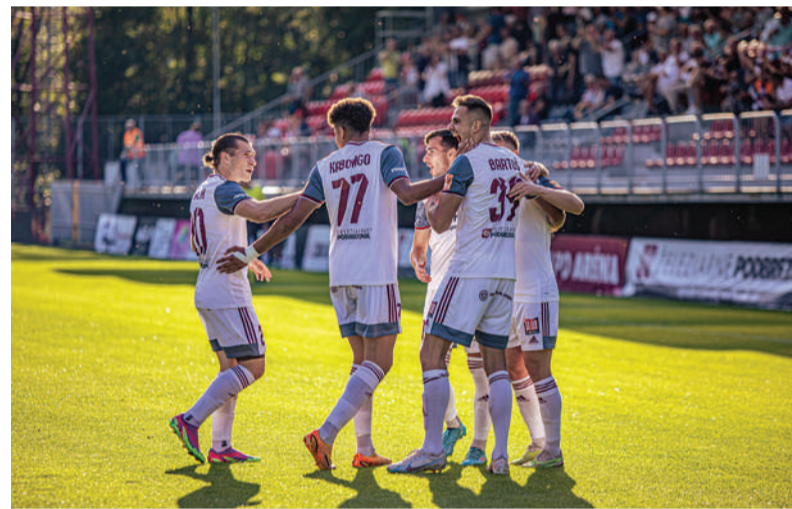
Železiari sa tešia z gólu do siete Zlatých Moraviec.

6. kolo: nedeľa, 3. septembra o 18.00 h: Slovan – Podbrezová.