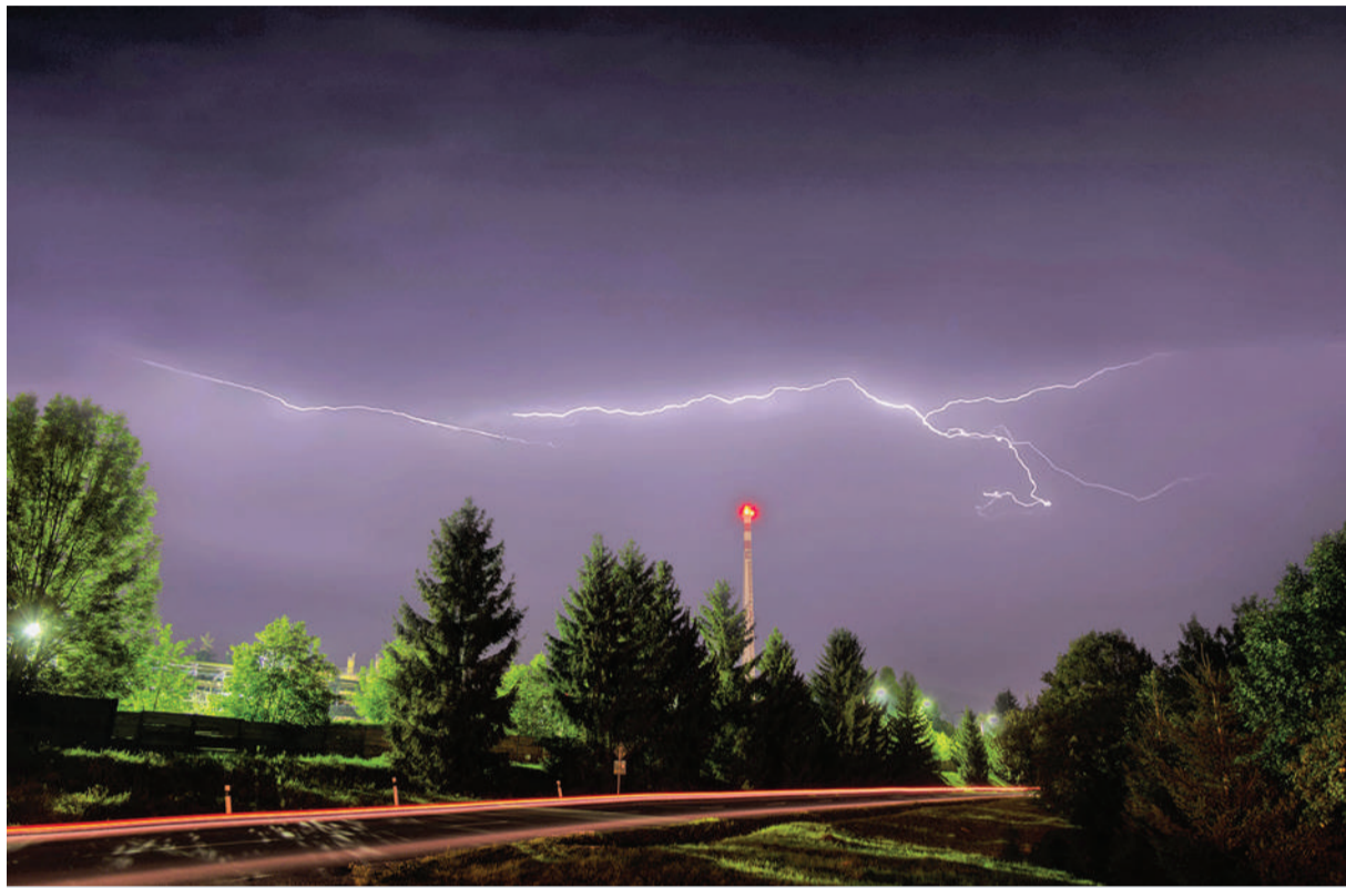
Augustová búrka nad novým závodom.

„Voda so sebou berie z brehov rôzne nečistoty. Nejde pritom len o kôň, pokosenú trávu či iný prírodný odpad, ale aj odpad produkovaný ľuďmi. V takomto prípade musíme hate neustále čistiť,“ pokračoval J.