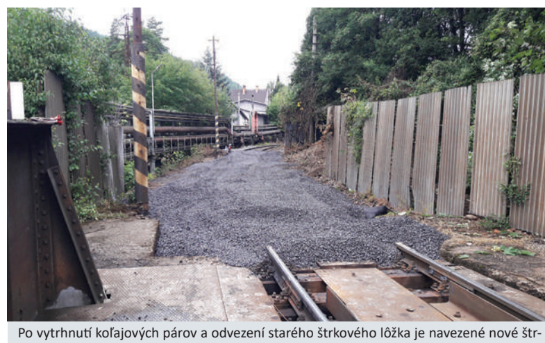
Po vytrhnutí koľajových párov a odvezení starého štrkového lôžka je navezené nové štrkové lôžko z UHK, ktoré bude následne zhutnené a vytvarované ako základ pod novú koľaj.