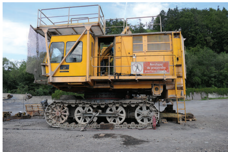
Pásový žeriav na šrotovom poli Piesok.

„Za jeden výlukový blok vymeníme 37,5 metra koľaje. Celkovo by sme mali opraviť 200 metrov.“