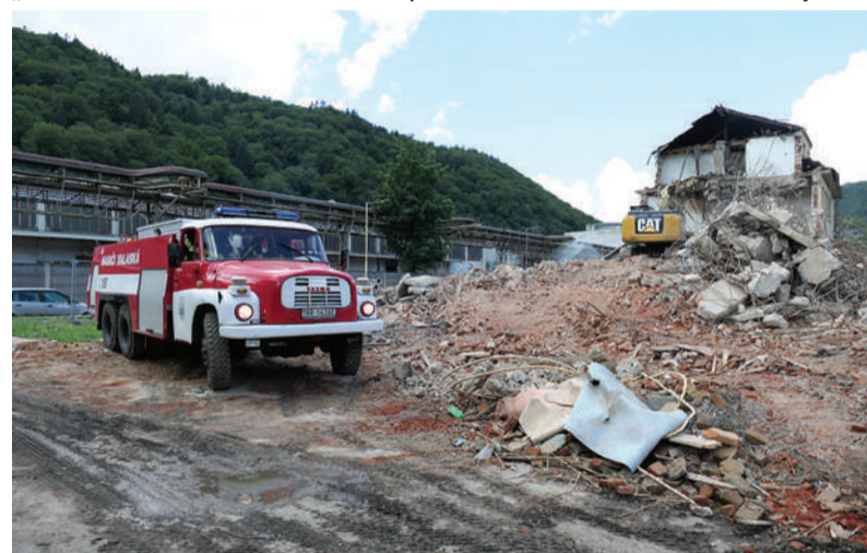
Hasiči počas búrania pravidelne kropili vodu pozemok i okolie.