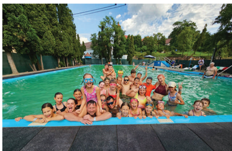
Kúpanie v termálnych bazénoch v Sklených Tepliciach sa deťom páčilo.