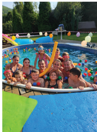
K dispozícii bol aj bazén priamo v areáli tábora.