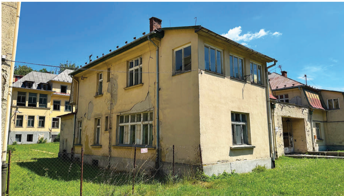
Bývalá nemocnica v Podbrezovej tesne pred začatím búracích prác.

Areál bývalej nemocnice v Podbrezovej vlastní železiarne už dve desaťročia. „Už v čase kúpy boli nehnuteľnosti zakúpené ako schátrané a nevhodné k bývaniu. Počas ďalšieho obdobia sa nevyhovujúci technický stav len zhoršoval. Presakovali, napríklad, podzemné vody do suterénnych priestorov, strechy boli nevyhovujúce, schátrané a robili sme len najnutnejšie opravy k zachovaniu objektov. Hoci sme chceli v posledných rokoch aspoň hlavnú budovu nemocnice zachrániť a rekonštruovať, nakoniec bolo rozhodnuté, že kvôli veľmi zlému technickému stavu zbúrame všetky stavby a v budúcnosti postavíme nové. Celý pozemok ostáva naďalej vo vlastníctve Železiarní Podbrezová,“ dodal v závere vedúci odboru technického a investičného rozvoja.