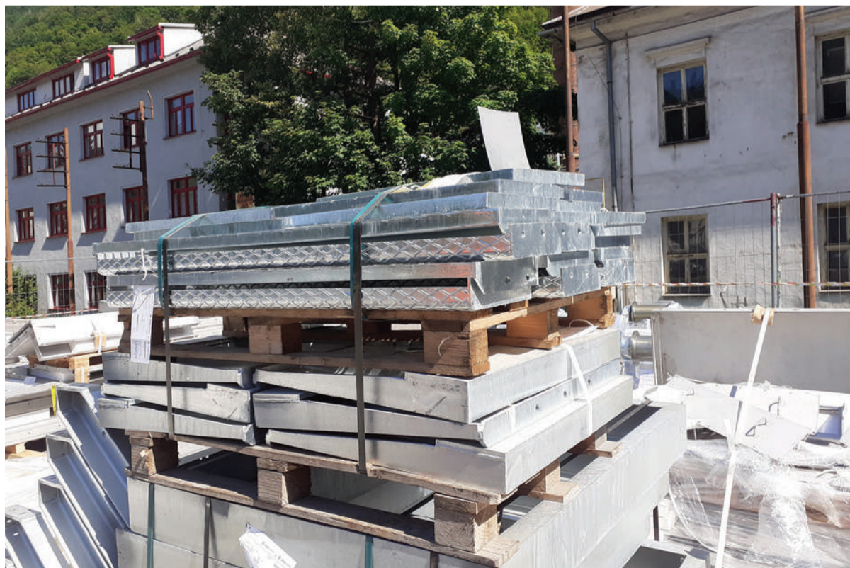
Prípravené náhradné diely na zariadenie plynulého odlievania.

Podrobnejšie informácie o strednej oprave v oceliarni a jej priebehu vám prinesieme v nasledujúcom vydaní novín Podbrezovan.