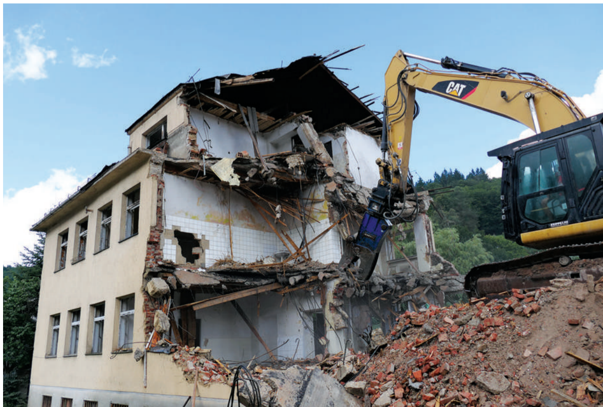
Kvôli veľmi zlému technickému stavu boli zburané všetky stavby v areáli bývalej nemocnice.

Nahromadený stavebný odpad z búracích prác zhodnocuje oprávnená organizácia a výstup z recyk-