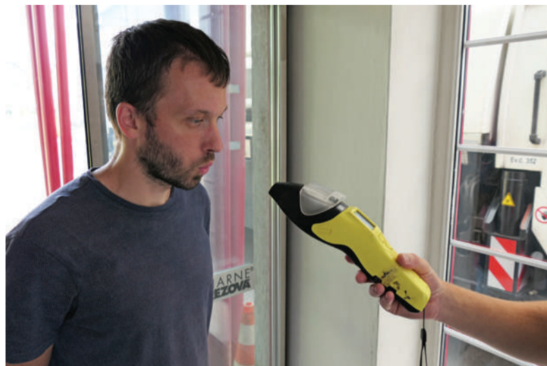
Dychová skúška na hlavnej bráne v starom závode.

Čo je však mimoriadne závažné, v mnohých prípadoch nejde o hraničné hodnoty, ale o vysokú hladinu nameraného alkoholu v dychu. Previnilci si pritom neuvedomujú, čo všetko môžu svojim konaním spôsobiť. Zamestnanec pod vplyvom alkoholu je menej opatrný a výrazne sa zvyšuje riziko pracovného úrazu. Ublížiť tak môže nielen sebe, ale aj niekomu inému. Rovnako hrozia vysoké materiálne škody. V takomto prípade už nejde len o