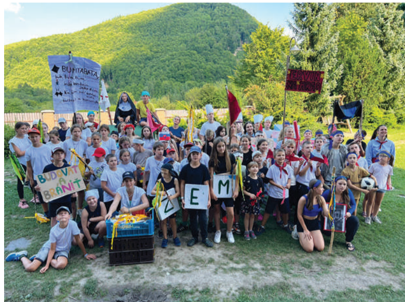
Budovať a brániť – to bolo heslo prvého týždňa v tábore Repište.