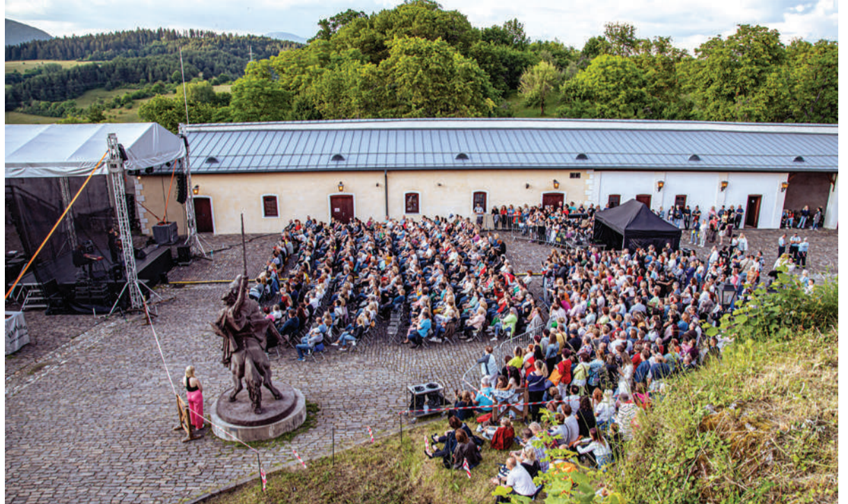
Koncerty na nádvorí hradu mali neopakovateľnú atmosféru.

Druhým letným koncertom na Ľupčianskom hrade bolo vystúpenie českej speváčky Lenky Filipovej. Oproti predchádzajúcemu koncertu išlo o komornejšie po-