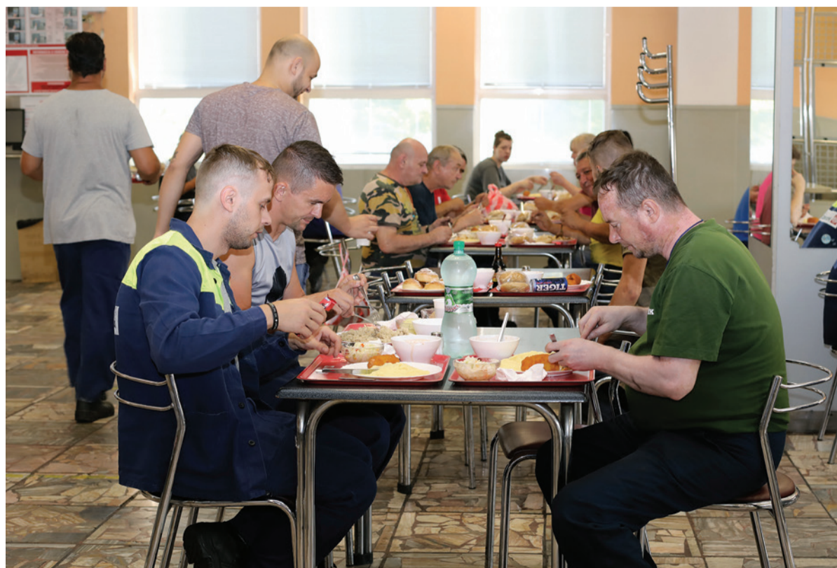
Stravníci majú na výber z rôznych druhov jedál.

- Brigádnik má takisto nárok na stravu po odpracovaní zmeny. To isté platí aj pri novoprijatých zamestnancoch. V prípade, ak pracujú dvanásťhodinovú pracovnú zmenu, vzniká nárok aj na druhú dotovanú stravu.