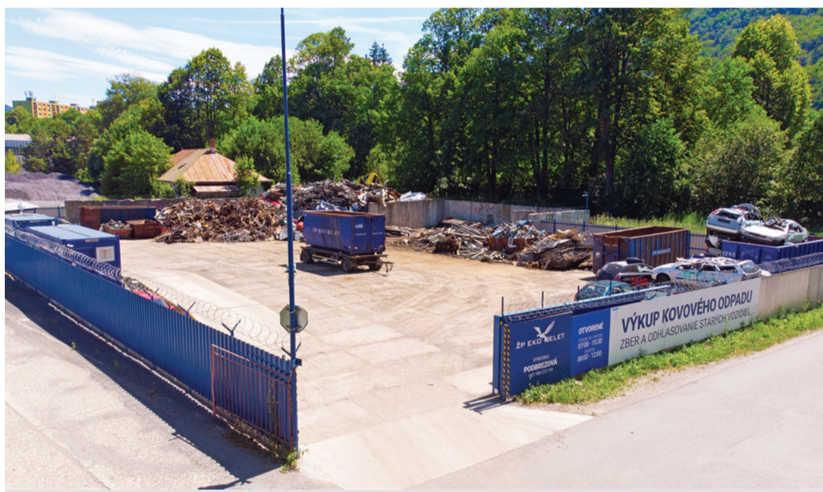
Jedno z najnovších stredísk spoločnosti, nachádzajúce sa v areáli bývalej píly Štiavnička.

“Som presvedčený, že ocel' bude ešte dlho patriť k základným materiálým pilierom rozvoja ekonomík, preto nemám dôvod pochybovať o jej budúcnosti.