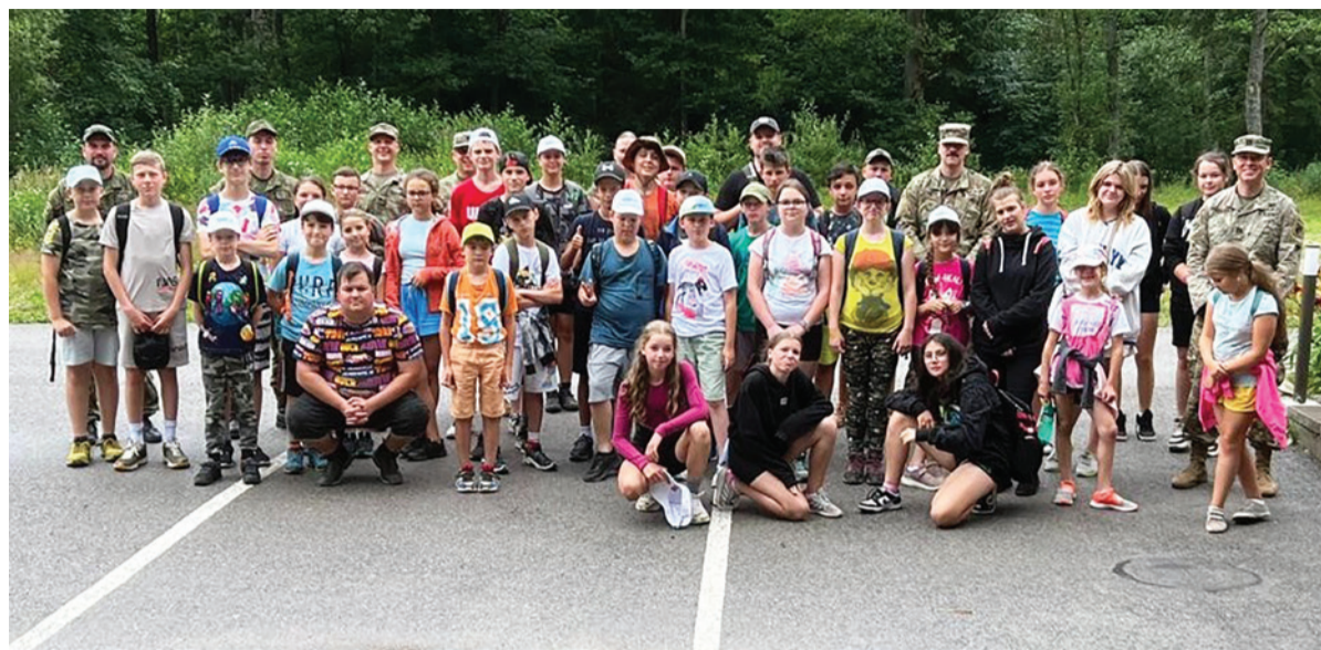
Účastníci druhého turnusu pobytového tábora v Bystrej v spoločnosti vojakov.

Účastníkov tábora každý rok poťešia i vojaci, medzi ktorými sú aj takí, ktorí rozprávajú výlučne po anglicky. „Ukazujú im rôzne veci z terénu, majú štyri táboriská a zaujímavosťou je, že deťom predstavia vojenské jedlo, ktoré sa na fronte konzumuje,“ doplnil.