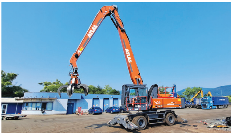
Najnovší prírastok do technického vybavenia spoločnosti ŽP EKO QELET a.s. – hydraulický nakladač ATLAS 350.