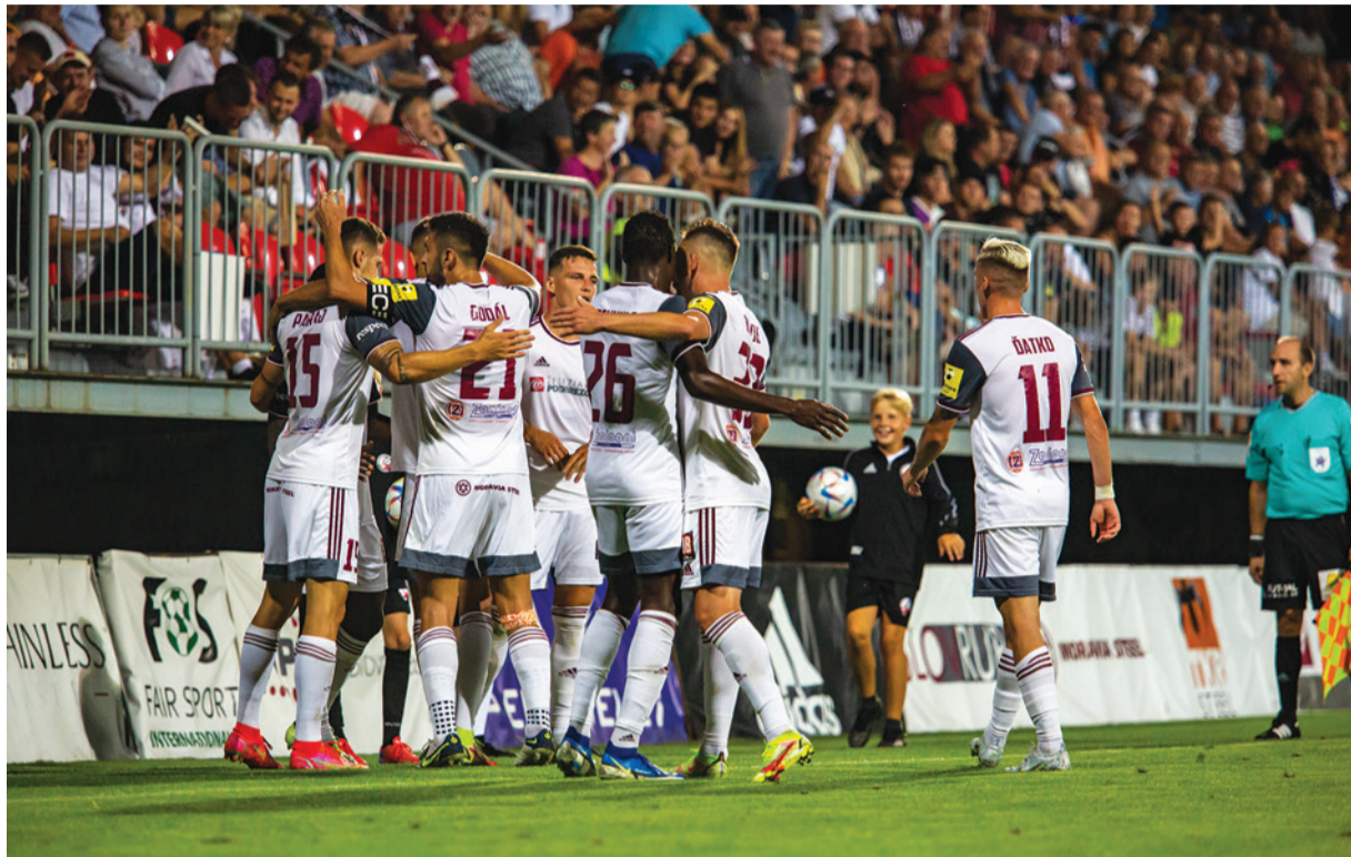
Veríme, že aj v novej sezóne nám železiari pripraví veľa dôvodov na radosť, podobne ako v minulom ročníku.

„Progres vnímajú všetci, ktorí nás sledujú. Na druhej strane je skutočnosť, akým spôsobom pracujeme s kádrom. Každý rok sa snažíme, aby sme mohli hrať náročnejší futbal a aby dostávali príležitosť hráči, ktorí