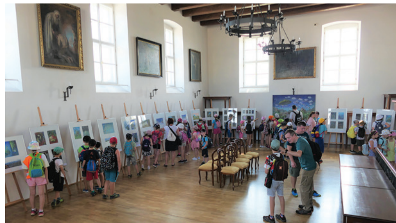
Účastníci detského tábora počas prehliadky obrazov v Spoločenskej sále.

- Bol inšpirovaný týmto priestorom, aj obrazom, ktorý som dal ako nosný, že v oblakoch sú ďalšie priestory.