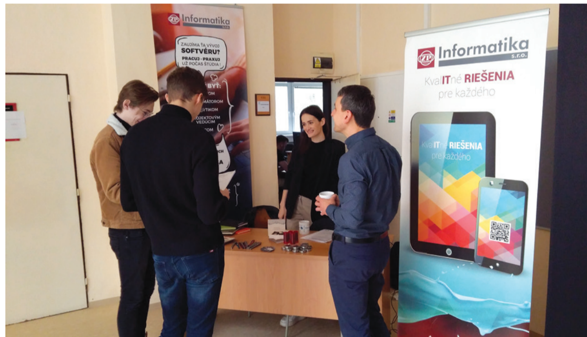
Prezentácia spoločnosti ŽP Informatika s.r.o. na Univerzite Matejka Bela v Banskej Bystrici v rámci náboru študentov – potenciálnych zamestnancov.

Atesty. Dokončujeme úvodný projekt Finančný server a vo všetkých ostatných projektoch pokračujeme v realizácii. V oblasti vývoja prebieha rozvoj informačných systémov (realizácia požiadaviek na zmenu, riešenie servisných požiadaviek a odstraňovanie incidentov) v ŽP a.s., dcérskych spoločnostiach, spoločnosti ŽDAS a ďalších odberateľov podľa platných outsourcingových zmlúv. Popri realizácii uvedeného vývoja informačného systému zostáva aj naďalej prioritou zabezpečenie jeho bezporuchovej prevádzky – v tejto oblasti nás čaká realizácia upgrade UPS vo výpočtovom stredisku v starom závode, upgrade klimatických jednotiek a inštalácia motorgenerátora vo výpočtovom stredisku v novom závode. V neposlednej miere je to upgrade bezpečnostných komponentov – produktov ESET, Whalebone a Cisco Prime.