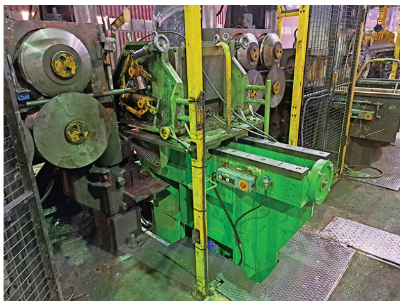
Defektomat hornej linky, kde bol vymenený stôl skúšobnej hlavy a vodiacich treibrov.

“ Najbližšie týždne a mesiace ukážu, do akej miery sa nám podarilo naše ciele naplniť a veríme, že budeme môcť konštatovať, že všetky zrealizované práce dopadli z kvalitatívneho hľadiska dobre.