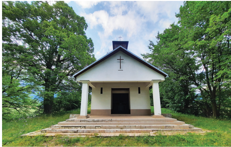
Kaplnka na vrchole kalvárie v Predajnej.

Kalvária na vrchu Hrádok má netradičnú architektúru. V betónovom podstavci je osadený drevený stĺp s označením zastavenia a malým obrázkom. Drevo chráni