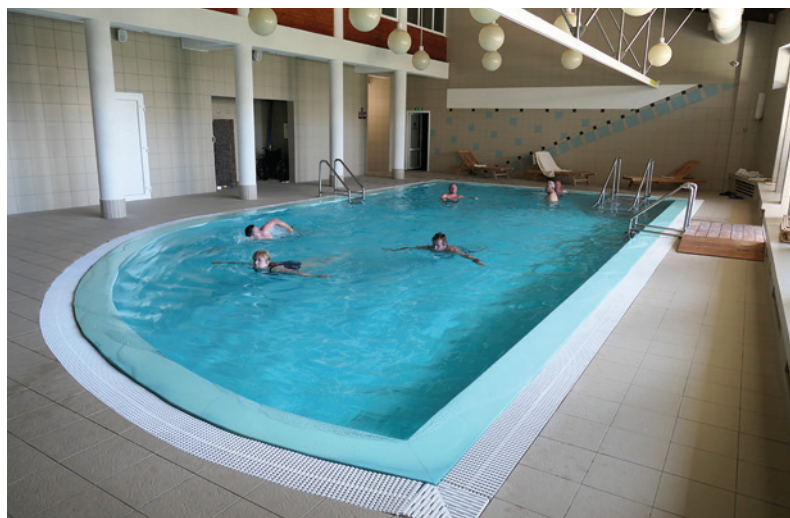
Plávanie v bazéne patrí medzi obľúbené aktivity počas rekondičného pobytu.

ľoch som tretíkrát a som spokojná. Všetko je na veľmi dobrej úrovni, nemám čo vytknúť. V rámci voľného času chodíme viacerí vonku do prírody a výnimkou nie som ani ja. Počas aktuálneho pobytu som bola napríklad na Dedečkovej chate alebo Krpáčove.