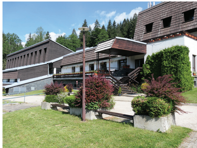
Hotel Stupka na Táľoch.

- Páči sa mi tu, bol som na Táľoch v rámci rekondičného pobytu už viackrát. Je to stále na kvalitnej úrovni, hodnotím ho pozitívne. Strava aj ubytovanie sú výborné, so všetkým som spokojný. Voľný čas máme poobede a škoda, že vtedy nemôžeme absolvovať bazény ani