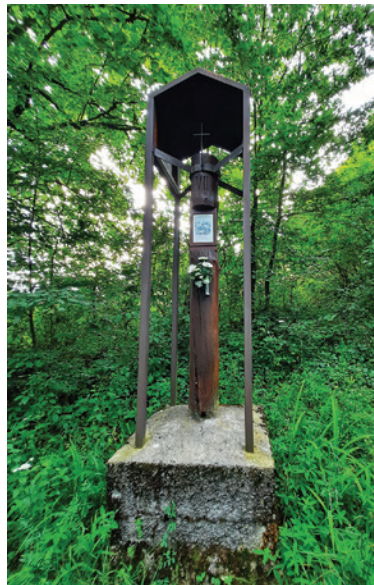
Jedno zo zastavení križovej cesty.

Zaujali nás i mohutné stromy, ktoré tu rastú desiatky, ba aj stovky rokov. Pováčšine ide o lipy alebo duby, no nájdeme tu aj iné dreviny, ktoré si pamätajú celé dejiny. Oddýchnuť si môžete na