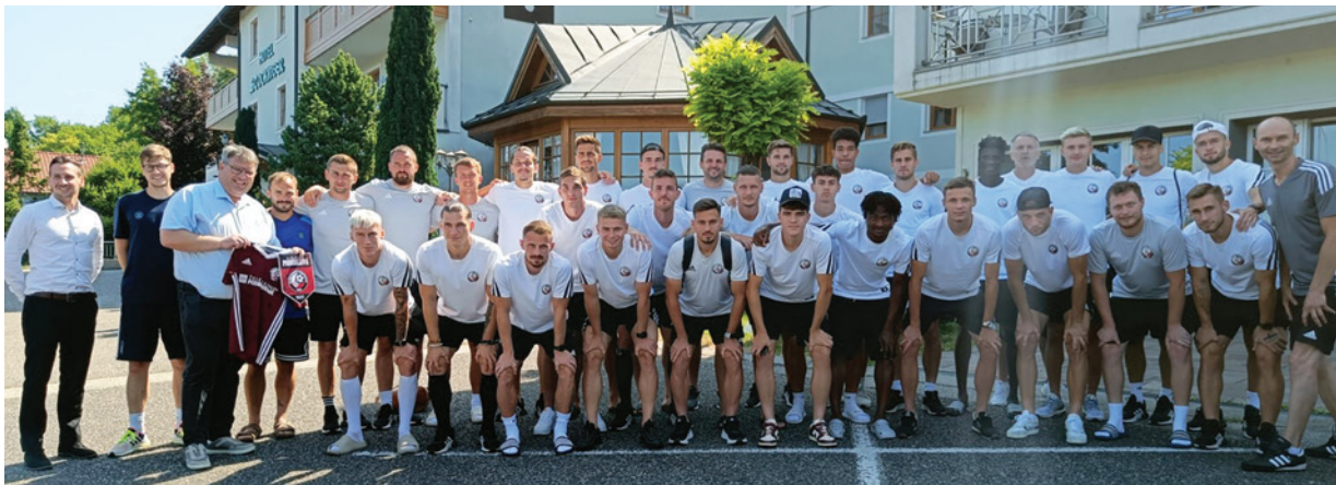
Výprava FK Železiarne Podbrezová na sústredujú v Rakúsku.

Poďakovanie za úspešný výsledok patrí nielen zamestnancom, ktorí sa priamo zúčastnili na audite, ale aj všetkým zamestnancom ŽP Informatika s.r.o. za ich pracovný prístup, vzťah k zákazníkom a snahu zlepšovať sa. Ďakujeme aj vedeniu spoločnosti za ich podporu a záväzok plniť požiadavky prijatých štandardov.