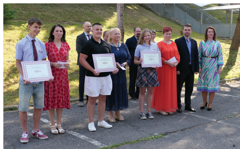
Ocenené boli tradične aj najlepšie triedy.