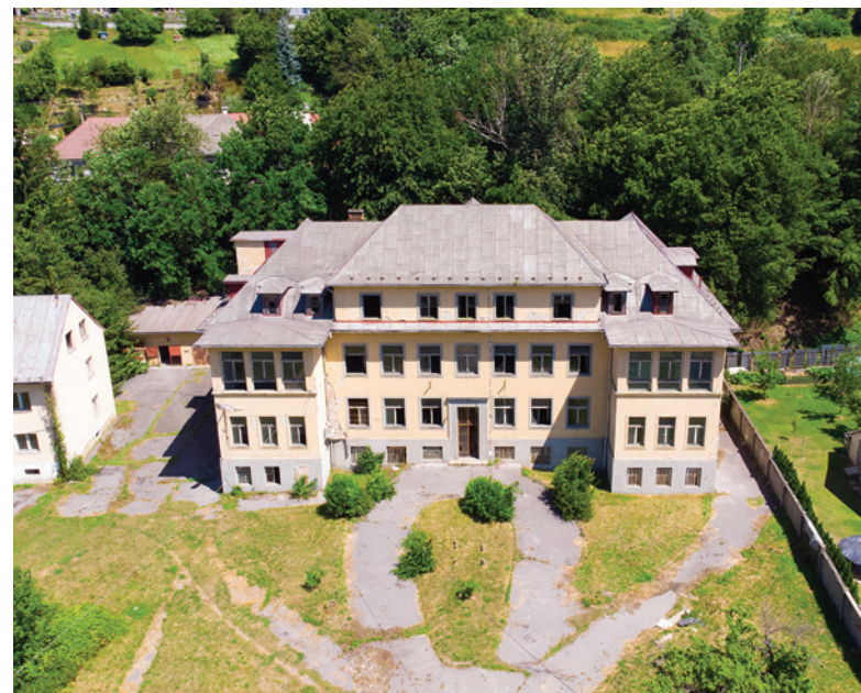
Jedna z budov v areáli bývalej nemocnice v Podbrezovej.