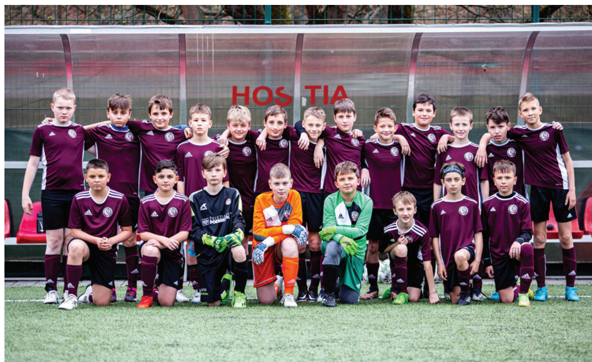
Výchova mladých hráčov patrí medzi hlavné priority futbalového klubu.

- V našom klube začíname s kategóriou U7. Funguje projekt Dajme spolu gól, ktorý ako klub obhospodarujeme. Zastrešujeme viaceré školy v rámci regiónu. Tréneri navštevujú žiakov raz týždenne a predvádzajú ukážkovú hodinu, zameranú na všeobecnú pohybovú prípravu. Na základe nej tréner vyhodnotí, ktorý žiačik je pohybovo nadaný, aby mohol futbal skúsiť na vyššej úrovni. Následne dostane navštevujú žiakov raz týždenne a predvádzajú ukážkovú hodinu, zameranú na všeobecnú pohybovú prípravu. Na základe nej tréner vyhodnotí, ktorý žiačik je pohybovo nadaný, aby mohol futbal skúsiť na vyššej úrovni. Následne dostane pozvánku zapojiť sa do tréningového procesu v našom klube. Samozrejme, existuje možnosť priviesť dieťa na tréning individuálne a my si ho v prípravke vyskúšame. Fluktuácia detí je však obrovská. Niektoré baví futbal viac, iné menej a o týždeň si naň ani nespomenú. Nájdem však aj žiačikov, ktorí budú naše kategórie ťahať niekoľko rokov. Okrem toho navštevujeme mnohé regionálne turnaje. Chceme vidieť, ako sa vyvíjajú hráči na dedinách. S mnohými klubmi máme aj spoluprácu, medzi žiakmi dokonca za hranicou okresu – napríklad Revúca, Hnúšťa či Hriňová. V tomto prípade fungujeme na báze striedavých štartov, takže dieťa nie je vytrhnuté zo svojho prirodzeného prostredia, ale hrá za svoj materský klub i za nás. Snažíme sa byť neustále aktívni, aby sa podbrezovská mládež vyvíjala a dokázali sme vychovať čo najviac hráčov pre prvé mužstvo.