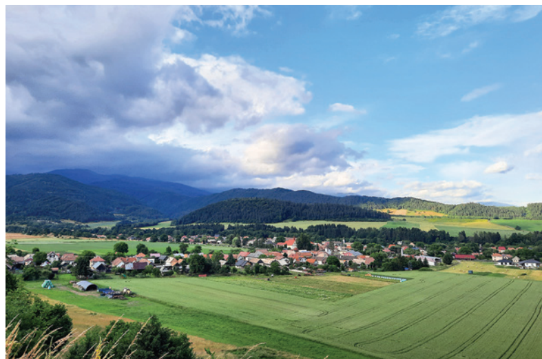
Pohľad na obec Jasenie z neďalekého kopca.

zachovalých lavičkách. Ak pôjdete z Jasenia trasou, ktorú opisujeme, nedostanete sa na začiatok križovej cesty, ale už budete niekoľko metrov od jej začiatku. Na informačných tabuliach nechýbajú obrázky z histórie, ktoré vás ešte viac vtiahnu do časov, keď dané miesto naši predkovia budovali alebo ho obnovovali. Dozvedáme sa, že pôvodná kalvária bola vybudovaná ešte v roku 1861.