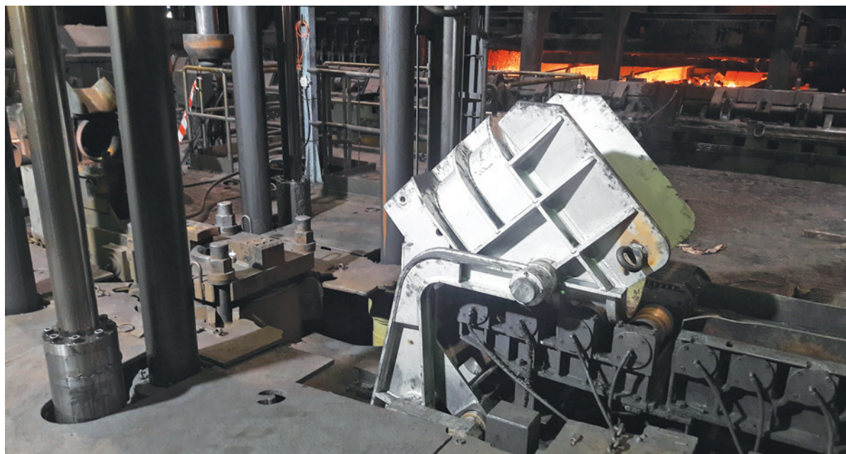
Vymenený vykladač z dierovacieho lisu.

Z dôvodu veľkého rozsahu prác možno spomenúť len niektoré. Na doprave pred nožnicou Lindemann sme vymenili prekldač z váhy. Na nožnici Lindemann bola prekontrolovaná brzda predlobovej hriadeľi. Na doprave pred karuselovou pecou boli vymenené dopravníkové sekcie v úseku tlačky na reťazový dopravník pred karuselovou pecou. Takisto boli nahradené dopravné reťaze, hnacia hriadeľ, hnané kolesá, 11 kusov vozíkov, zdvíhací stôl a rošt reťazového dopravníka pred karuselovou pecou. Na vyťahovanom zariadení z karuselovej pece sme vymenili vyťahovacie rameno. Na doprave za karuselovou pecou bola vymenená páka presunu blokov a dopravníkové sekcie č. 1 a 12. Na dierovacom lise bol opravený vyrážač, ďalej vymenený kontajner