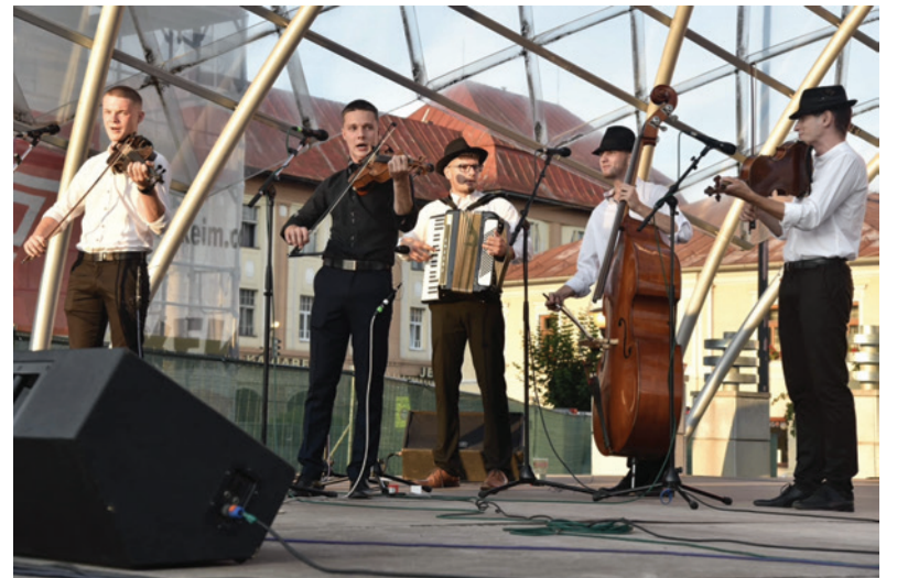
Ľudová hudba Čerešienka počas vystúpenia.

Pre mladého primáša znamená hudba veľmi veľa. „Prináša mi radosť, a to je najdôležitejšie. Som rád, že si môžem zahrať nielen s