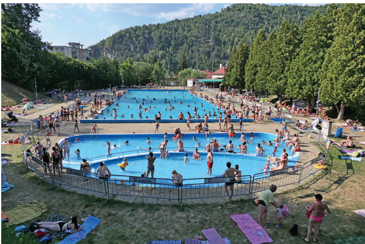
Minulý rok padali na podbrezovskom kúpalisku rekordy v návštevnosti.

Po napustení prišli pracovníci z Regionálneho úradu verejného zdravotníctva Banská Bystrica, aby urobili rozbor vody a pozreli si pripravenosť areálu. „Vždy dbajú na každý detail. Zaujímá ich hygiena, čistota, kvalita vody a mnohé ďalšie,” doplnil M. Dziad a pokračoval: