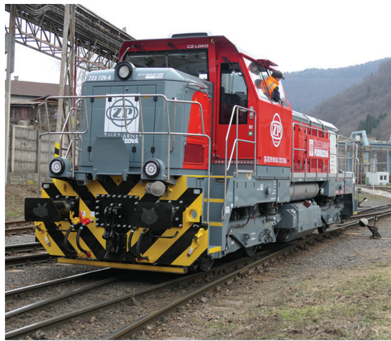
Zmodernizované lokomotívy najazdili viac ako 500 motohodín.

Zároveň pripomenul, že obsluha moderných prístrojov sa výrazne nelíši od pôvodnej verzie, hoci aj v tomto smere nastali určité zmeny. „Prenos výkonu v motore je ten istý, čiže nafta a elektrina. Obsluha je podobná, niektoré novinky nám predstavili zamestnanci firmy CZ LOKO. Spolu s ostatnými kolegami máme absolvovanú skúšku, ktorá platí na staré i nové lokomotívy. V našom prípade sme len doladili detaily a obsluhujeme staršie i novšie verzie. Jazdenie v nových lokomotívach je však ďaleko komfortnejšie,” dodal.