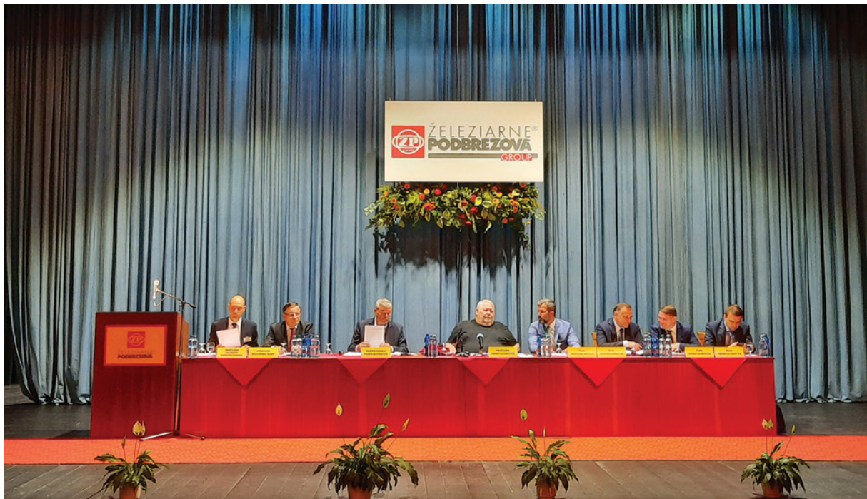
Tridsiate prvé valné zhromaždenie v Dome kultúry ŽP a.s.

„Rok 2022 bol poznačený výraznými vplyvmi v oblasti energetiky. Ceny lietali do nezadržateľných výšok. Zároveň bol ovplyvnený poklesom produkcie ocele vo svete, pričom došlo k enormnému nárastu cien vstupov. Vlačajšok bol pre nás