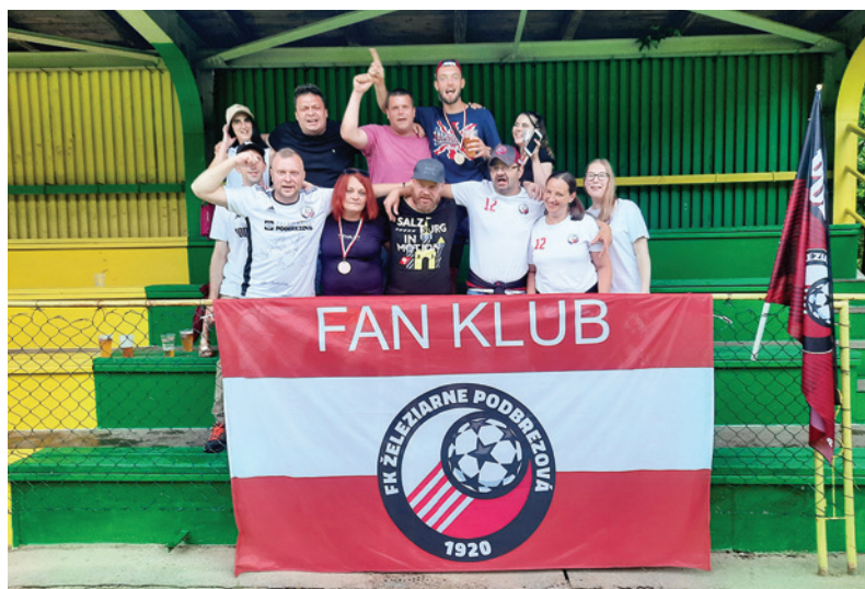
O atmosféru v Hronci sa starali najmä fanúšikovia Podbrezovej.

Sobotné popoludnie v Hronci dopadlo na výbornú. Vďaka organizátorom, pohostinnosti domácich, žičlivému a priateľskému prostrediu sa na oslavách všetci cítili príjemne. Nielen hráči, ale aj fanúšikovia si domov odniesli pozitívnu náladu z krásneho športového dňa.