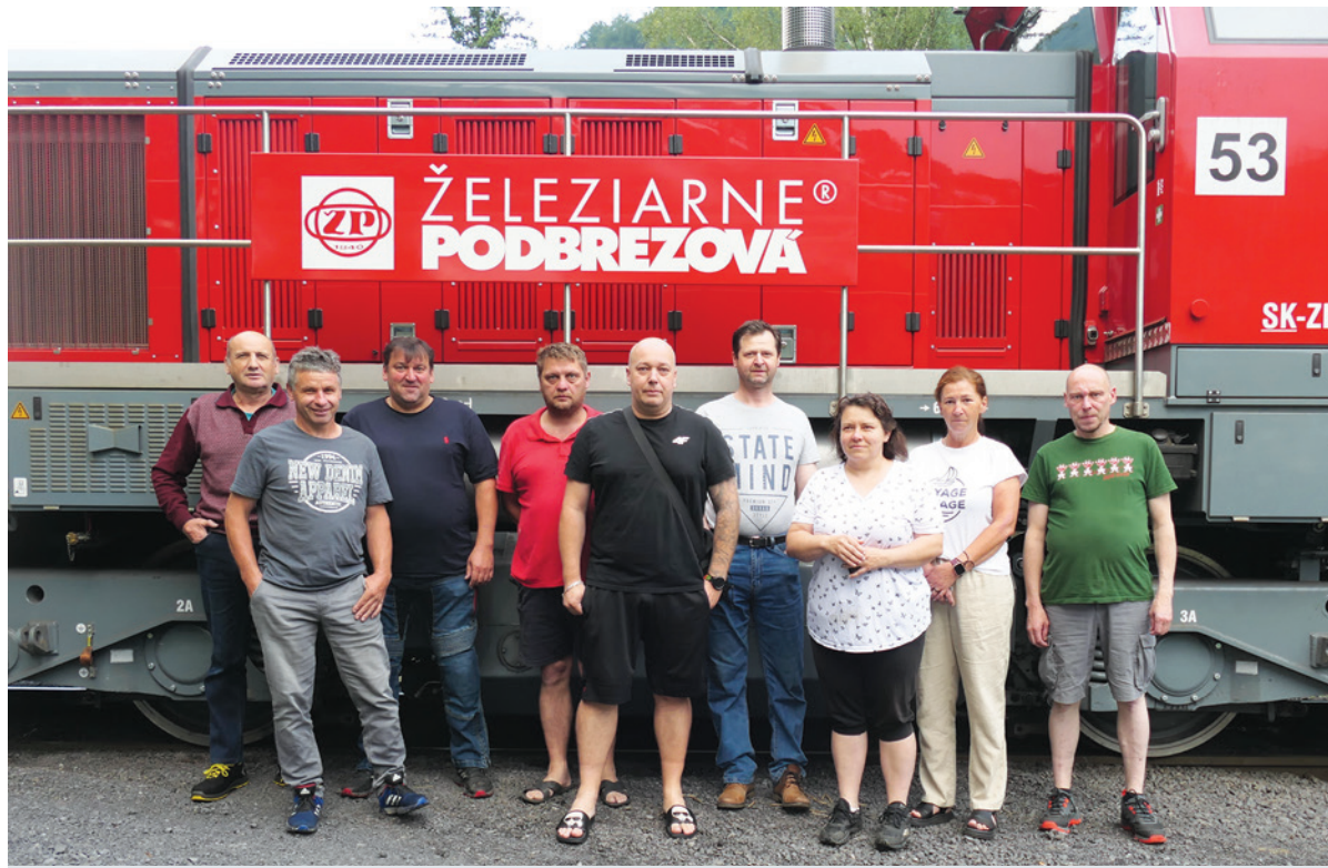
Vítazná zmena „D“ v prevádzkarni koľajová doprava pred odchodom z práce.

Tak, ako vždy, najväčší vplyv na priebeh súťaže medzi zmenami mali samotní pracovníci kategórie „R“, a to svojím prístupom k plneniu požadovaných úloh z iných prevádzkarní akciovej spoločnosti Železiarne Podbrezová. Hlavný dôraz pri vykonávaní úloh bol kladený na včasnosť a dodržiavanie pracovnej a technologickej disciplíny jednotlivých posunujúcich dielov a výhybkárov, čo malo priamy vplyv na bezpečnosť, úrazovosť a nehodovosť strediska železničnej dopravy. Nie zanedbateľný vplyv na získanie bodov mala aj organizačná činnosť príslušného zmenového majstra železničnej dopravy.