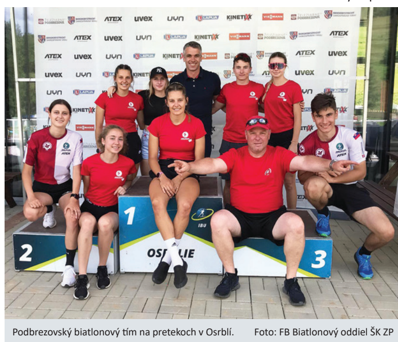
Podbrezovský biatlonový tím na pretekoch v Osrblí.