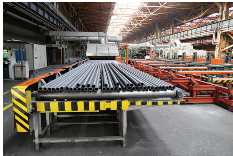
Žihacia pec č. 5, ktorá začiatkom júna prešla strednou opravou.