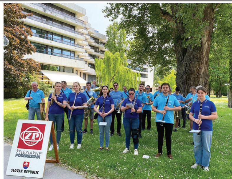
Podbrezovská dychovka v Piešťanoch.

- Zo svojho trojdenného pobytu na UMB som si odniesol nielen nové vedomosti v oblasti programovania, kde som sa naučil programovať v jazyku Python, ale aj svoju prvú hru a dve ceruzky s osobnými motívami. Na UMB sme však nešli len kvôli hodinám Pythonu, ale mohli sme si vyskúšať aj písanie 3D perom a vrátili sme sa naspäť do minulosti, k začiatkom počítačov, v ich vlastnom mini múzeu počítačov, myši, klávesníc, písacích strojov a rôznych ovládačov. Osobne som bol so svojím zážitkom nadmieru spokojný a teším sa na možný budúci workshop.