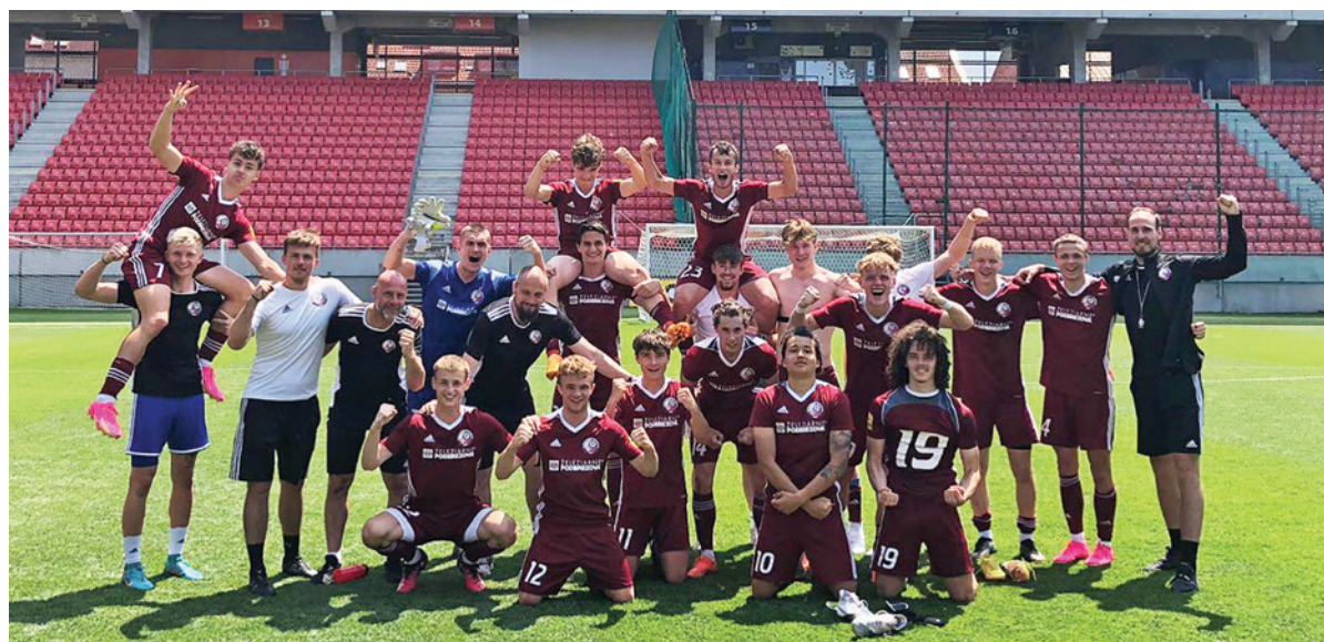
Hráči z kategórie U19 sú často len krok od premiérového štartu v prvom tíme.

Určite ukázali mnohí chlapci potenciál. Nachádzajú sa v jednotlivých ročníkoch futbalisti, pri ktorých viete odhadnúť, že by sa mohli v budúcnosti výraznejšie presadiť?