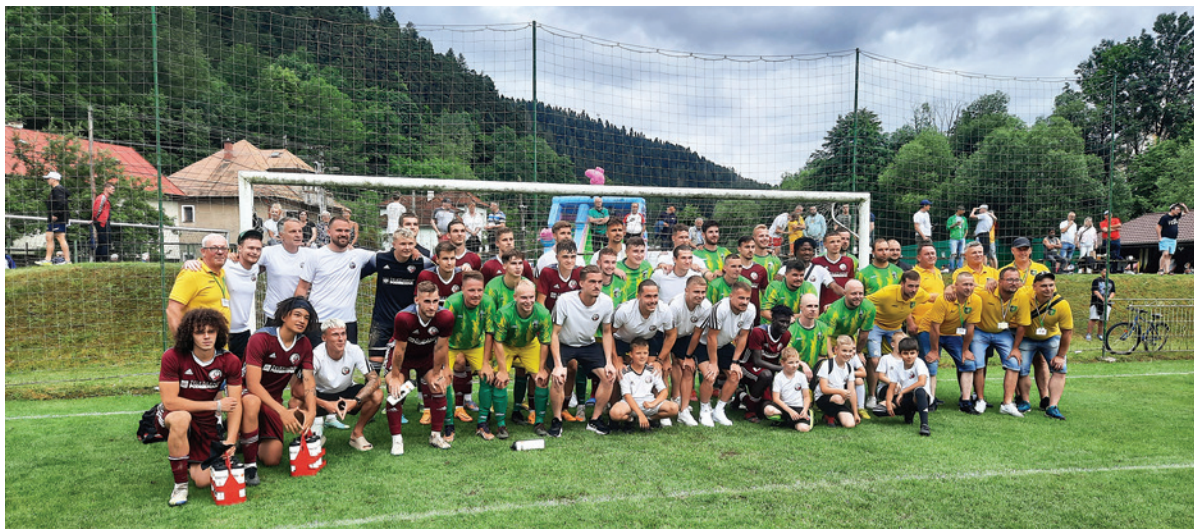
Spoločná fotografia hráčov, trénerov a funkcionárov FK Železiarne Podbrezová a ŠK Spartak Hronec.