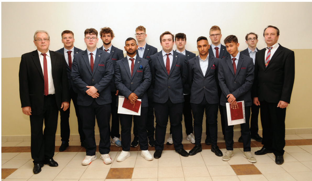
Absolventi po slávnostnom prevzatí výučných listov.

„S radosťou môžem skonštatovať, že vďaka trpezlivosti a snahe kolegov vo vedení, učiteľov odborných predmetov, majstrov odbornej výchovy a v neposlednom rade triedneho učiteľa, všetci žia-