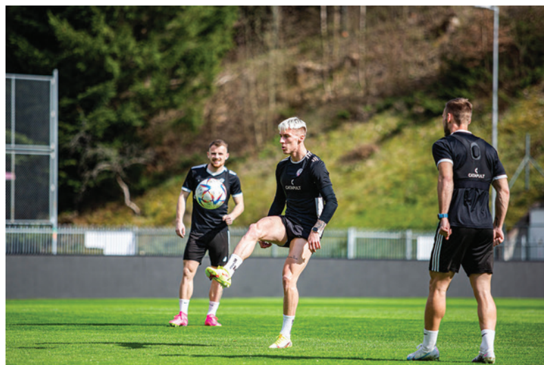
Hráči naplno zarezávajú už od polovice júna.