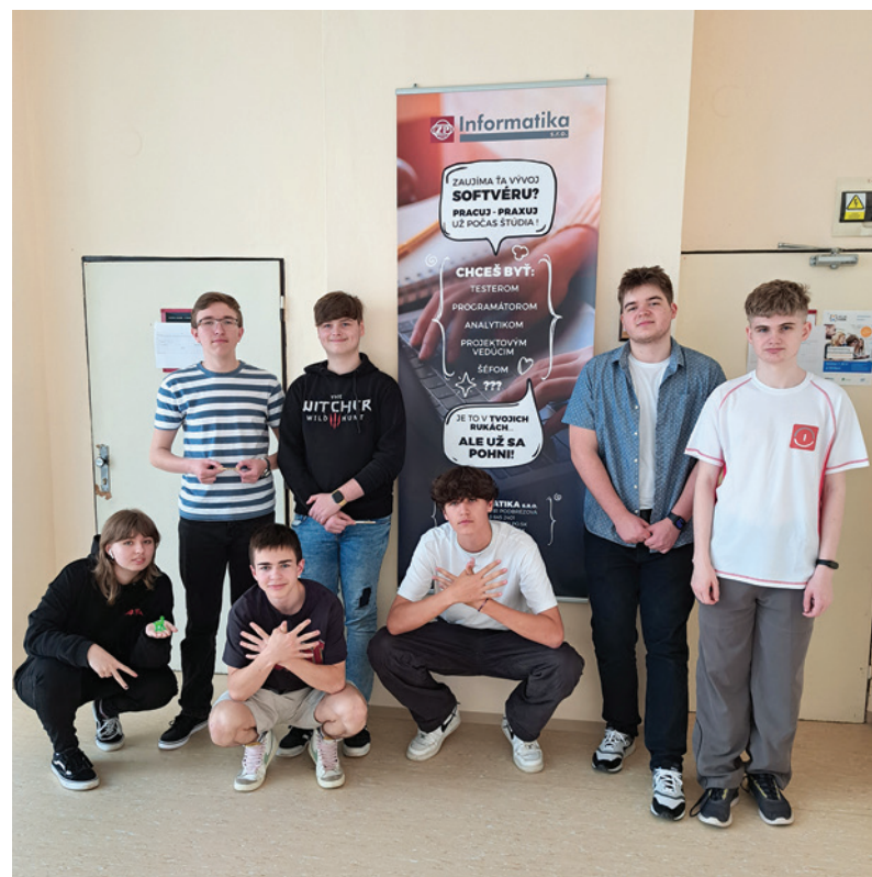
Naši žiaci počas letného kempu na Univerzite Mateja Bela v Banskej Bystrici.

Na záver vyzval všetkých, ktorí majú radi dychovú hudbu, aby neváhali a prišli sa pozrieť na niektorý z nácívkov. „Ak by mal niekto čas a chuť, radi privítame nových členov všetkých vekových kategórií. Zabezpečíme im hudobné nástroje i patričné vzdelanie od fundovaných a vzdelaných odborníkov. Ak sa niekto chce stať súčasťou dobrého a najmä veselého kolektívu, radi ho privítame. Ozvať sa nám môžete, napríklad, aj na sociálnej sieti.“