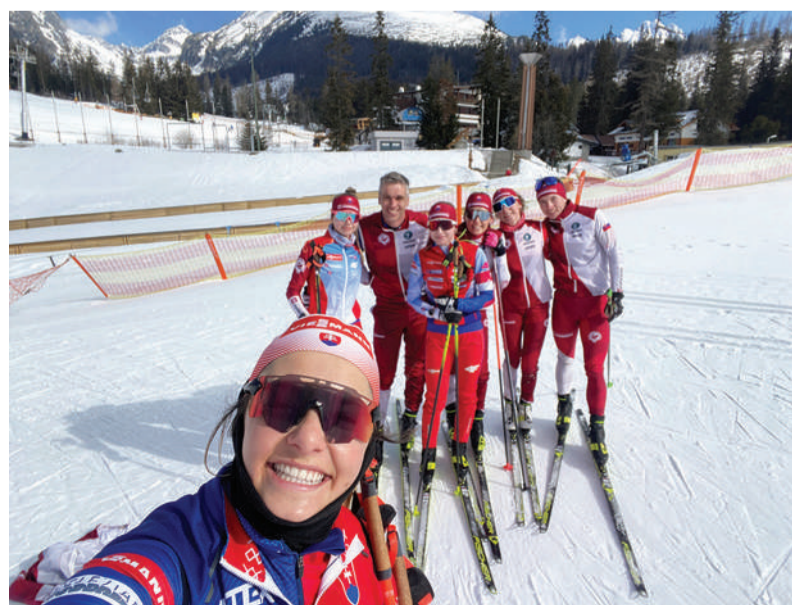
Náš biatlonový tím počas tréningu na Štrbskom plese začiatkom apríla.