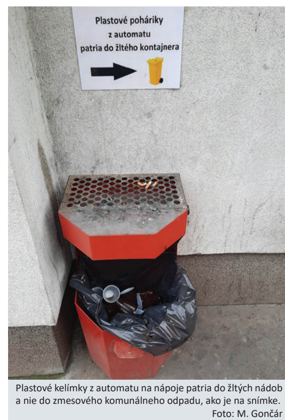
Plastové kelímky z automatov na nápoje patria do žltých nádob a nie do zmesového komunálneho odpadu, ako je na snímke.