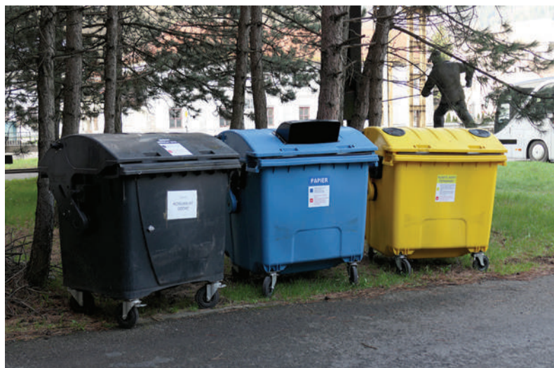
ŽP a.s. zabezpečili takmer šesťdesiat nových kontajnerov.