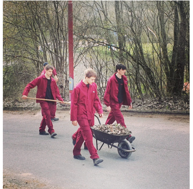
Žiaci z našej školy počas tohtoročného upratovania.

Mladý pretekár, ktorý pracuje vo valcovni bezšvíkových rúr, sa predstaví aj domácim divákovi. V Brezne sa začiatkom júna uskutoční pohárová súťaž v mas wrestlingu, na ktorej budú štartovať pretekári z celého sveta. „Uvedomujem si, že na podujatí bude veľká konkurencia, no pôjdem naň s cieľom zvíťaziť,“ uzavrel.