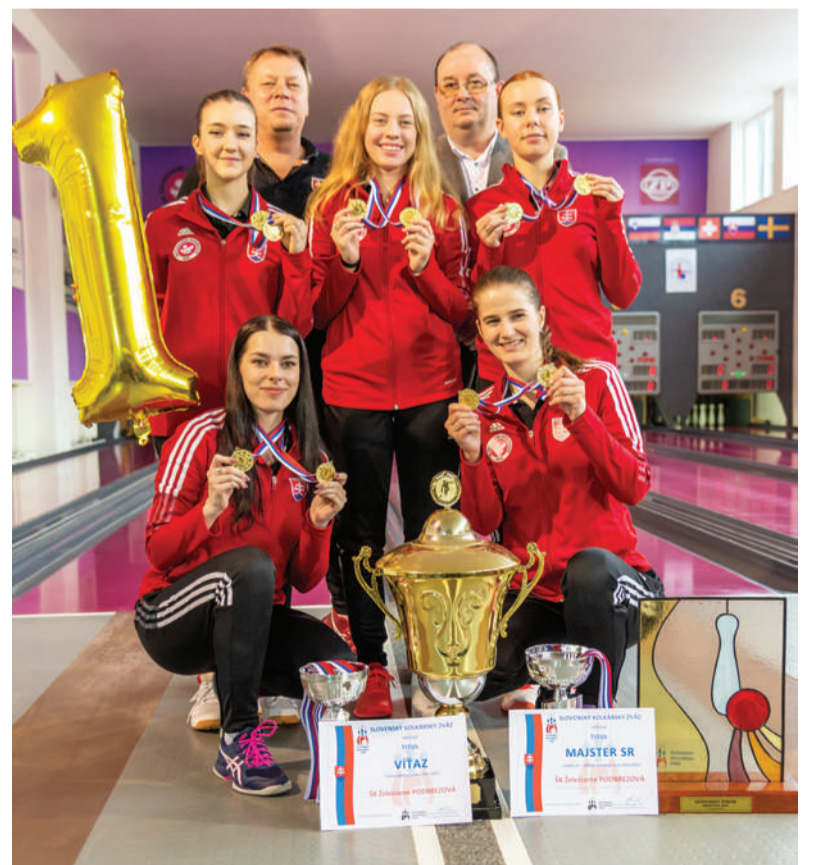
Podbrezovské kolkárky sa na jeseň predstavujú vo Svetovom pohári.

Sezónu ešte uzavrujú muži zápasmi Slovenského pohára a dorastenci turnajom vo Filakove. Na-