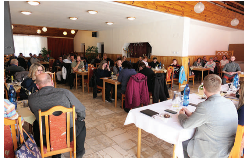
Členovia odborov sa dozvedeli o aktuálnom dianí v ŽP a.s.

Všetky ďalšie informácie z výročnej konferencie vám poskytnú delegovaní zástupcovia.