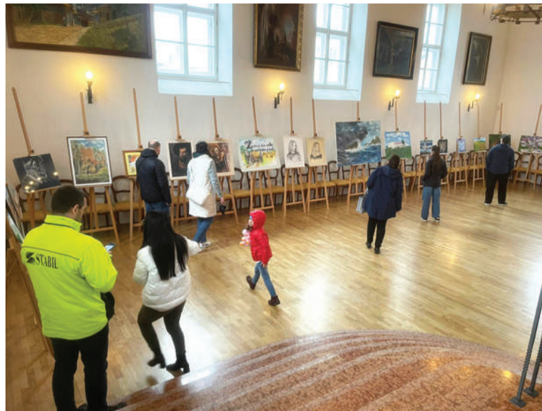
Návštevníci hradu Ľupča obdivujú obrazy od regionálnych maliarov.

„Do portfólia obrazov, ktoré sú súčasťou výstavy, som zakomponoval prierez celou tvorbou.