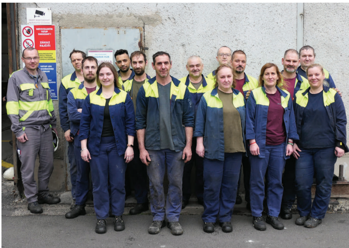
Víťazná zmena „C“ zo strediska ťažných stolice, dielňa 1.

- Tento rok bolo ich víťazstvo založené na kvalite a efektívnosti využitia pracovného času.