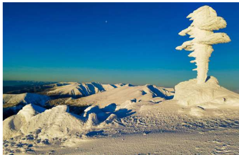
Kříž na Ďumbieri v zajatí snehu a ľadu.

Všetkým čitateľom ďakujeme za fotografie i za inšpiráciu.