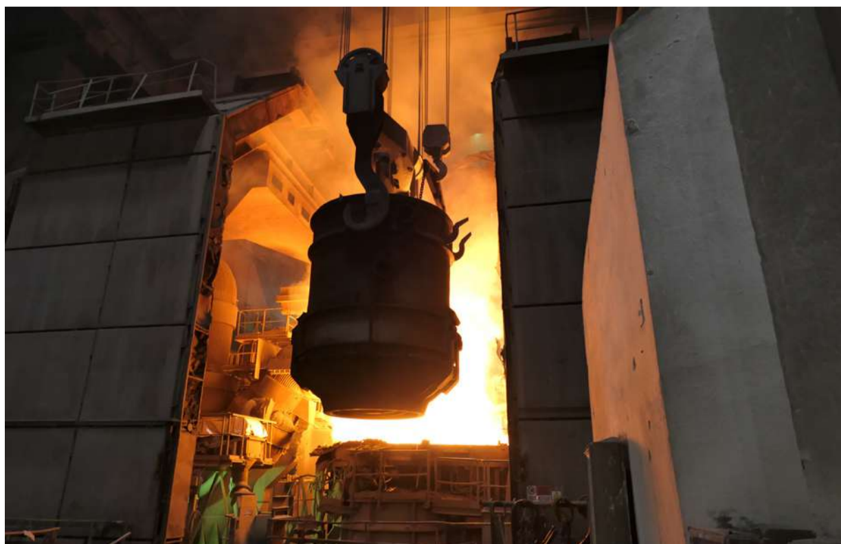
Všádzka oceleového šrotu do elektrickej oblúkovej pece.