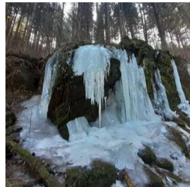
Ľadopád v Hronci.