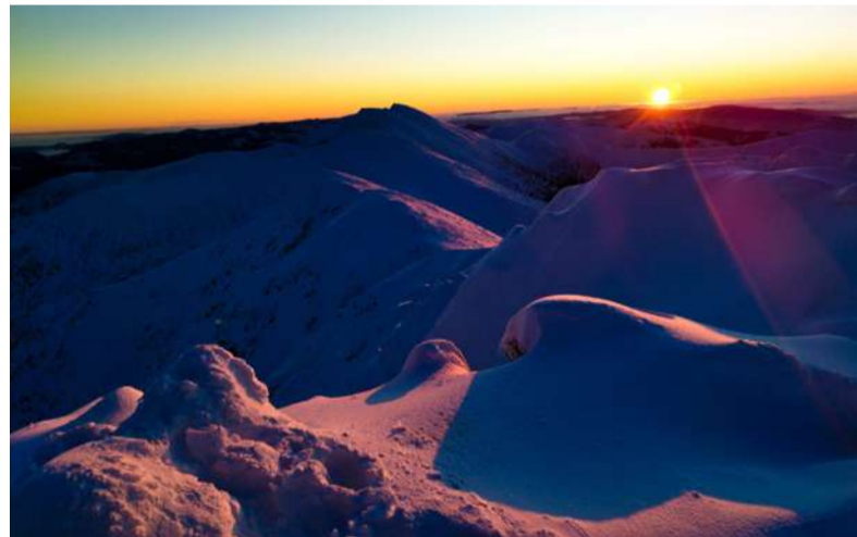
Slnecné lúče na vrchole hôr.