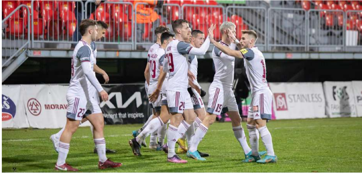
Železiari splnili predsezónny cieľ a postúpili medzi najlepšie tímy súťaže. Teraz ich čaká desať atraktívnych duelov.