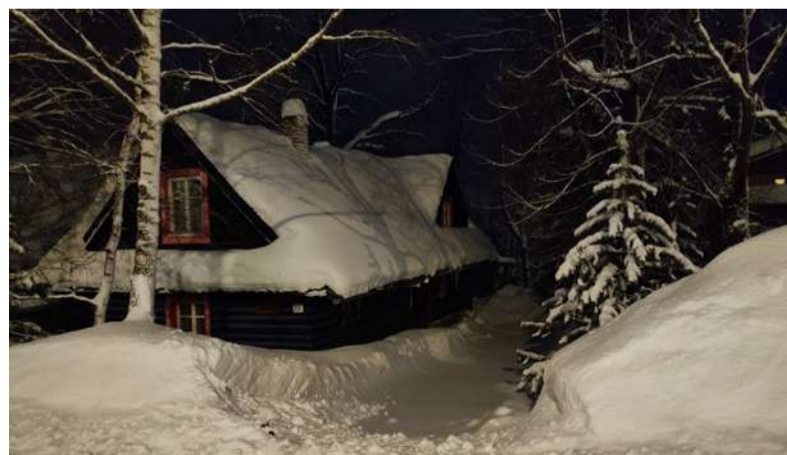
Zimná rozprávka v Ždiari.