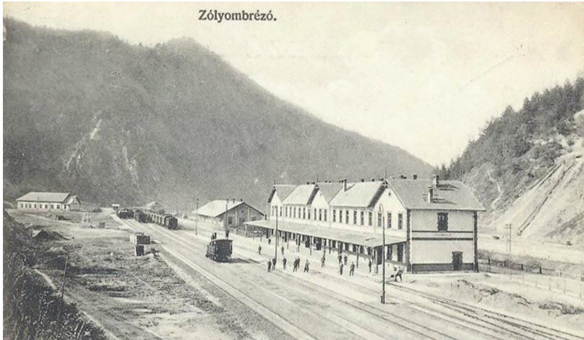
Železničná stanica v Podbrezovej bola vybudovaná v roku 1883. Súčasná bola postavená v roku 1912.

V roku 2023 si pripomenieme viaceré významné výročia spájajúce sa s históriou podbrezovských železiarní. V prvej časti sa pozrieme na historické míľniky od roku 1838, kedy bola schválená výstavba valcovne a pudlovne na výrobu železničných koľajníc pod vŕškom Brezová, až po rok 1968, kedy bol položený základný kameň výstavby nového závodu železiarní a jeho prvej výrobnéj prevádzkarne ťahárne rúr 1.