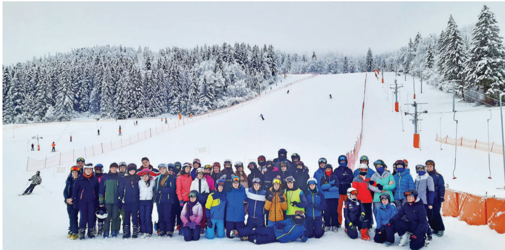
Účastníkov lyžiarskeho kurzu na Táloch potešilo aj pravé zimné počasie.

Absolutóriom si zaslúžia pracovníci areálu na Táloch, ktorí už od vianočných sviatkov udržiavajú stredisko v prevádzke, aj napriek teplému počasiu. Našťastie, v posledných dňoch sa zima „spamätala“ a pribudlo aj niekoľko centimetrov prírodného snehu. „Už od prvého dňa nám snežilo. V pondelok a utorok sme sa trochu vytrápili. Padal mokrý sneh a dážď. Ale počasie si