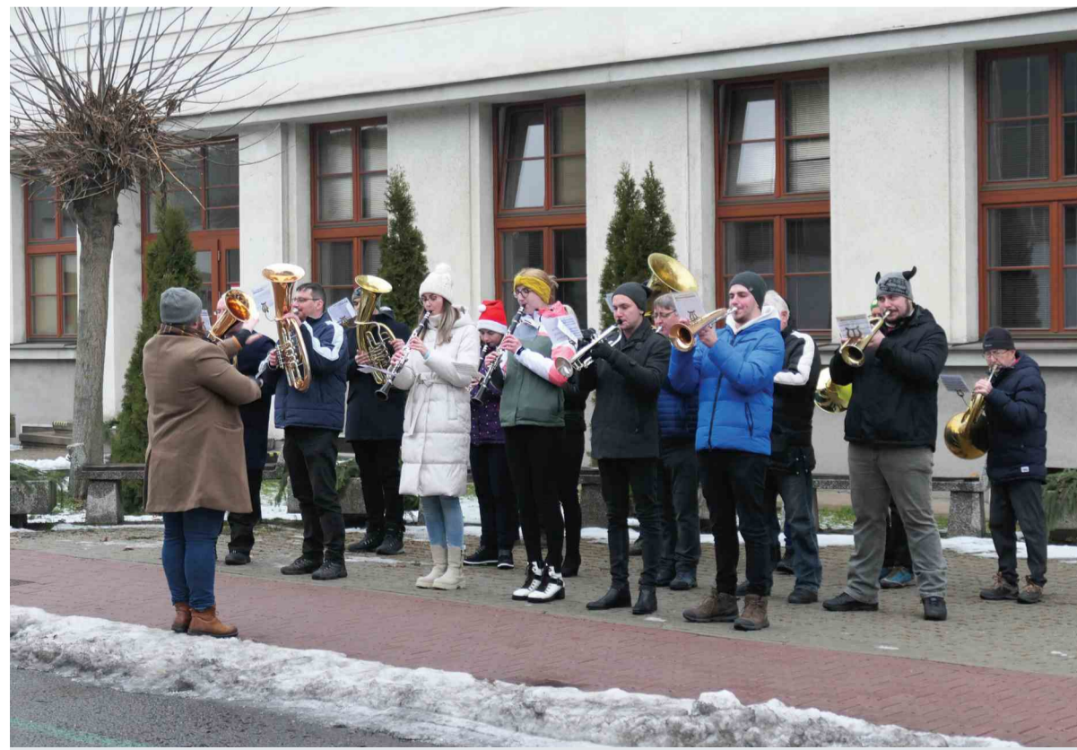
Dychová hudba Železiarne Podbrezová počas koledovania pred Hutníckym múzeom ŽP v starom závode.

“Hrali sme na Šupkovej ulici v Podbrezovej, potom pred starým závozom, na sídlisku Štiavnička, v Hronci a nakoniec aj na námestí vo Valaskej pri živom Betleheme