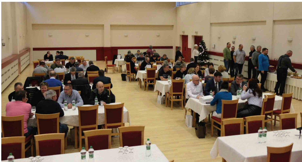
Pre jubilentov bolo pripravené aj občerstvenie. Pri spoločnom stretnutí spomínali a bilancovali roky vo fabrike.