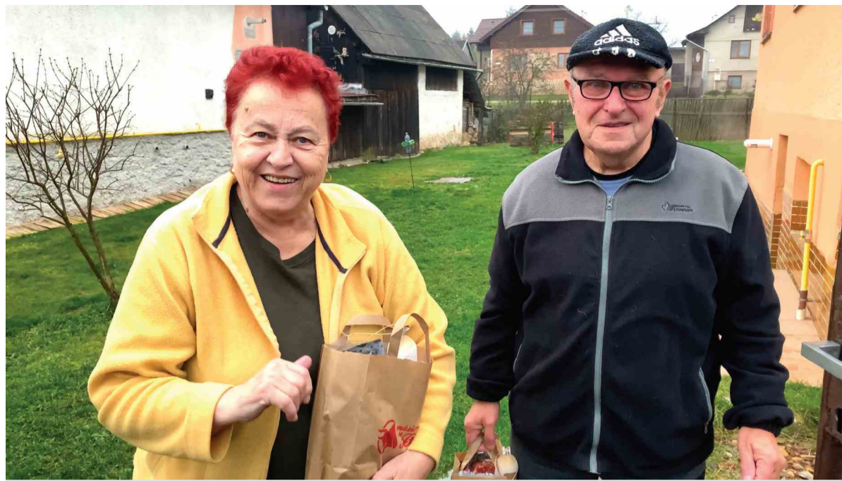
Návšteva z podbrezovských železiarní bývalých zamestnancov prekvapila, ale potešila.

S návštevami boli spojené rôzne príhody, veľa raz úsmevné, ale