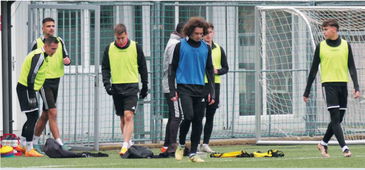
Futbalisti FK Železiarne Podbrezová počas prvého tréningu na umelej trávě na Skalici.