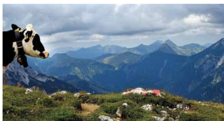
Výhľad v Alpách.