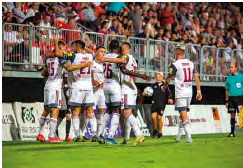
Po Kuzmovom treťom góle vytryskol v Zelpe aréne gejzír radosti.