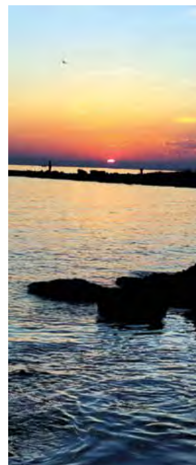
Západ slnka v Umagu.