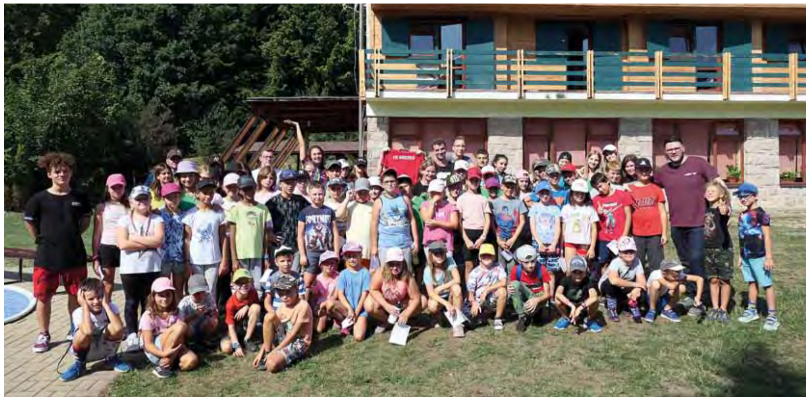
Decká si tábor v Repišti dosýta užili. V augustovom turnuse ich poriadne zahrialo aj horúce letné slnko.

Dvojtýždenný turnus má aj vzdelávací charakter. Deti spoznávajú okolie, prírodu, animátori im vstúpajú úctu k prírode či živým bytostiam. „Aj príbeh tábora spočíva v tom, že rebeli sa ocitli v krajine Rebeliónu, kde prišli po dlhý púť spoznávať svoje hriechy. Deckám sa snažíme vysvetľovať, čo je dobré a čo zlé, aká dôležitá je spolupráca, priateľstvá a pomoc navzájom. Všetky aktivity musíme robiť hra-