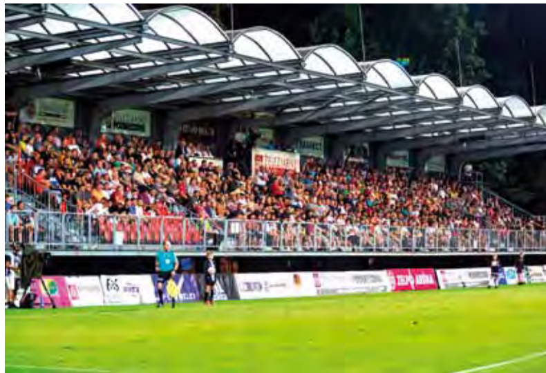
Súboj s Duklou sledovali viac ako tri tisícky fanúšikov.