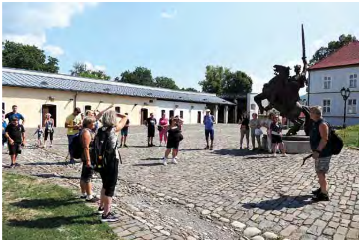
Turisti sa na konci komentovanej prehliadky zastavili na dolnom nádvorí, kde obdivovali sochu Svätopluka.

V nasledujúcom čísle novin Podbrezovan vám prinesieme ďalšiu časť seriálu, v ktorom odhalíme etapy dvadsaťročnej systematickej obnovy hradu Ľupča.