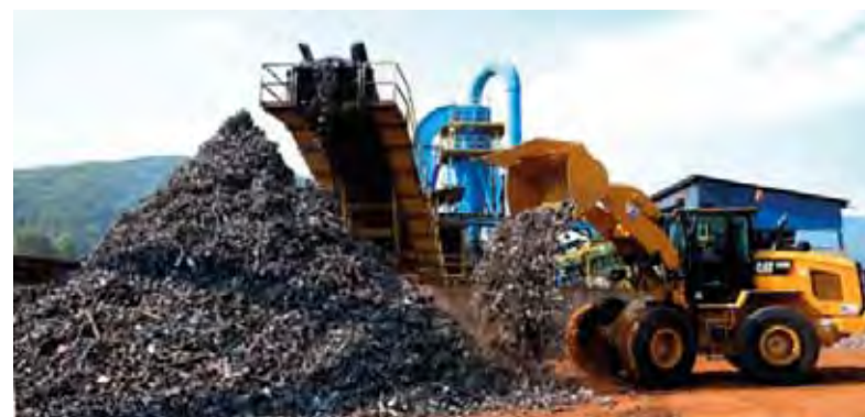
Ilustračné foto: ŽP EKO QELET a.s.