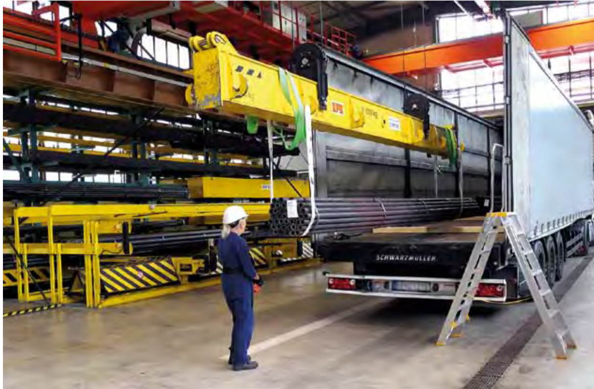
Pracovníčka automatizovaného skladu č.3 pri nakladaní kamióna.