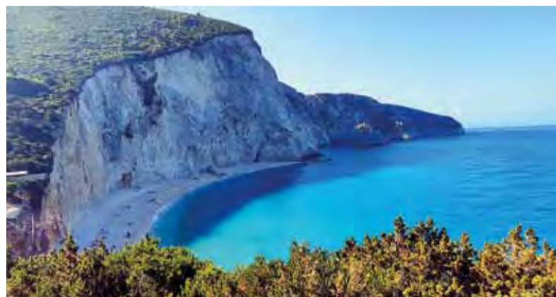
Grécky ostrov Lefkada.