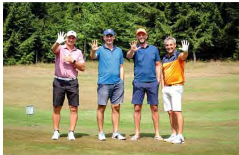
Zlatí chlapci z Göteborgu 2002. Zľava Peter Bondra, Miroslav Šatan, Richard Lintner spolu s hercom Filipom Tůmom.

„Našiel som tu veľa kamarátov. Ľudia sa poznajú a dobre spolu vychádzajú, pričom spoločne trávia veľa voľného času. Po golfovej stránke sa Slovensko za dvadsať rokov posunulo. Tále sú originálne a iné ako ostatné ihriská u nás,“ rozhovoril sa Lintner. V rezorte vidí aj ďalšie pozitívum. „Prinášajú možnosť odprezentovať Slovensko pre turistov. Máme krásne hory, lyžiarske strediská. V lete tu môžete využiť bicykle či ísť na turistiku a golf to optimálnym spôsobom doplní,“ povedal „Citron,“ ako znie prezývka bývalého vynikajúceho obrancu. „Táľom prajem, aby sa tu stretávalo čoraz viac ľudí. Aby odchádzali s pocitom radosť, že sa sem znovu vrátia,“ dodal.