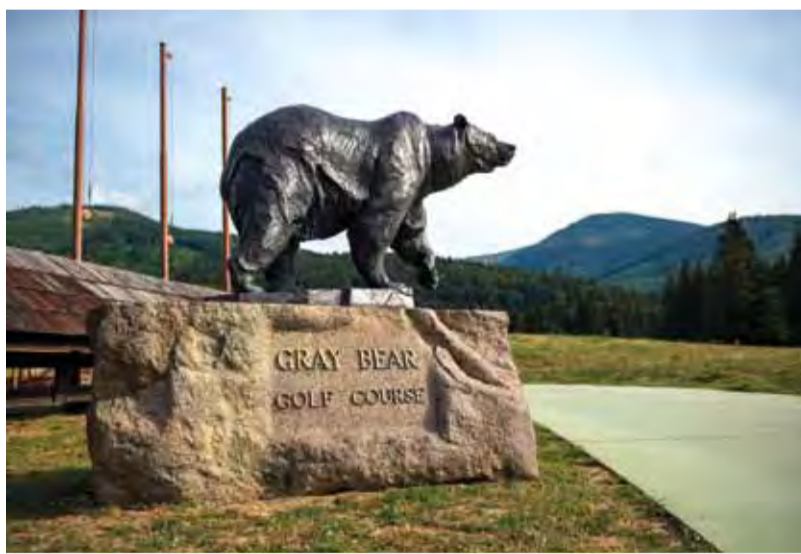
Gray Bear (Sivý medved) je symbolom golfového rezortu na Táloch.

„Keď sme pred rokmi prišli s myšlienkou výstavby ihriska na Táloch, bol som presvedčený, že tento krok bude mať úspech. Pred dvadsiatimi rokmi sme sa nevedeli pohybovať vo svete. Uvedomovali sme si, že ak chceme byť úspešní v biznise v Európe i vo svete, musíme svoj životný štýl prispôbiť štýlu našich