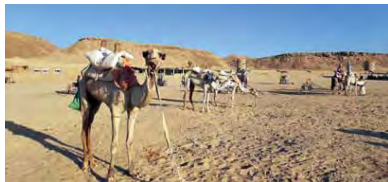
Z dovolenky v Egypte, mesto Marsa Alam.

Vybrané fotografie postupne zverejníme, aby ich mohli obdivovať aj ďalší naši čitatelia, prípadne sa nechali inšpirovať.