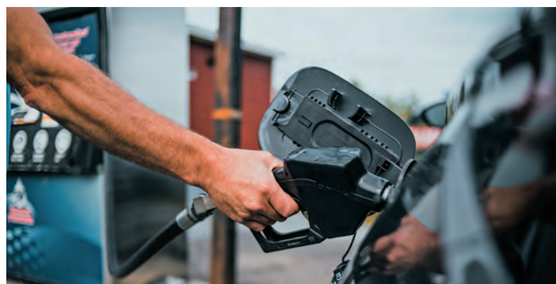
Palivo doplňajte radšej predvídavo skôr a nejazdite s poloprázdnu nádržou.

- Je to individuálne, niekto rád jazdí večer a v noci, kedy sú cesty prázdnnejšie, niekto šoféruje radšej cez deň. Záleží, kto ako vidí v noci, aký chce mať zážitok z jazdy, či sa chce niekde aj zastaviť alebo sa chce len rýchlo prepraviť do cieľa. Takže je to individuálne a oveľa dôležitejšie je dobre si naplánovať cestu a dôkladne sa pripraviť. Pri jazde dodržiavať ustanovenia dopravných predpisov a jazdiť radšej o trochu pomalšie a predvídavo. Aj ostatní pasažieri budú mať z cesty zážitok, ak z vášho charakteru jazdy vyčítia, že máte auto a situáciu pod kontrolou, veziete sa príjemne a vychutnávate a spoznávate inú krajinu.