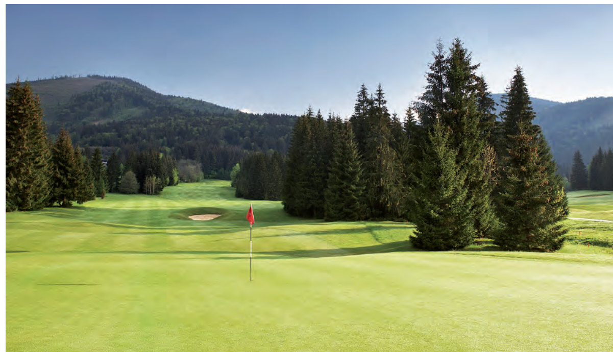
Hráči golfu oceňujú nielen dizajn ihriska, ale obdivujú aj okolitú prírodu.

Podrobnú reportáž z turnajov pri príležitosti významného jubilea prinesieme v budúcom vydaní novin Podbrezovan.