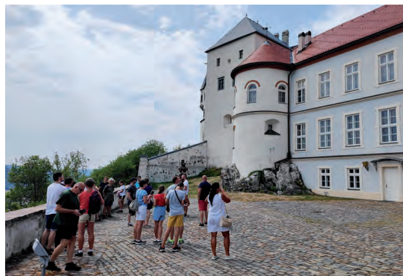
Na hrad Ľupča prišlo v júli viac ako 5 500 návštevníkov.

Veríme, že si v mesiaci august nájdete cestu na hrad Ľupča, kde sa môžete za jeho múrmi schladiť, ukryť pred kvapkami dažďa alebo pred páľavou slnka.