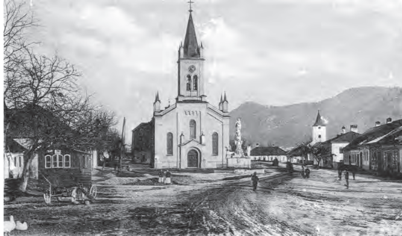
Morový stĺp na svojom pôvodnom mieste v Slovenskej Ľupči. Jeho pozostatky môžu návštevníci obdivovať v hradnom lapidáriu.

V rámci realizácie archeologických výskumov v objekte hradu Ľupča bolo objavených niekoľko archeologických artefaktov, nachádzajúcich sa predovšetkým v torzálom stave. Železiarne Podbrezová od roku 2002 okrem obnovy investujú aj do zachovania historického materiálu. Aj vďaka tomu bola v zrekonštruovaných barokových priestoroch hospodárskych budov dolného nádvorja inštalovaná expozícia archeologických nálezov. Zbierkové predmety prezentované návštevníkom sú svedectvom dávneho pestrého života početného osadenstva hradu. Prevládajúcim materiálom v ar-