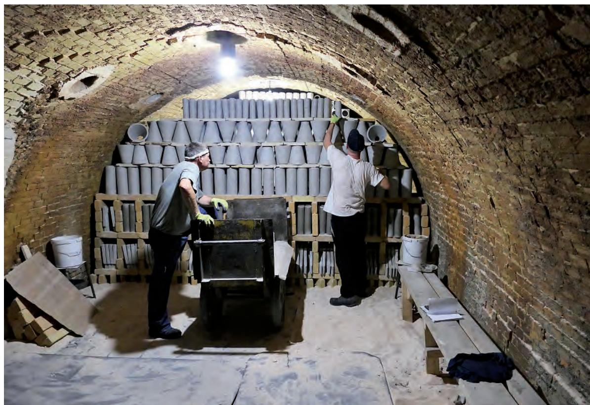
Dostatočný počet zákaziek v Kalinove znamenal aj prijatie nových pracovníkov do výroby.

No ešte nie je koniec roka a situácia sa môže zmeniť. Primárnym cieľom spoločnosti je eliminovať túto črtajúcu sa stratu. U jedného z ukrajinských dlžníkov práve prebieha ekonomicko-účtovný audit. Nové informácie súvisiace s možným riešením by mali byť známe v septembri. Napriek všetkým problémom beží výroba v Kalinove na plné obrátky. Vedenie spoločnosti