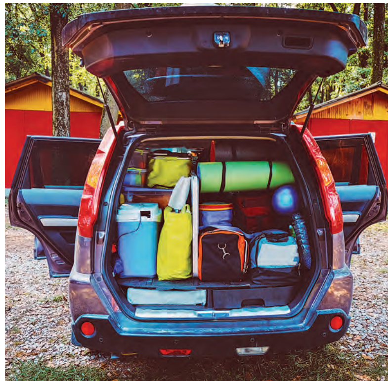
Vozidlo by malo byť v spôsobilom technickom stave, aby bolo spoľahlivé a náročnú trasu zvládlo bez poruchy.

- Samozrejme, odporúčam. Je potrebné držať sa približne toho, čo platí pre vodičov z povolania. Doba jazdy by nemala presiahnuť štyri a pol hodiny, potom je nutné si urobiť prestávku 45 minút a pokračovať dobou jazdy ďalších štyri a pol hodiny. Po tomto výkone by mala nasledovať doba denného odpočinku minimálne deväť hodín. Ak je vo vozidle viac vodičov, môžu sa počas cesty striedať a ich denný výkon jazdy za 24 hodín bude tým pádom väčší. Podrobne máme tieto pravidlá jazdy a denného odpočinku predpísané aj v Smernici 463 Zabezpečenie prevádzky referentsky riadených vozidiel. Mikrosprávok alebo úna-