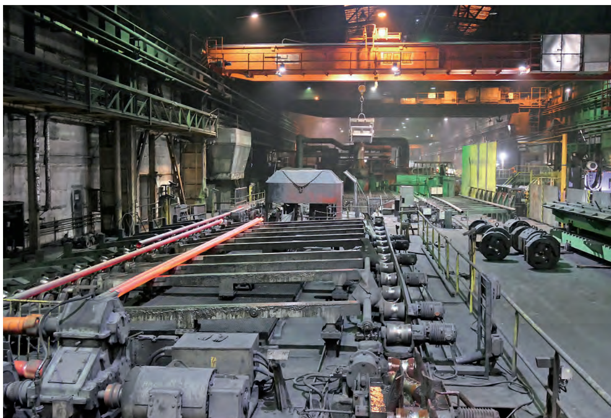
Vo valcovni bezšvíkových rúr sme za prvých šesť mesiacov prekročili plán výroby o 2 001 ton.

Ďalšie výskumné úlohy boli zamerané na šetrenie kusového antracitu náhradou za koks, úpravu dávkovania a šetrenie napeňovadla v EAF, za podmienky nezmenenej kvality napenenej trosky. Skúšobne sme