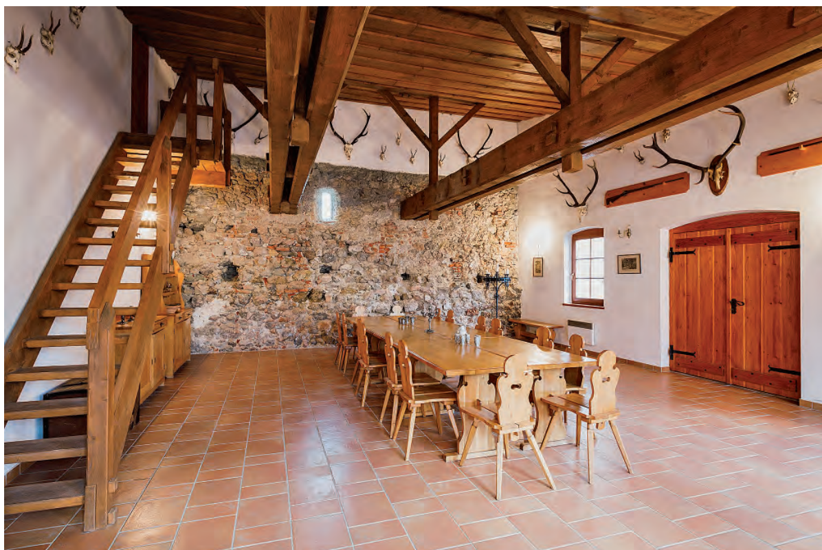
Lovecký salónik je obľúbeným miestom prenájmu na oslavy rôznych životných jubileí.

V nasledujúcom čísle novín Podbrezovan vám prinesieme ďalšiu časť seriálu, v ktorom odhalíme etapy dvadsaťročnej systematickej obnovy hradu Ľupča.