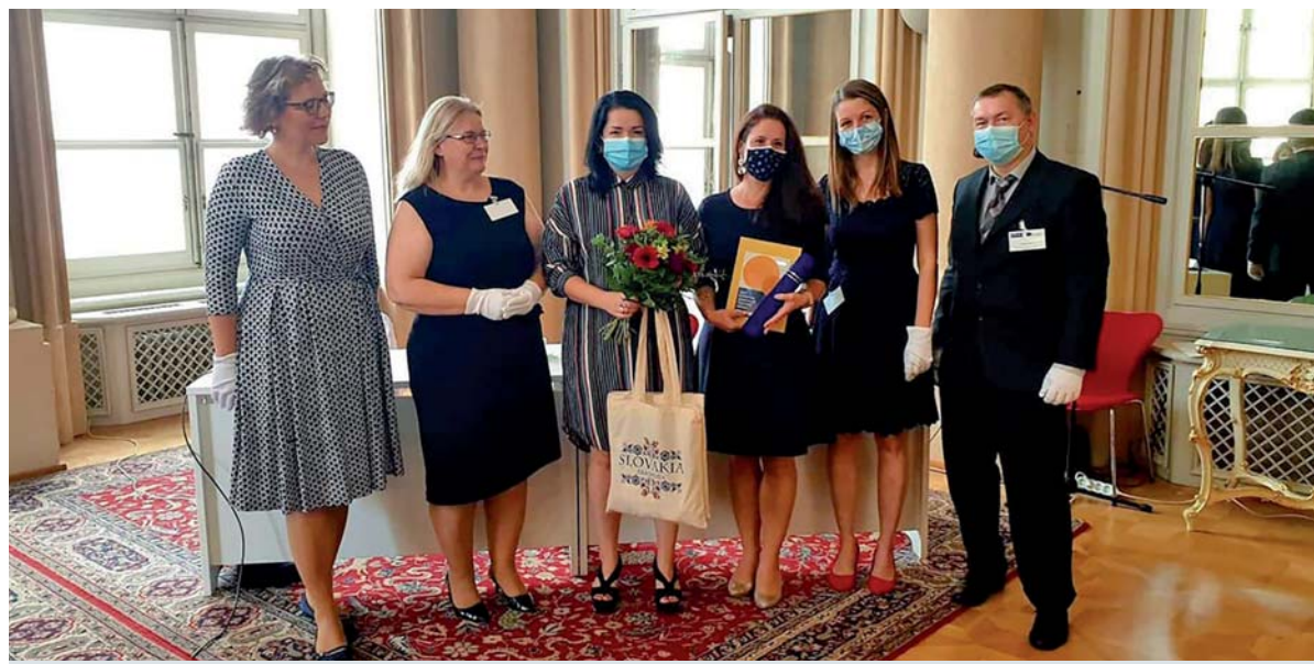
Ocenení pedagógovia po slávnostnom prevzatí ceny z rúk zástupcov SAAIC.

A práve preto je úžasné mať v tíme pedagógov, ktorí sa nebránia zavádzaniu inovácií do vyučovacieho procesu, sú ochotní neustále sa vzdelávať, zapájajú sa do tvorby i realizácie rôznych projektov. Práca so žiakmi je pre nich neodmysliteľnou súčasťou života a zároveň aj koníčkom. Odmenou nielen pre nich, ale i pre naše Súkromné gymnázium Železiarne Podbrezová bolo získanie ocenenia EITA (Európska cena za inovatívne vzdelávanie), ktoré v kategórii 3 – stredoškolské všeobecné vzdelávanie získal projekt