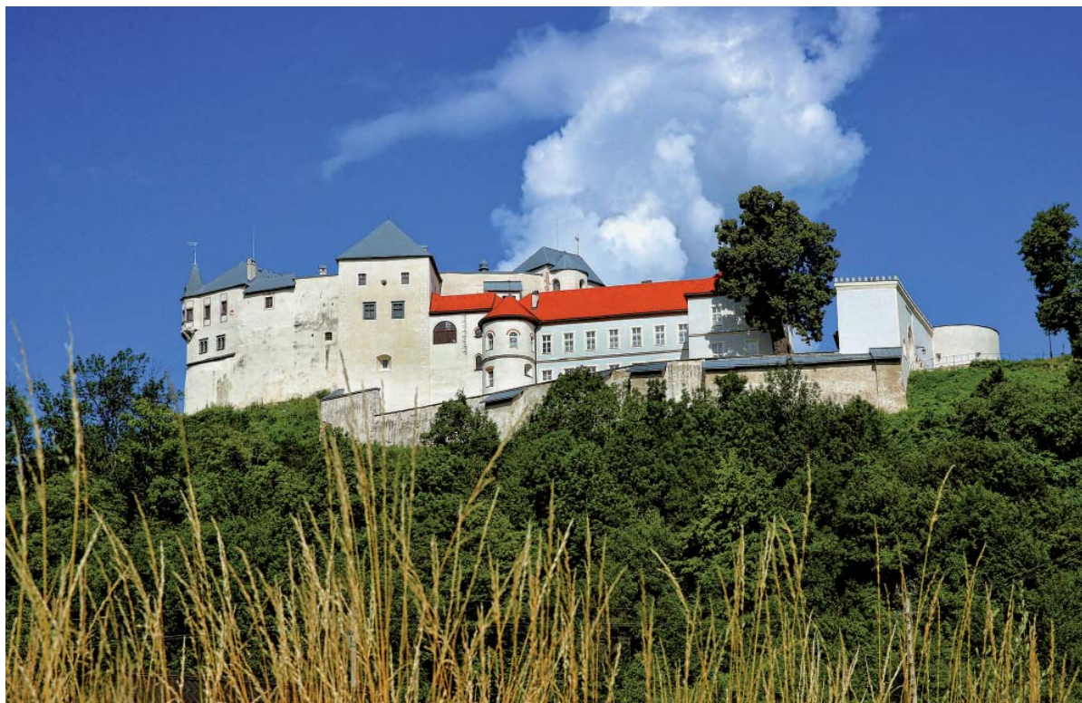
Na hrad si aj v tejto sezóne našlo cestu mnoho turistov.

Pozitívne ohlasy u návštevníkov hradu vyvolalo rozšírenie prehliadkovej trasy o miestnosť Márie Terézie s historickým mobiliárom zakúpeným do majetku Železniární Podbrezová. Ďalšia zbierkotvorná činnosť podporovaná majiteľom hradu bola zameraná na reštaurovanie archeologických nálezov, čím sa v pravidelných intervaloch každoročne rozrastá historický fond zbierkových predmetov. Prehliadkový okruh hradu Ľupča sa vďaka týmto novinkám predlžil na jednu