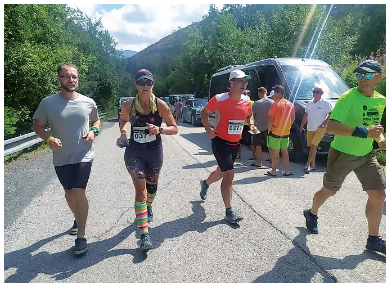
Bežcov preverilo aj ostré letné slnko.