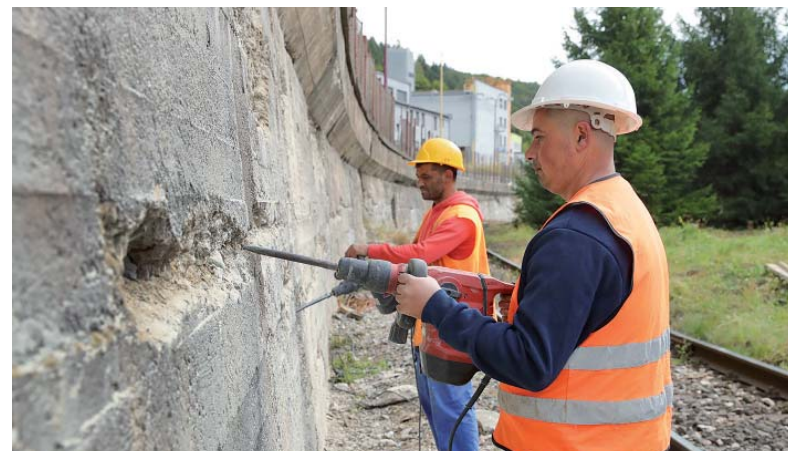
Robotníci vysekávajú poškodené časti oporného múru.

O priebehu prác budeme informovať v ďalších vydaniach novín Podbrezovan.