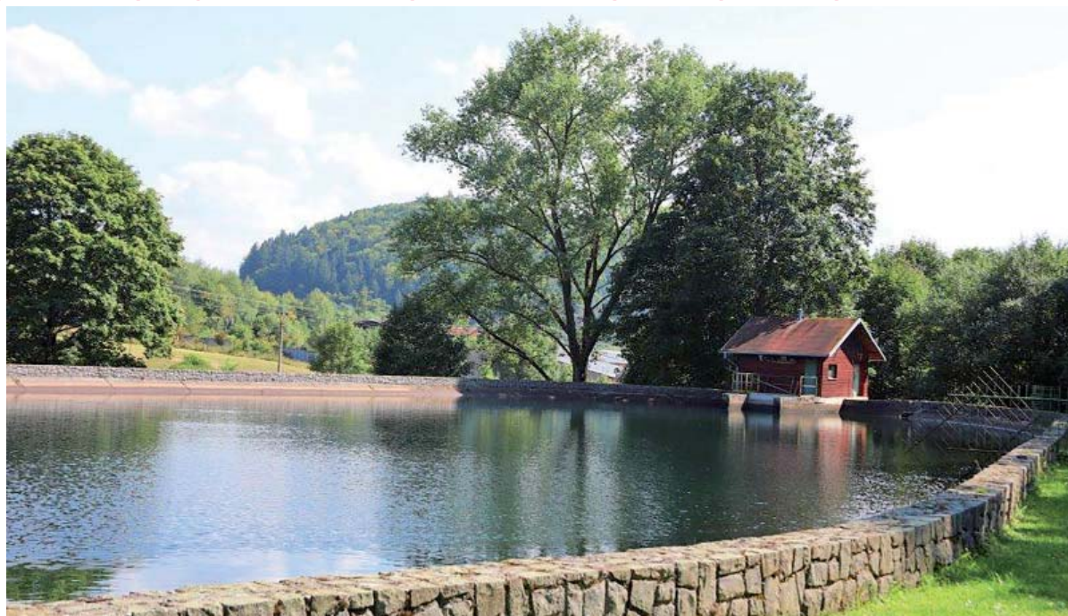
Elektrárň v Jasení je charakteristická krásnou prírodou.

Už sme spomínali, že elektrárň v Jasení je najvýkonnejšia zo všetkých malých vodných elektrární zasobujúcich podbrezovské železiarne. Vo vnútri ikonickéj stavby sa nachádzajú dva generátory. Väčší z nich má výkon 1 600 kilowattov, menší o polovicu menej. Použité sú Peltonove turbíny. Elektrárň vyrobí ročne okolo 12-tisíc megawatthodín (Mwh) elektrickej ener-