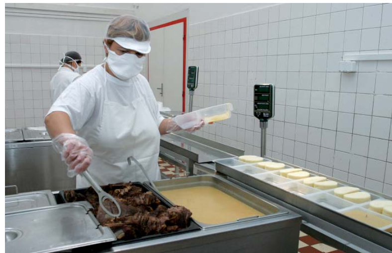
ŽP Gastroservis, s.r.o. pripravuje pre stravníkov aj ďalšie novinky.

Jednou z najväčších zmien, ktoré začnú platiť v priebehu októbra, bude burza jedál. Zabráni vyhadzovaniu jedla, keď si ho stravník z nejakého dôvodu nepreberie. „V súčasnosti prebieha príprava tejto novinky. Princíp je taký, že ak niekto nemôže prísť do práce a má objed-