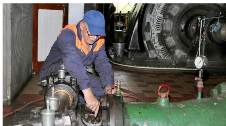
Zamestnanec počas strednej opravy.