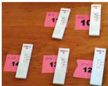
Antigénové testy.

- Mali sme za úlohu systémovo vyriešiť priebeh testovania z hľadiska administratívy a ešte predtým bolo potrebné zamestnancov zadeliť do harmonogramu. V spo-