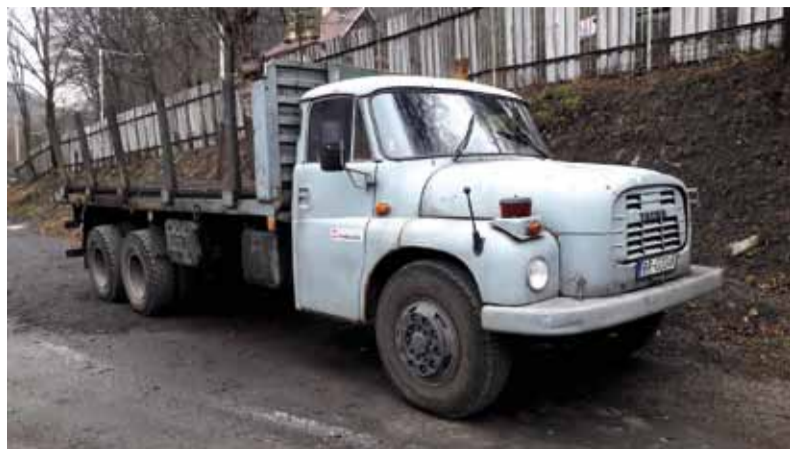
TATRA T 148 slúžila podbrezovským železiarňam neuveriteľných 44 rokov