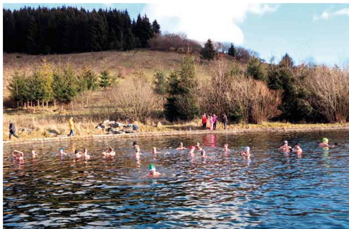
Či v zime či v lete, najradšej plávajú v partii.

- Určite starnú aj „ľadové medvede“, ale nepochybne pomalšie, keď zamrznú v ľadových vodách (smiech).