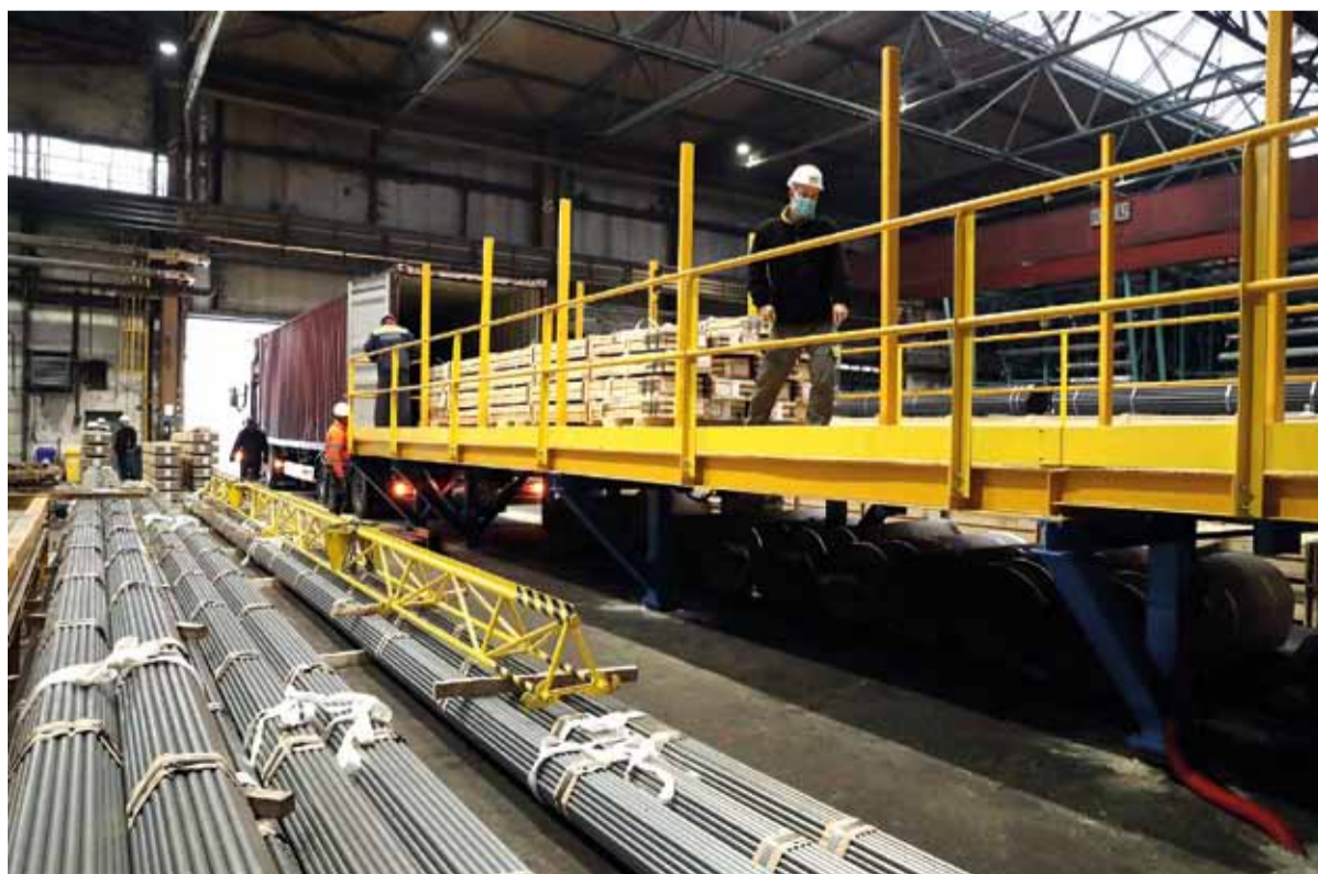
Dňa 19. januára v prevádzkarni ťahareň rúr prvýkrát nakladali kontajner pomocou automatickej plošiny.