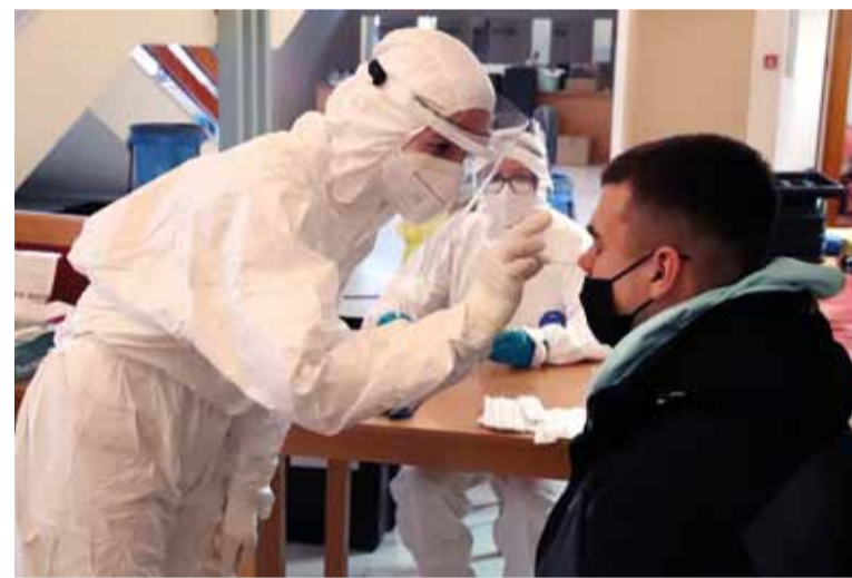
Testovanie malo bezproblémový priebeh.