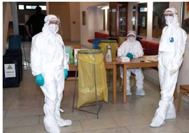
Odborný tím

- V mobilnom odberovom mieste Domu kultúry ŽP a.s. v Podbrezovej bolo vykonaných 907 antigénových testov. Z nich bolo pozitívnych osem, čo predstavuje pozitívitu 0,88 percenta. Ďakujem