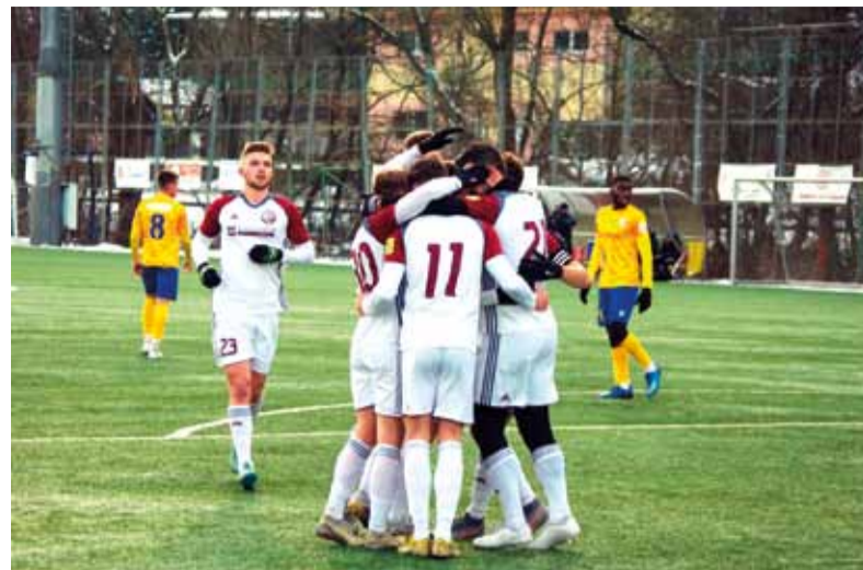
Radosť po jednom z gólov našich futbalistov v domácom zápase s Pohroním