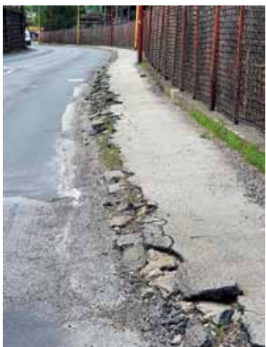
Súčasný stav cesty I/66 pri areáli ŽP a.s.