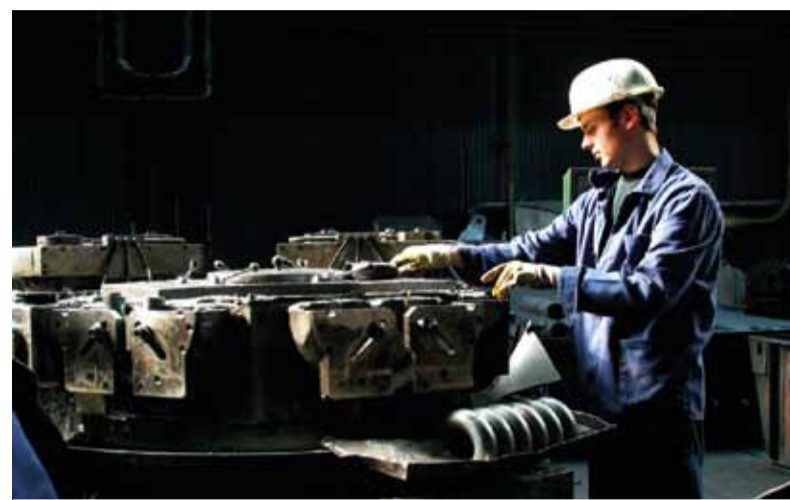
Delenie oblúkov na karuselovej pile

Medzi posledné najvýznamnejšie investície môžeme zaradiť výmenu už spomínaného plynového ohrevu, teraz však za elektrický indukčný ohrev, ktorý bol zakúpený na tlačnú linku č. 1 a č. 2 a výrazne pomohol zvýšiť kvalitu a znížiť technologicky nutnú predváhu pri výrobe oblúkov.