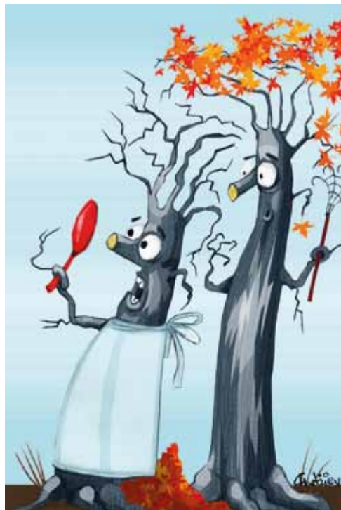
Druhé miesto v Hlohovci