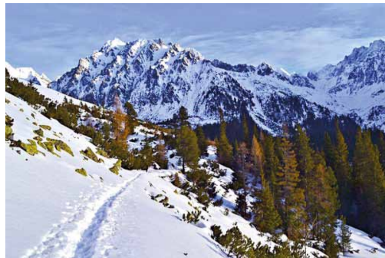
Mengusovská dolina z červeného turistického chodníka.

Ak však máte chuť na fyzicky náročnejšiu túru, z Popradského plesa môžete vyraziť po červenej značke na výstup do Sedla pod Ostrvou (nadmorská výška 1966). Trasa výstupu vedie strmým svahom, čo znamená, že netreba zabúdať na overenie si počasia a lavínového nebezpečenstva. Netreba zabudnúť ani na dobrú výstroj – palice, cepín a mačky. Výhľady zo sedla smerom nadol do rozľahlej Mengusovskej doliny a na okolité snehom pokryté štíty sú rozprávkovo krásne. A keď rozprávkovo, myslíme to doslova. K Mengusovskej doline sa totižto viaže niekoľko povestí o tatranských vílach, ktoré v nej kedysi žili. Jedna z nich hovorí o istom šuhajovi, ktorý raz pred cestou do Poľska svojej milej