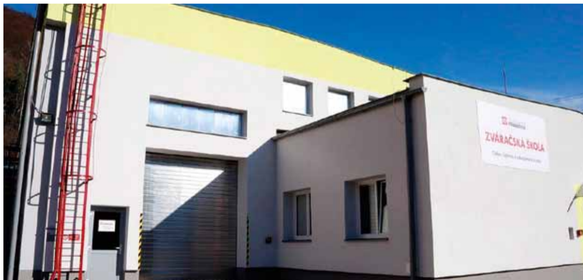
Fasáda zrekonštruovanej zväračskej školy

Rekonštrukcia zväračskej školy bola zameraná na energetickú úspornosť budovy a obnova zväračskej techniky bola zameraná na úsporu materiálu a úsporu elektrickej energie. Ako vedúci zväračskej školy som veľmi rád, že bola zrealizovaná táto investícia a dokonca aj v tomto roku, ktorý je poznačený mnohými obmedzeniami.