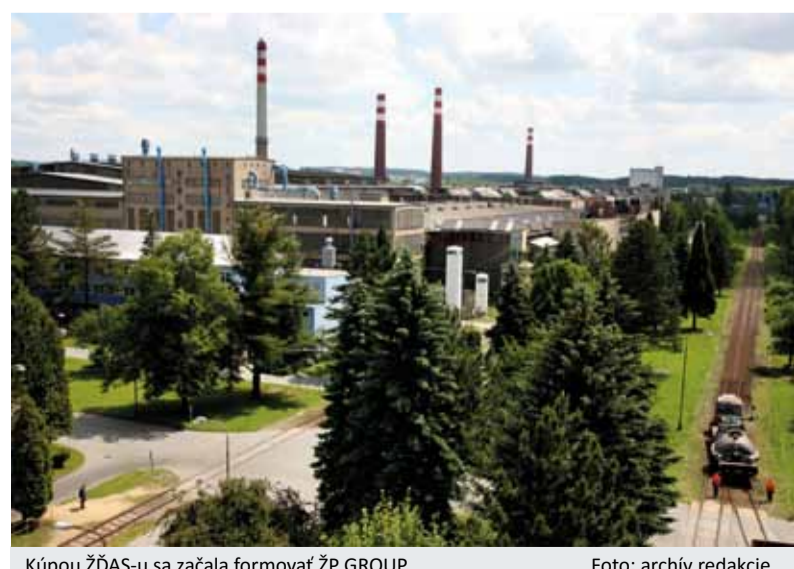
Kúpou ŽDAS-u sa začala formovať ŽP GROUP.