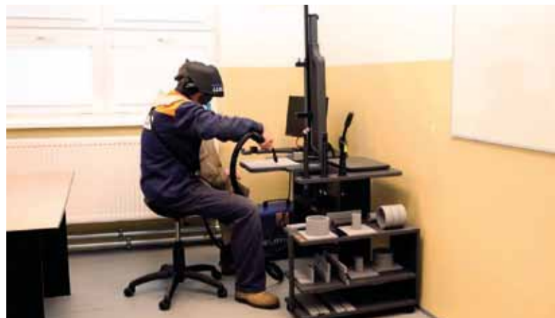
V zväračskej škole pri výučbe pomáha novozakúpený trenažér.

Vzhľadom na to, že príprava a realizácia rekonštrukcie boli vykonávané počas beztak náročného obdobia opatrení proti šíreniu COVID pandémie, ďakujeme všetkým zúčastneným zo Železiarní Podbrezová a.s. a zhotoviteľovi Sunik s.r.o. za zvýšené úsilie a dobrý výsledok.