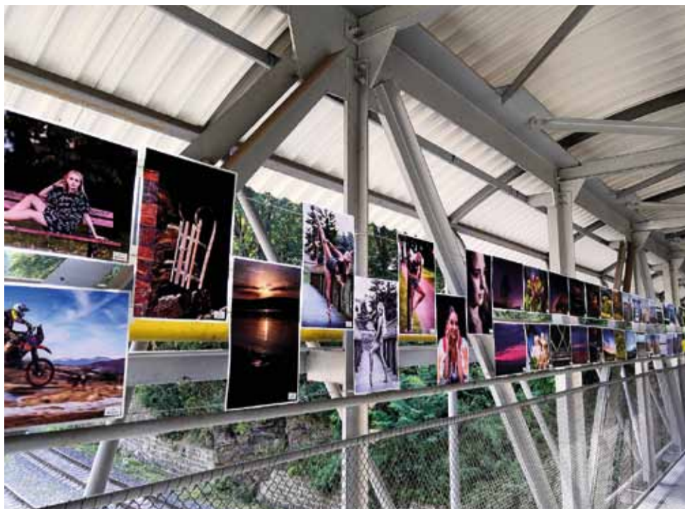
Pohľad na výstavu fotografií