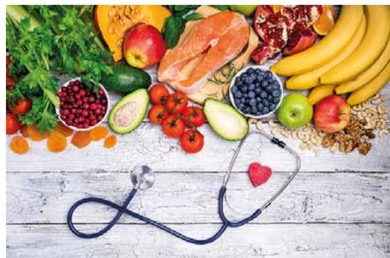
Počas aktuálneho obdobia je dôležité nezabúdať na vitamíny.

a jarných mesiacoch. Tieto ochorenia sa komplikovali zápalmi dutín v ôsmich prípadoch, zápalmi stredného ucha v jedenástich prípadoch a len v deviatich prípadoch zápalom pľúc. Najviac komplikovaných prípadov je vo vekovej skupine seniorov, ekonomicky aktívneho obyvateľstva a žiakov základných škôl. V 37. kalendárnom týždni najvyšší počet chorých na ARO je v absolútnych číslach v okrese Zvolen, Rimavská Sobota, Žarnovica a Žiar nad Hronom. Čo sa týka chrípky a jej podobných ochorení je najvyšší počet pacientov opäť v okrese Žiar nad Hronom a Banská Bystrica.