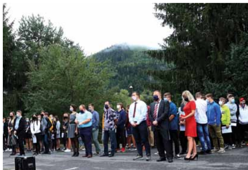
Jednotlivé triedy počas otvorenia nového školského roka.

alizovaná aj ďalšia etapa rekonštrukcie školského internátu a sociálnych zariadení, čím bol zmodernizovaný vonkajší aj vnútorný vzhľad školy.