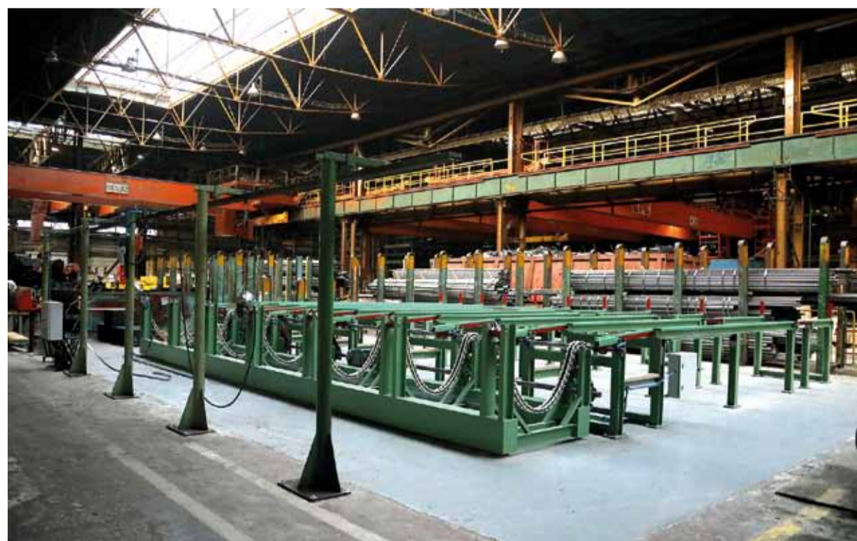
Nový kontrolný rošt v hale č. 13 so vstavanou váhou a pracoviskom na zväzkovanie rúr. Viac sa dočítate na strane 3.