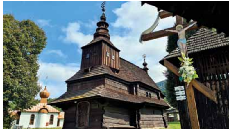
Ruský Potok, Cerkva svätého Michala

Vstupnou bránou do rezervácie Stužica je takzvaný Temný vršok. Nemenej zaujímavý je aj výlet do okolia vodárenskej nádrže Starina,