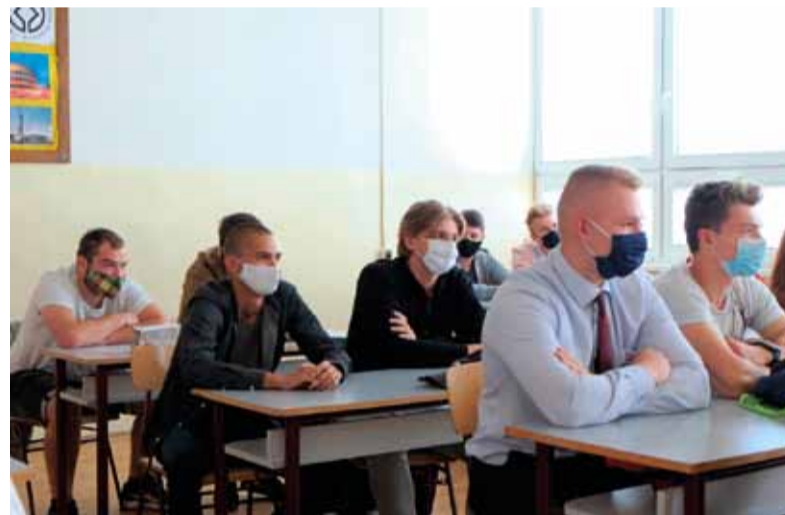
Žiaci v triede objektívom Jána Peteraja