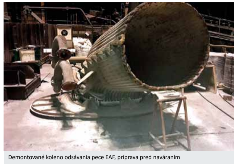
Demontované koleno odsávania pece EAF, príprava pred naváraním

A my by sme si priaľi, aby sa nám do konca roka naskytlo viac zákaziek, aby sme od januára budúceho roka mohli nabehnúť na 4-čatový pracovný režim, na ktorý sme už zvyknúť niekoľko rokov.