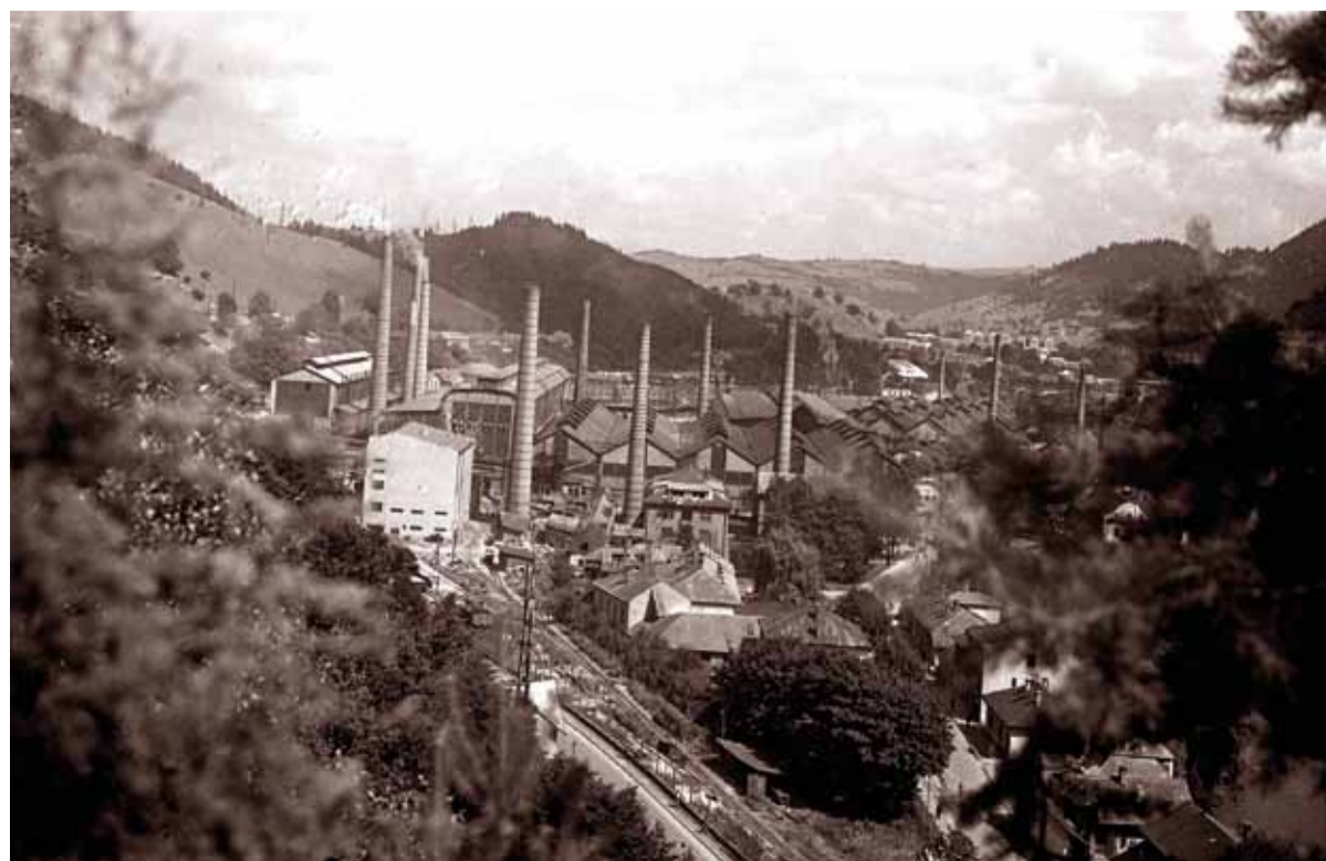
Pohľad na Podbrezovú v šesťdesiatych rokoch minulého storočia.

Z uvedeného vyplýva, že od oficiálneho ustanovenia obce v roku 1953 najväčšiu zásluhu na jej rozvoji mali železiarne. Svojimi aktivitami prispeli k rozvoju bytovej výstavby a rastu obyvateľstva a k zvýšeniu úrovne spoločenskej, obchodnej, kultúrnej a športovej vybavenosti. Podbrezová sa tak stala jednou z popredných obcí okresu Brezno a železiarne podstatnou mierou prispeli k jej životaschopnosti.