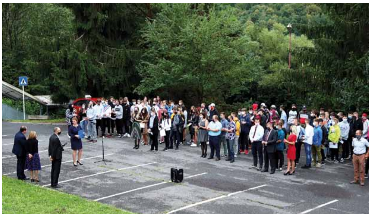
Začiatok školského roka 2020/2021 v Súkromnej spojenej škole Železiarne Podbrezová

„Pre vás prechod na strednú školu znamená významnú kvantitatívnu aj kvalitatívnu zmenu. Prišli ste do školy, v ktorej sa chcete cítiť dobre a ktorej veríte, že vám po-