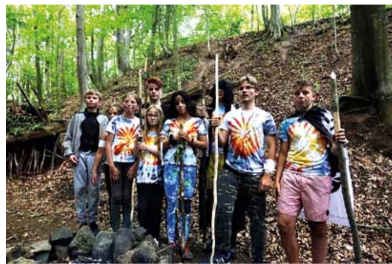
Budovanie osád sa deťom páčilo.

- V tomto tábore som bol už tretí rok po sebe a vraciam sa tam preto, lebo ma to stále neomrzelo a je to jednoznačne najlepší tábor, v akom som kedy bol. Bol som tam teraz predposledný rok, budúci už budem posledný, a určite viem, že do Repišťa chcem ísť opäť. Najviac sa mi páčilo, keď sme budovali osady, to bolo určite najlepšie,