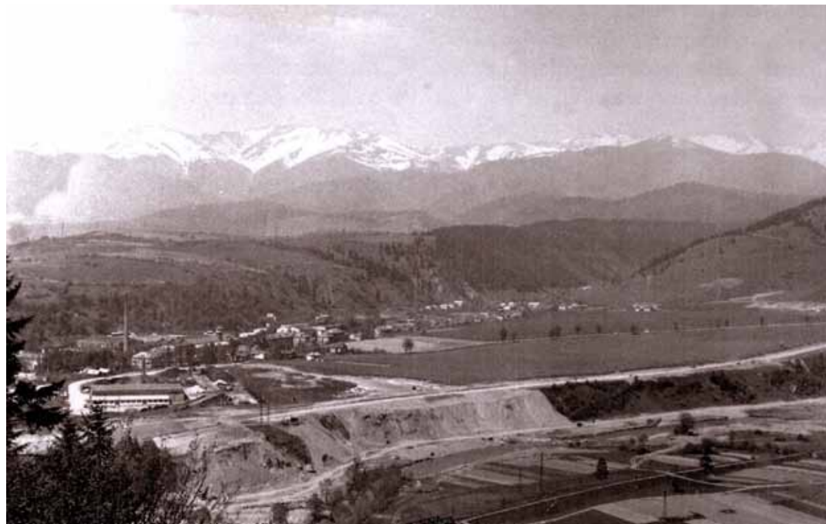
Priestranstvo pred výstavbou nového závodu v roku 1967.

- Prajem im, aby prosperovali, nech sa im darí, nech majú dostatok zákaziek. Ak sa bude dariť železiarňam, budú sa mať ľudia na Horehroní dobre. Vždy to tak bolo, aj bude. A všetkým prajem, aby tá korona už navždy odišla a nech sú všetci zdraví.