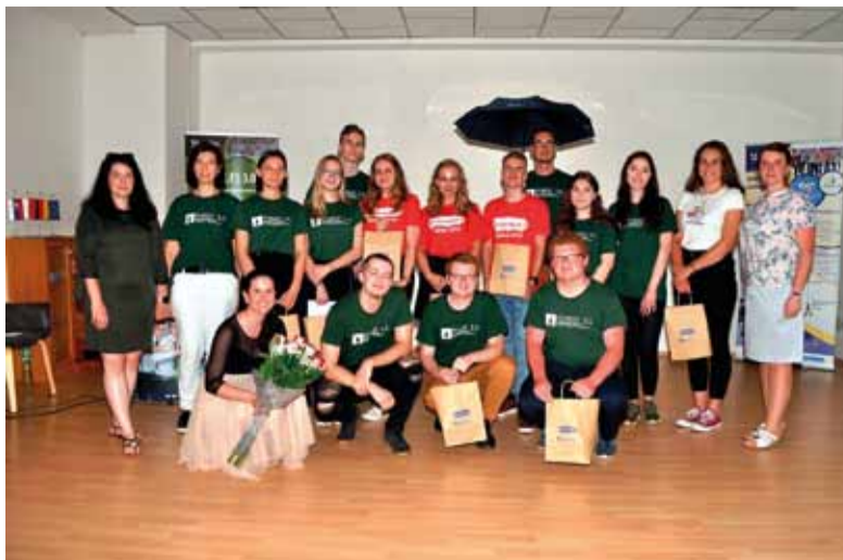
Erasmus+ je program Európskej únie, ktorý podporuje aktivity v oblasti vzdelávania, odbornej prípravy, mládeže a športu počas programového obdobia v rokoch 2014 až 2020

Súčasní, ale i bývalí žiaci našej školy prezentovali svoje skúsenos-