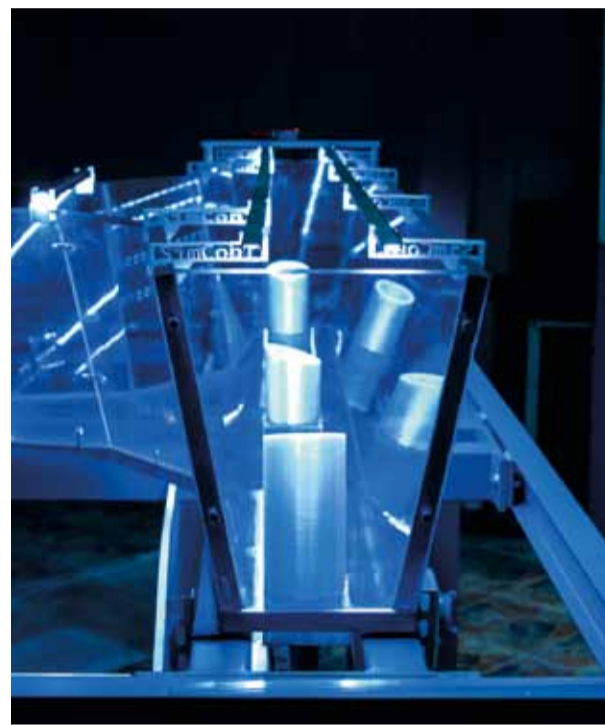
SimConT – jedno z laboratórií, ktoré bolo vybudované v spolupráci so ŽP Výskumno-vývojovým centrom, s.r.o. a ŽP a.s.

Absolventi študijných odborov technického zamerania majú veľké predpoklady na budovanie úspešnej kariéry na Slovensku a v zahraničí. S nástupom do pracovnej sféry tak nemajú problém ani študenti z Fakulty materiálov, metalurgie a recyklácie (FMMR) Technickej univerzity v Košiciach