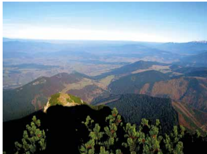
Ak vyjde počasie, výhľad z Choča naozaj stojí za to.

Naskytl sa nám nádherný výhľad na Západné Tatry, Liptovskú Maru, Nízke Tatry, Veľkú Fatru, Malú Fatru, aj Podtatranskú kotlinu. Vrchol Veľkého Choča má tvar nepravidelnej pyramídy. V momente sme zabudli na nervozitu,