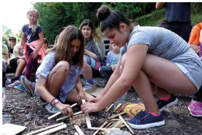
K letným táborom neodmysliteľne patrí zakladanie táborového ohňa

- V Repišti som bola šiesty rok po sebe, čiže už to tam celkom poznám a rada sa do tohto tábora vraciam. Za tie roky to viem porovnať a môžem povedať, že tento rok boli asi najlepší animátori. Takisto bol výborný kolektív, takže v tábore bolo veľmi dobre. Najviac sa mi páčilo stavanie osád, ale aj zážitky na izbe.