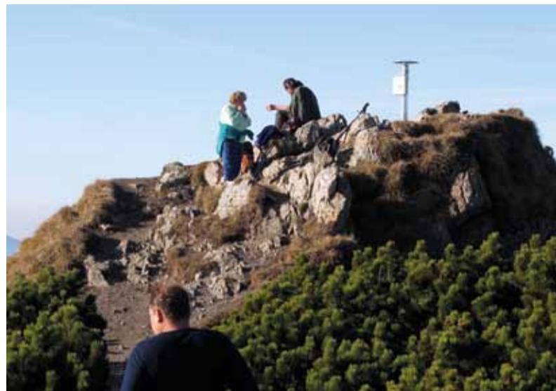
Vrchol Veľkého Choča

ktorá nás sprevádzala počas kráčačia nahor a boli sme šťastní, že sme mali možnosť vidieť tú nádhuru a presvedčiť sa, že je to naozaj najkrajší výhľad, aký sa vám môže v prírode naskytnúť.