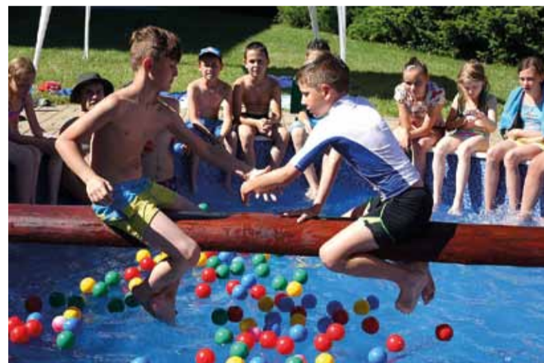
U detí sú obľúbené aj hry v bazéne, napríklad veľká vodná vojna.

vydal na cestu domov s celou posádkou kadetov. No na planétu Zem nedorazil. Stratil sa za veľmi záhadných okolností. Miesto skutočného Skylightu pristál na planéte Zem jeho klon bez akejkoľvek posádky. Našťastie palubný denník klonu si uchoval svoju dráhu, takže bolo jasne vidieť, z ktorej časti vesmíru štartoval. Bola to tajomná čierna hviezda, ktorá sa krmila energiou celého vesmíru. Je možné, aby kadeti uviazli v blízkosti hviezd? Na záchrannú misiu však treba skúsených kadetov. Jedine Padawani, učni majstra Yodu, to môžu dokázať. Možno to budeš práve ty, kto sa stane Padawanom