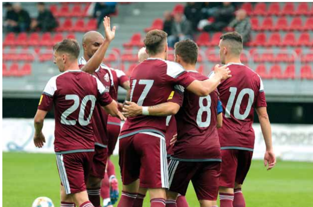
Radosť našich futbalistov po vstrelenom góle do siete Liptovského Mikuláša.