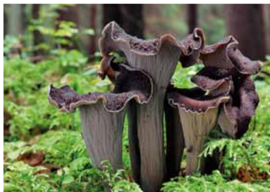
Lievnik trúbkovitý.

sa použiť pod mäso alebo je vo všeobecnosti vhodná do čínskej kuchyne. Keď huby rastú, tak chodím na ne aj viackrát do týždňa.