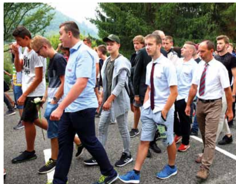
Žiaci SSOŠH ŽP po rozchode do svojich tried.