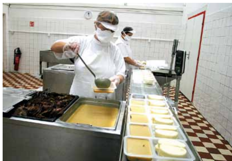
ŽP Gastoservis ponúka chladenú aj mrazenú stravu

ske krízy. Disponujeme veľmi kvalitným a odborným pracovným kolektívom, máme vlastnú školu, kde vychovávame vzdelanú mladú generáciu a náš výrobný program je na tak vysokej úrovni, že kvalita ocele je diametrálne odlišná od tej vo svete. Vo vedení máme náklady pod kontrolou a naši obchodníci ovládajú európske aj svetové trhy. Nevidím dôvod, prečo by sme my mali podliehať panike. Opatrenia, ktoré sme prijali, sú správne. Podbrezová je silná a prenesie sa aj cez túto krízu. Neprerastáme opravovať a investovať a čo je podstatné, neprestaneme zo strany vedenia bojovať za to, aby peniaze, ktoré zarobíme, ostali u nás – pre našich zamestnancov. Nesúhlasím, aby sme sa skladali na viac, ako je potrebné – na platy štátnych úradníkov, ktorých je veľa alebo na príspevky pre ZMOS. Naša komunikácia s politickými predstaviteľmi bude aj naďalej pokračovať a bude veľmi tvrdá, pretože musíme hájiť svoje záujmy, aby Železiarne Podbrezová aj v budúcnosti boli prosperujúcou spoločnosťou, kde sú ľudia spokojní.