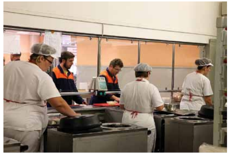
Stravníci majú na výber z ôsmich jedál

Taktiež bol preberaný aj nie bežný spôsob stravovania takpovediac „na voľno“, ktorý je zamestnancami často využívaný. Je však veľmi náročné odhadnúť, aký bude v daný deň záujem. Tento systém bol ponechaný práve preto, aby aj ten, čo