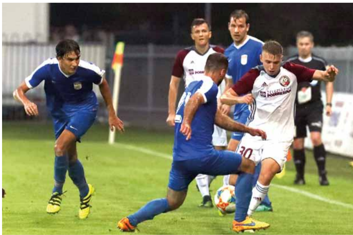
V derby zápase proti bystrickej Dukle ťahali naši futbalisti za kratší koniec, zabodovať sa im nepodarilo ani v Dubnici.

FK Železiarne Podbrezová: Macej – Viazanko, Mizerák, Otrisal, Mejri (54. Pribula), Šulc, Jenat (85. Vondryška), Paraj, Chvátal, Ďatko, Galčík.