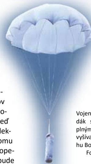
Vojenské lietadlo a padák spolu s batohom plným šatiek, ktoré boli vyšívané vetami z príbehu Boženy Palackovej.