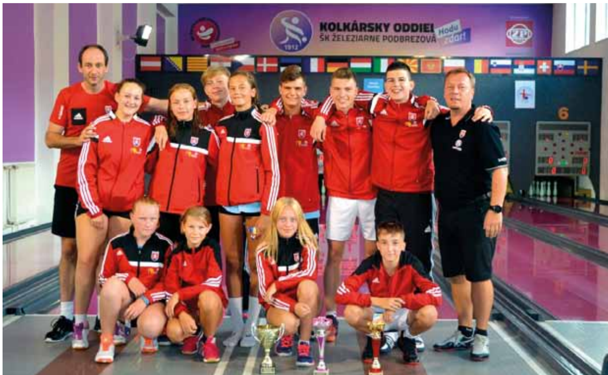
Dorastenci Kolkárskeho oddielu ŠK ŽP