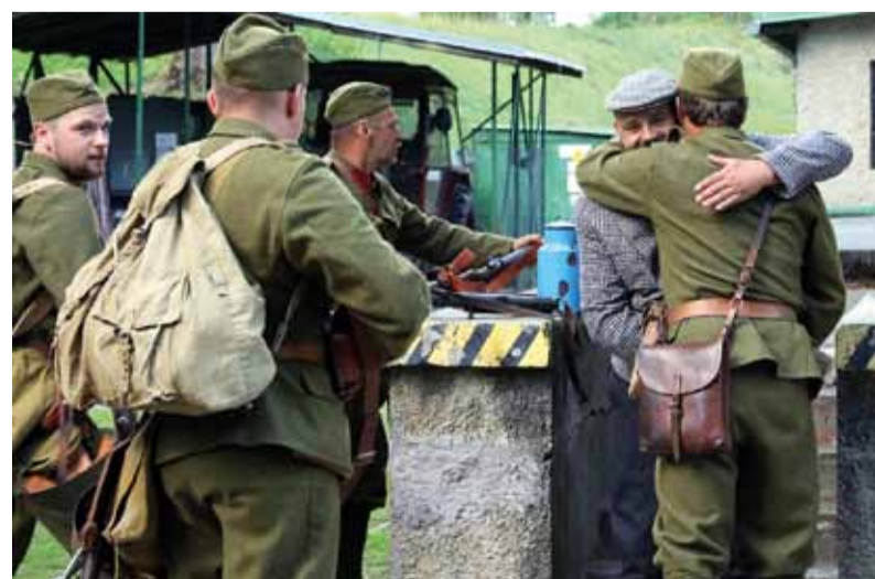
Dobové uniformy vojakov pôsobili veľmi dôveryhodne.

Česť pamiatke všetkým hrdinom SNP, ktorí bojovali za lepšiu a slobodnejšiu budúcnosť.