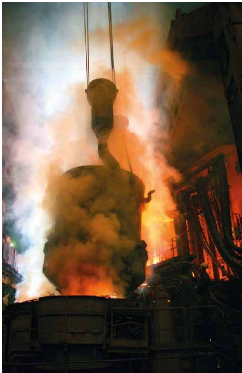
Vsádzanie oceľového šrotu do elektrickej obľukovej pece.

Druhou oblasťou, na ktorú chcem upriamiť vašu pozornosť, je pomoc štátu zahraničným firmám. Veľa rokov sledujeme zahraničné firmy, ktoré prichádzajú na Slovensko a dostávajú od štátu finančnú pomoc prostredníctvom odvodov, odpisov alebo priamym príspevkom na technológiu či udržanie zamestnanosti. Faktom je, že štát a vláda každý rok odsúhlasia niekoľko takýchto príspevkov pre prichádzajúcich zahraničných investorov. Také isté peniaze pri investíciách vynakladá aj naša spoločnosť. Napríklad za posledných šesť ro-