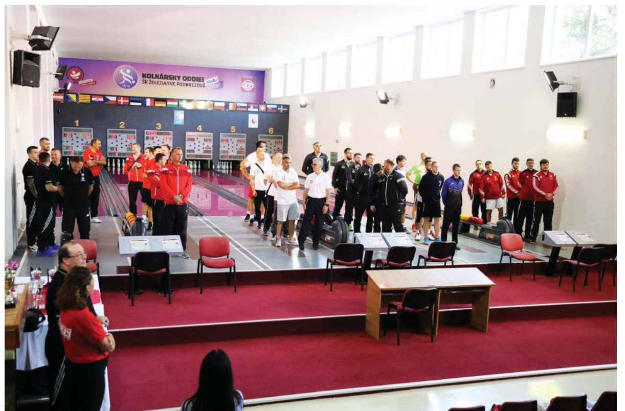
Aj tento rok štartovali na medzinárodnom kolkárskom turnaji ŽP Cup kvalitní hráči.

chod, ženy v slovenskej extralige a dorastenci majú vo svojej lige dve družstvá „A“ a „B“.