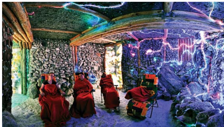
V rámci pobytu ZDRAVÝ VÍKEND môžete využiť aj solnú jaskyňu

Ďalej zahŕňa 1 x za pobyt hodinový vstup do kardiofitness a 1 x hodinový vstup do vitálneho sveta.