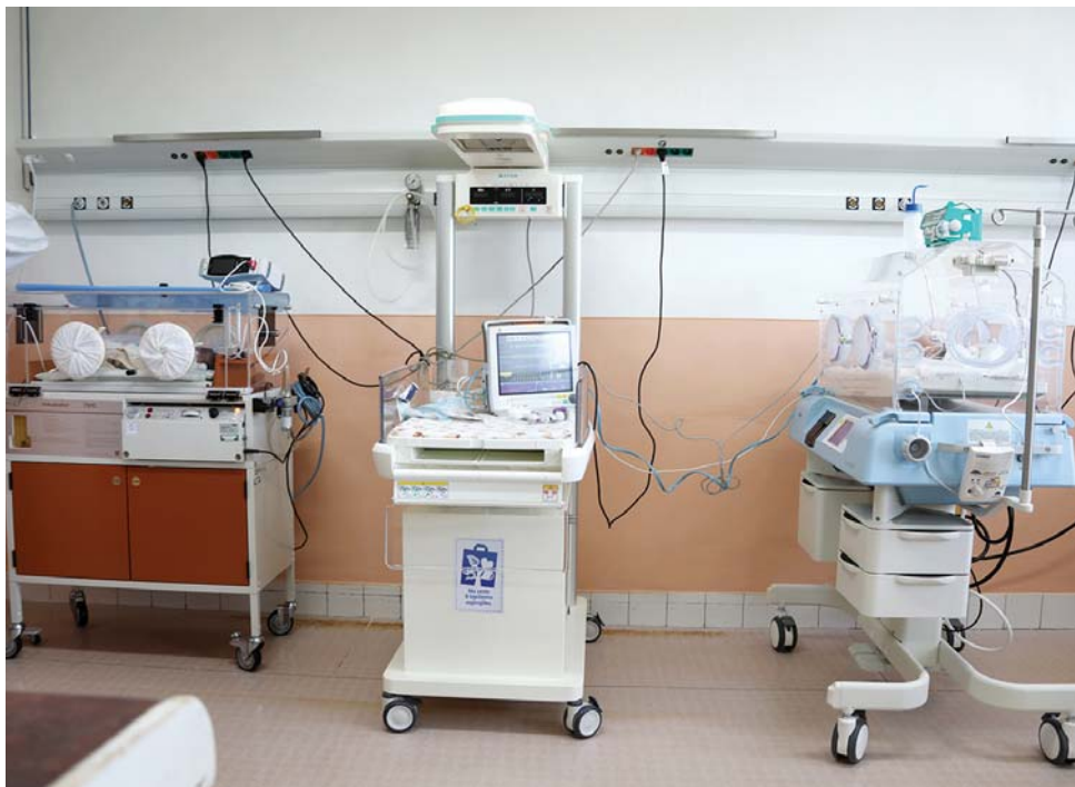
Nástenná rampa výrazne prispela k skvalitneniu oddelenia.

Nástenná rampa pevnej hliníkovej konštrukcie s integrovanými rýchlospojками pre plyné média, ako aj elektrické slaboprúdové zásuvky, boli pre NsP Brezno vyrobené na mieru a výraznou sumou na ňu pris-