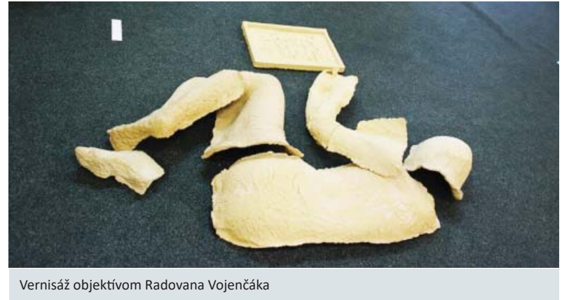
Vernisáž objektívom Radovana Vojenčáka

Prepoistiť sa možno raz ročne, čas máte do 30. septembra. Na výber máte medzi štátnou Všeobecnou zdravotnou poisťovňou a súkromnými zdravotnými poisťovňami Dôvera a Union. Prihlás-