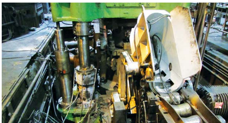
Pohľad na vymenený vykladač z dierovacieho lisa

Pre veľké množstvo prevedených prác spomenien len niektoré. Na dopravu pred nožnicou Lindemann bol opravený základový rám prekladača z váhy spojený so založením