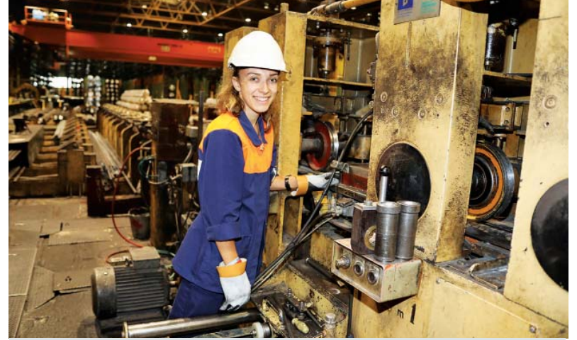
Kristína Gierťlová