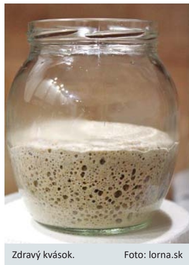
Zdravý kvások.

5. až približne 14. deň: počas týchto dní kvások krmíme s 30 g vody a 30 g ražnej chlebovej múky, dovtedy, kým nebude kvások rásť pravidelne. Môžete si fixkou značiť na pohár jeho objem. Ak jeden deň