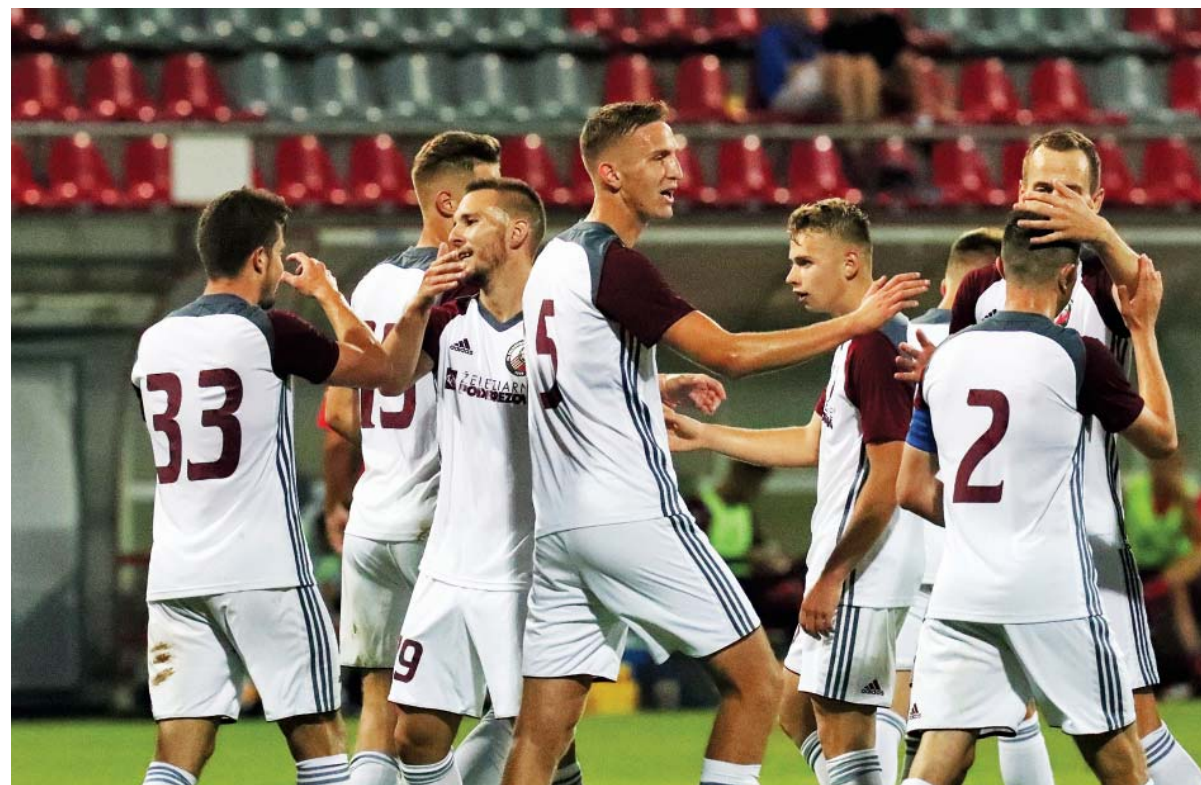
V domácom zápase s Liptovským Mikulášom sme sa z gólu radovali štyrikrát.