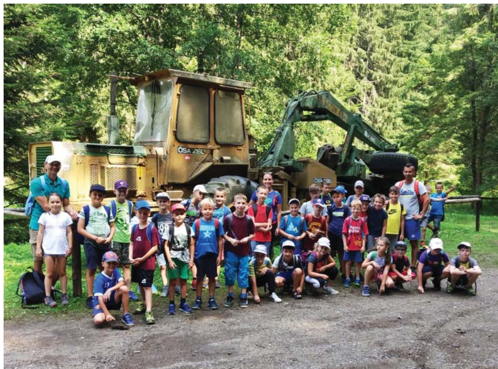
Okrem futbalových tréningov deti v tábore navštívili aj kúpalisko v Podbrezovej, boli na turistike pod Skalkou či v lesníckom skanzene Vydrovo.

Chcem pochváliť všetky deti, že sa príkladne správali a každý deň bol pekným zážitkom. Ďakujem trénerom, že sa venovali našej mladej futbalovej generácii a tešíme sa na ďalšie spoločné futbalové zážitky.