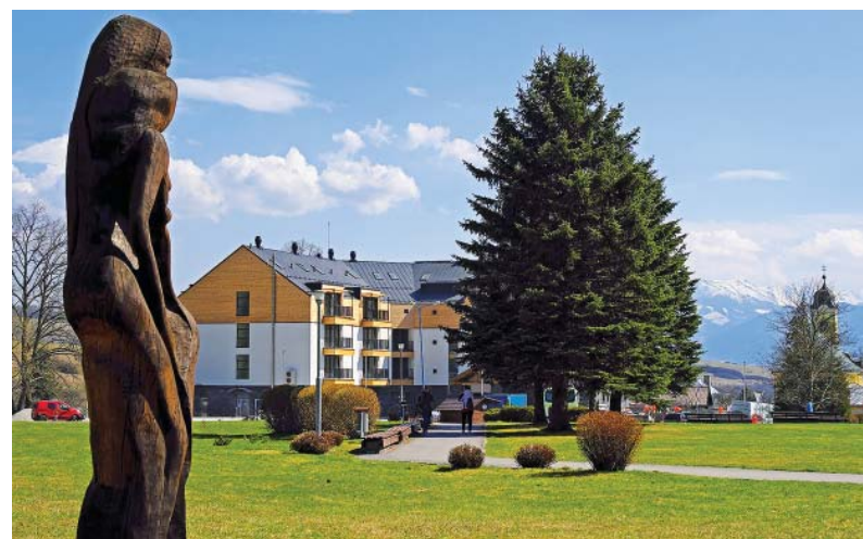
Kúpeľný hotel KUBO.

V prípade záujmu o pobyty sa zamestnanci môžu nahlásiť na tel. čísle 2912, kde im budú poskytnuté aj bližšie informácie.