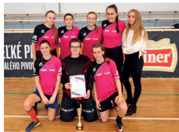
Dievčatá zo SG ŽP postúpili na krajské kolo vo florbale.

V novej športovej hale v Brezne sa uskutočnilo regionálne kolo vo florbale stredných škôl chlapcov aj dievčat. Obidva naše výbery SG ŽP bojovali o postup do krajského kola proti stredoškólakom z Gym-