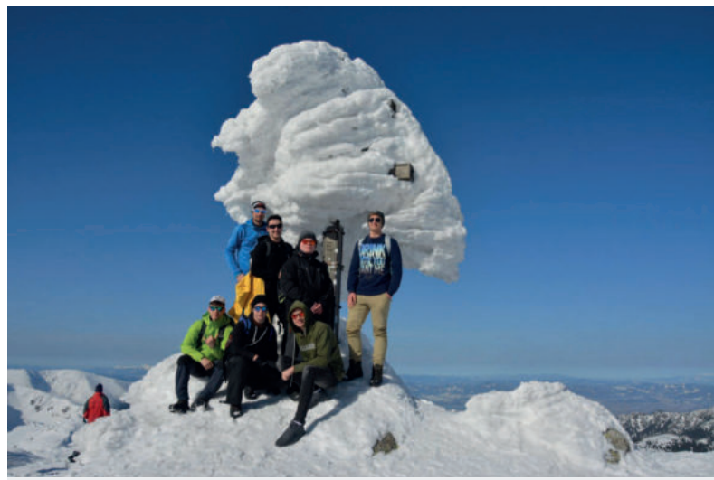
Účastníci výstupu na vrchole Ďumbiera