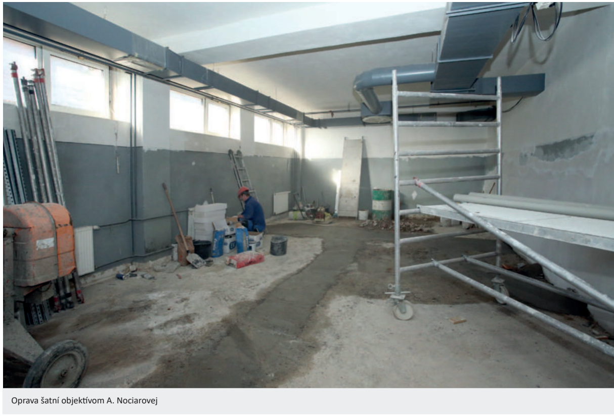
Oprava šatní

Šatne budú postupne opravované tak, aby bola zabezpečená neprerušovaná funkčnosť a chod prevádzkárni a časti šatní. Žiadam