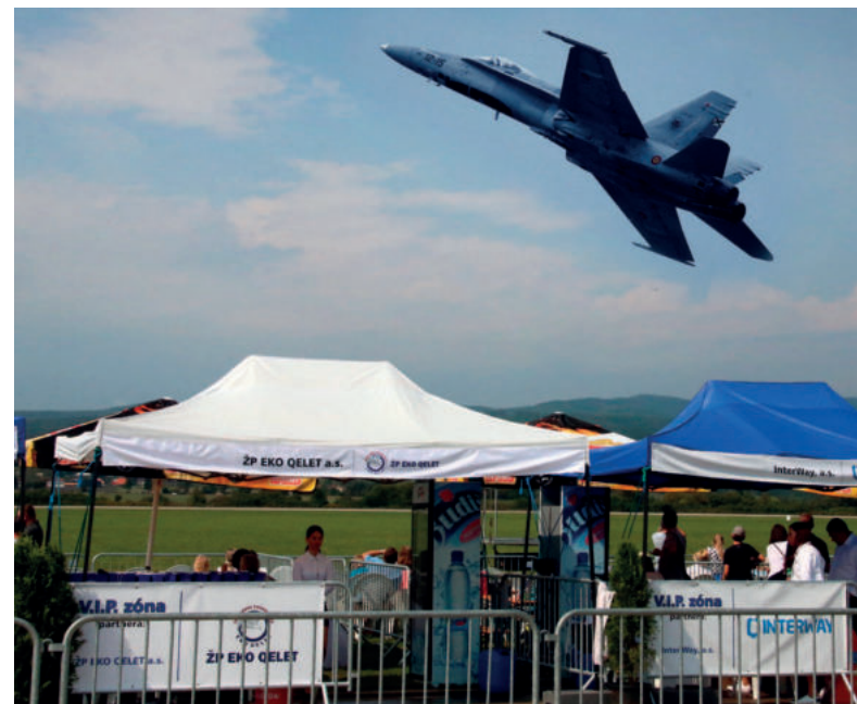
Stánok ŽP EKO QELET počas Medzinárodných leteckých dní v Sliachi.

“Dôležité sú pre mňa aj také ukazovatele ako personálna stabilita pracovného kolektívu, miera obnovy technologického parku či rozšírenie územného portfólia spoločnosti.