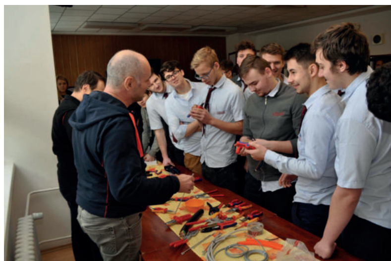
Dňa 12. februára žiakov odbornej školy potešila prezentácia elektrotechnických firiem. Pevne veríme, že sa dozvedeli aj niečo nové

Tatranskí rytieri ešte dlho s úsmevom spomínať.