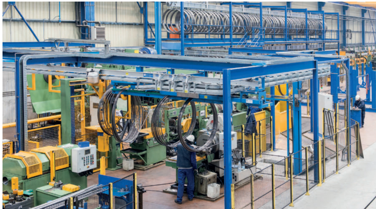
Výrobná hala v španielskej spoločnosti Transmesa

- Keďže mám dve relatívne malé deti, väčšinu voľného času trávim s rodinou. Rád si rekreačne zašportujem a k športu sa snažím viesť aj moje deti. No keď si potrebujem naozaj oddýchnuť, vyberiem sa na poľovačku alebo rybačku.