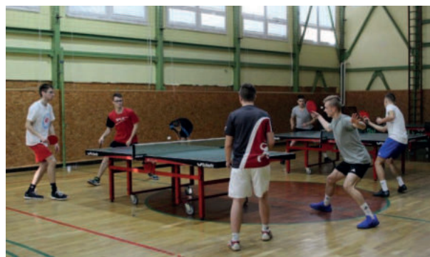
Napriek veľkej snahe naši žiaci nestačili na ligových hráčov.