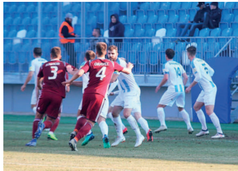
Úvodný zápas jarnej časti nám vyšiel výborne a z Nitry si odnášame tri body.