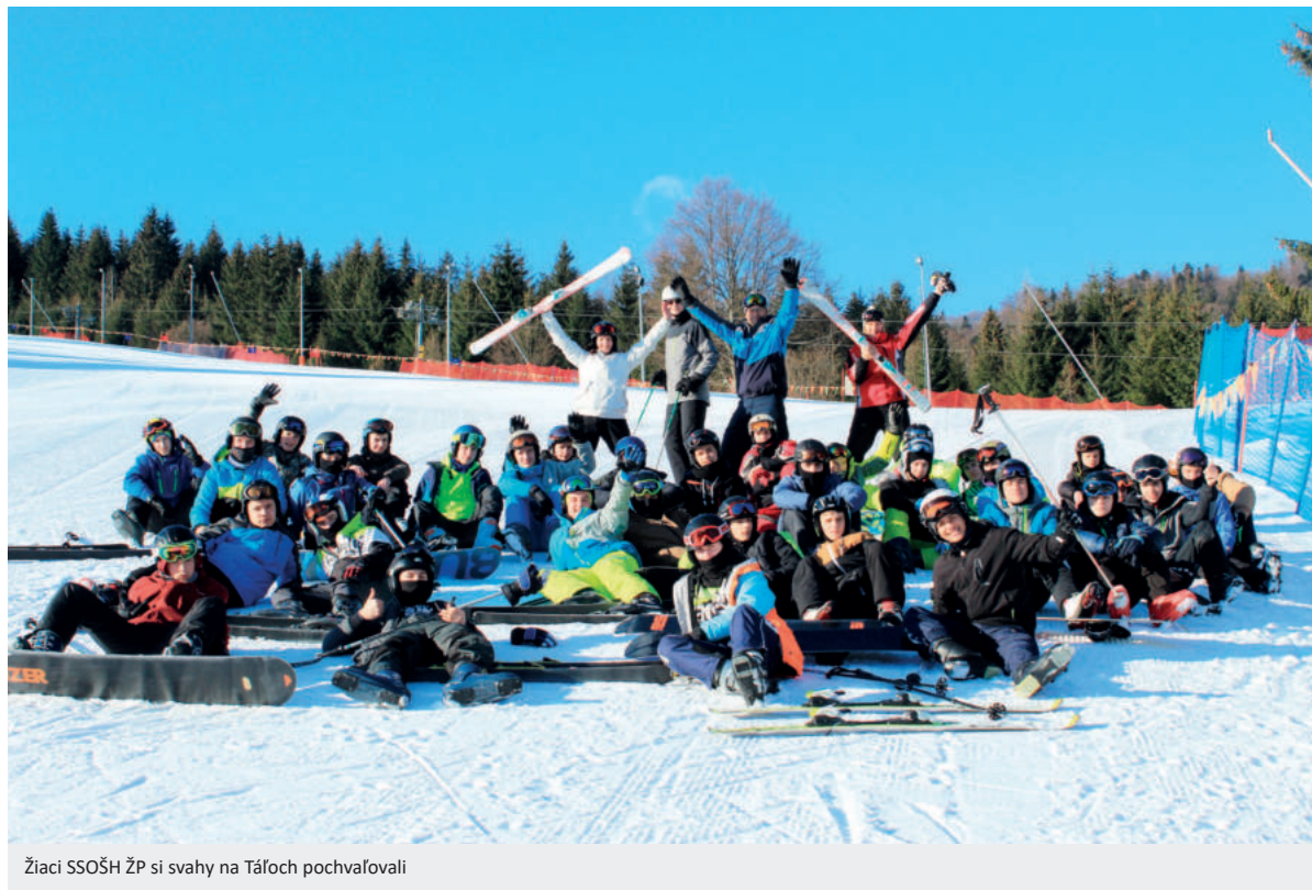
Žiaci SSOŠH ŽP si svahy na Táľoch pochvaľovali

Cesta naspäť na Trangošku nebola o nič menej zaujímavá a postupne sme všetci zaradom vyskúšali sklz jednotlivých materiálov na snehu. Myslím, že všetci zúčastnení si odniesli množstvo zážitkov a budú na túto akciu dlho spomínať. Tí, čo mohli s nami ísť a nešli, môžu naozaj ľutovať, ale odčiniť to môžu tak, že sa k nám pripoja na ďalšej akcii. Ďakujem všetkým zúčastneným.