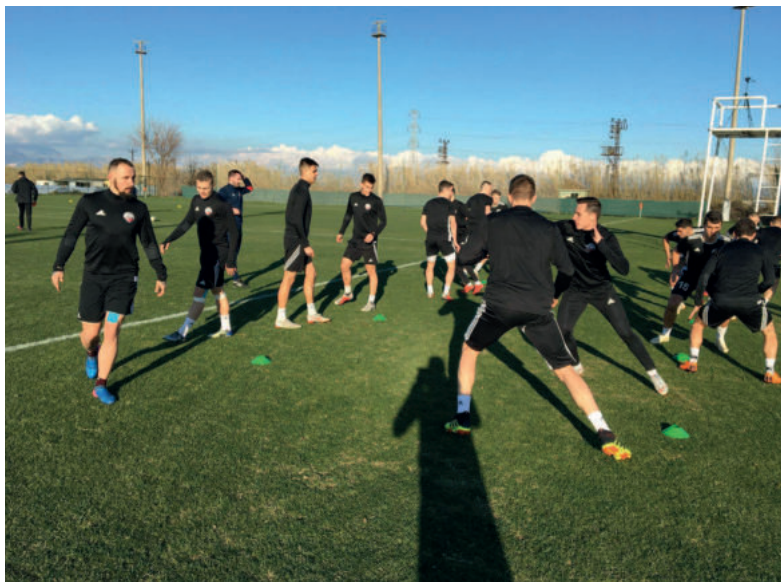
Hráči FK Železiarne Podbrezová počas tréningu na sústredení v tureckom Beleku.