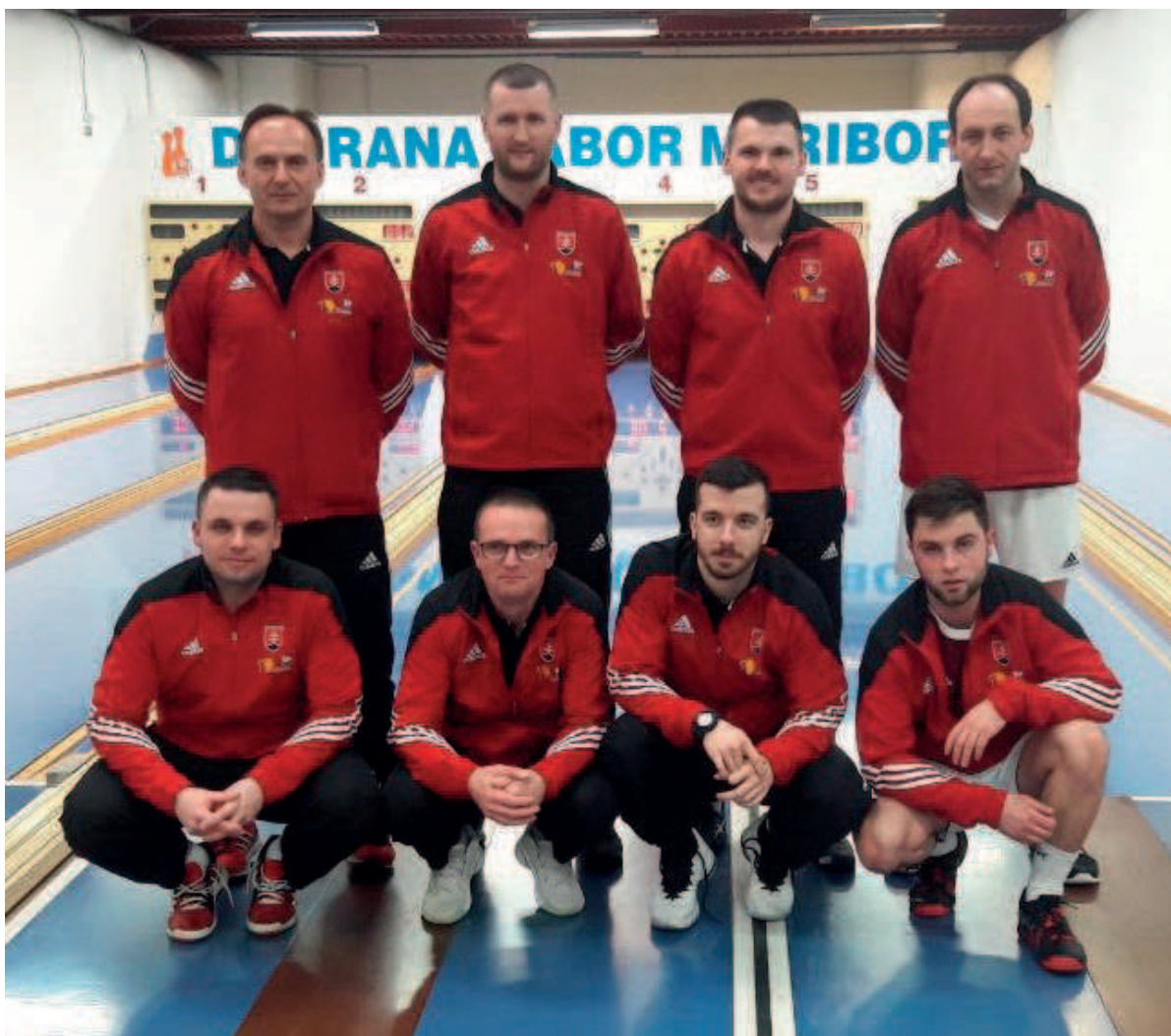
Kolkári ŠK Železiarne Podbrezová po roku opäť postúpili do Final four.

Priviezli sme síce prehru 6:2, no už teraz sa môžeme chystať, čo vymyslíme 30. marca na Szeged, nášho súpera v semifinále v chorvátskom Zaprésiči. Druhou semifinálnou dvojicou budú domáci Zaprésič a nemecký Rot Weiss Zerbst. V ženskej časti sa zídu Bamberg s Rosicami a Rijeka s BBSV Wien.