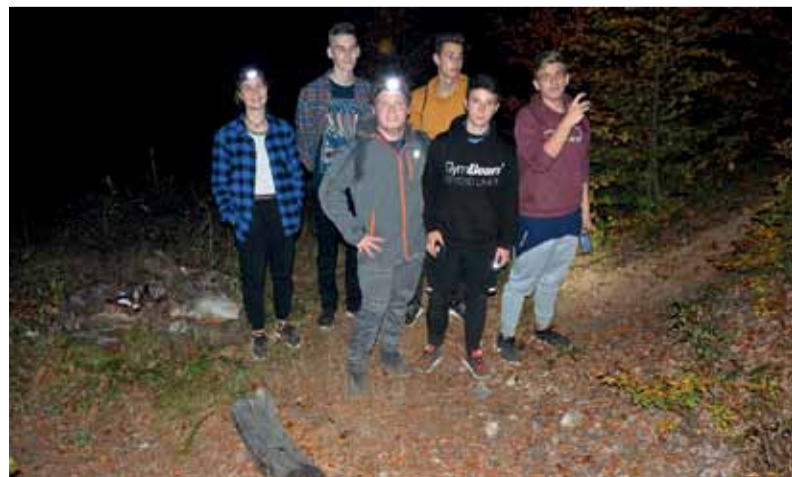
Nočný výstup za účelom pozorovania nočnej oblohy

sme si vychutnať pohľad na Vysoké Tatry. Rýchlo sme si chytili miesta na spanie a pustili sme sa do večere. Ani sme sa nenazdali a bola tma, ktorá nám umožnila pozorovať nádhernú nočnú oblohu. Posedeli sme chvíľu pri ohni s „hreběňovkármi“ a pobrali sme sa do spacákov. Noc nebola o nič nezaujímavejšia. Síce nevyspali, ale napriek tomu spokojní sme vstávali ráno o šiestej. Rýchlo sme si spravili čaj a naraňajkovali sa. Po rozlúčke s „hreběňovkármi“ sme sa ponáhľali naspäť do civilizácie. V Pohorelej sme zistili, že z horného konca nám autobus tak skoro nepôjde. Tak sme sa vybrali rýchlo ku hlavnej ceste, kde sme už nastúpili na spoj, ktorý nás doviezol do Brezna. Ďakujem všetkým piatim účastníkom za skvelú atmosféru a za to, ako to všetko skvele zvládli.