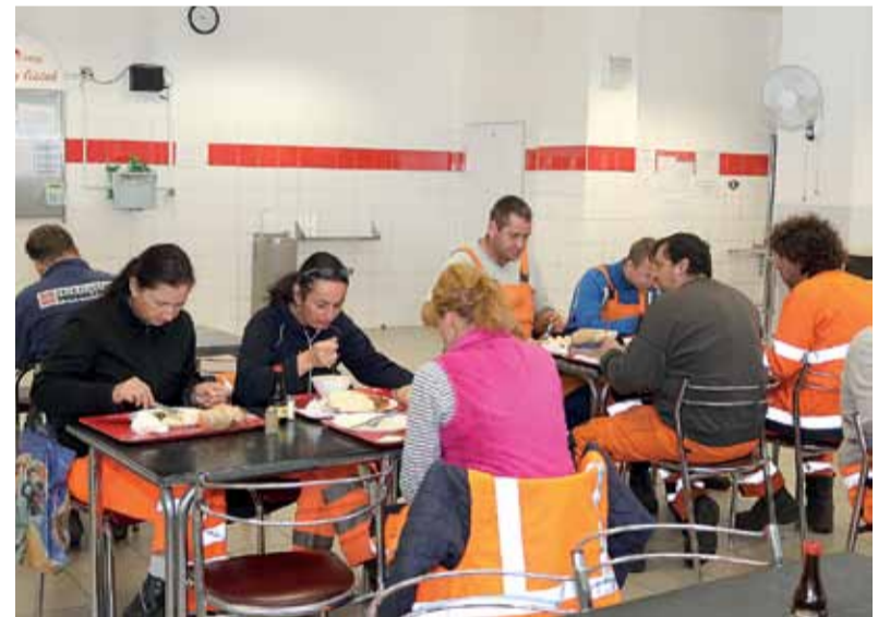
Stravníci novinku v kantíne uvítali.