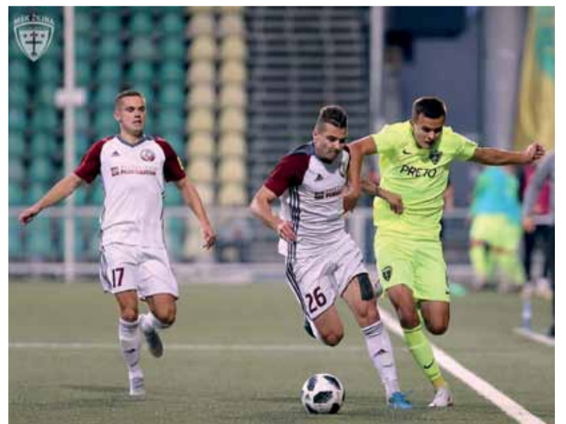
Po prehre so Žilinou sme vyhrali v pohárovom zápase s Malženicami.