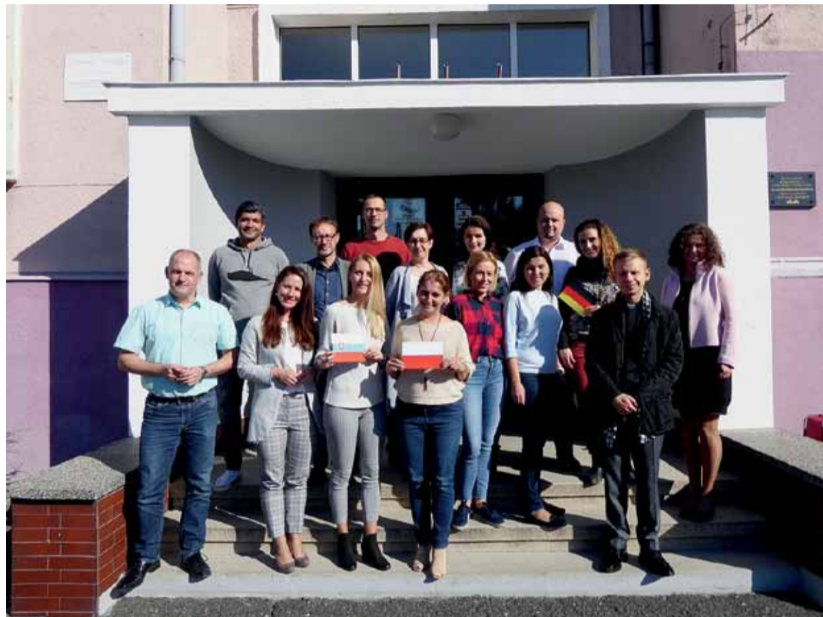
Účastníci medzinárodného stretnutia v rámci projektu „Les 3.0 – naše kultúrne dedičstvo“ v poľskom meste Sycow

le, vyučujúcim a hlavne samotným žiakom a žiačkam množstvo nových poznatkov, zážitkov, skúseností a výhod do budúcnosti.