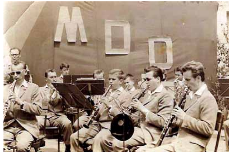
Mládežnícka dychovka v roku 1960.