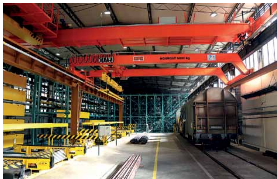
Pohľad do automatizovaného skladu.

Hala má dva hlavné vstupy cez sekcionálne brány – na východnej a na západnej štítovej stene. S prihliadnutím na potreby výroby, skladovania a expedície rúr sú zväzky rúr z ťahárne rúr a valcovne rúr (buď zviazané oceľovými páskami alebo uložené v tzv. korýtkach) dopravované pomocou železničných vagonov zo západnej strany haly. Bolo však potrebné zrekonštruovať železničnú vlečku aj s výhybkou. Vyskladňovanie z automatizovaného skladu a nakladanie na kamióny je realizované