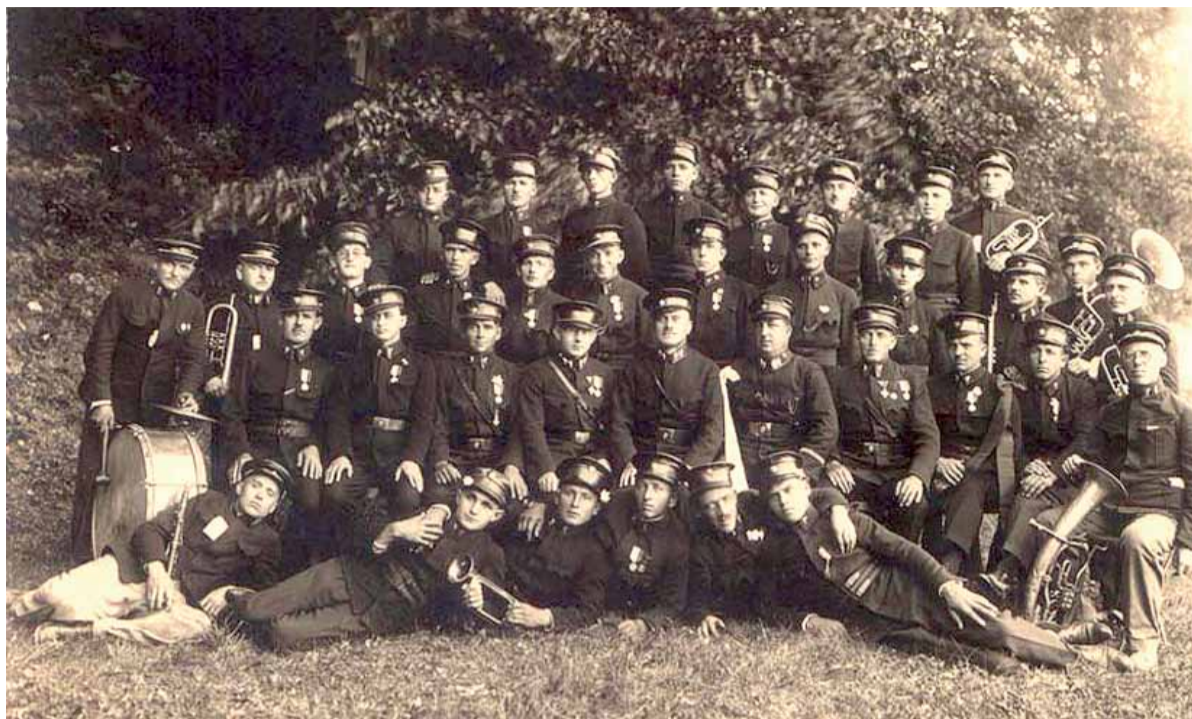
Hudba v uniformách začiatkom 20. storočia.