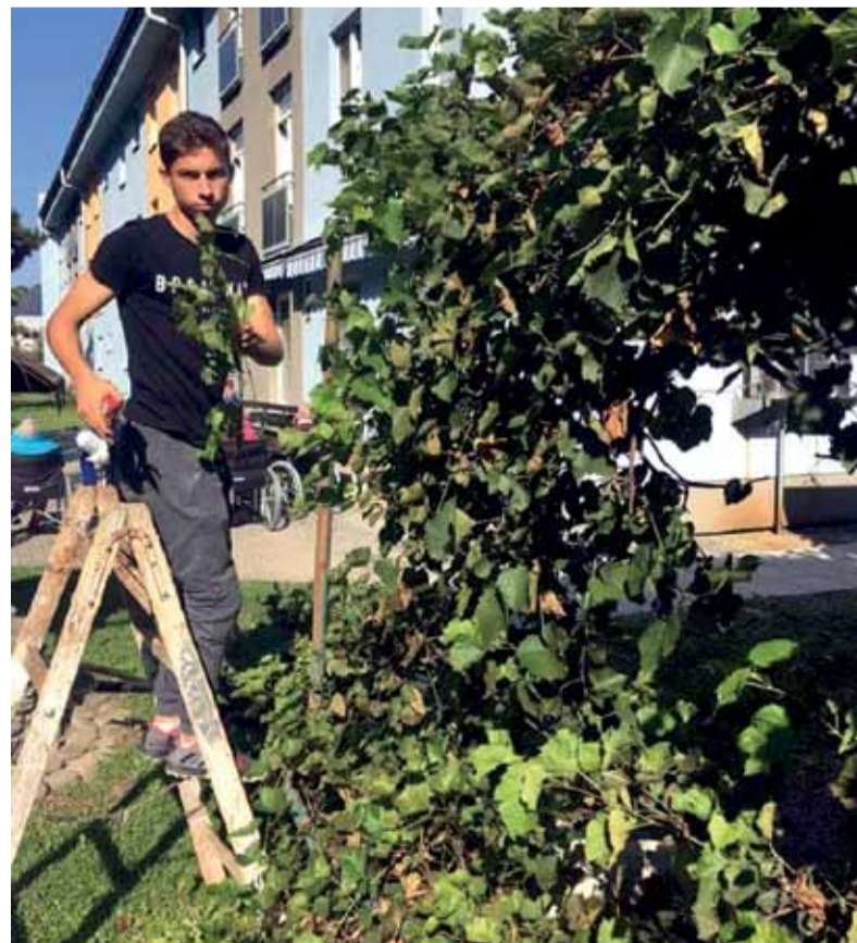
Úprava záhrady bola jednou z dobrovoľníckych aktivít

Zúčastnili sme sa aj workshopu o dobrovoľníctve „Dobré skutky sa nedajú len tak“, ktorý bol realizovaný v spolupráci s Centrom dobrovoľníctva v Banskej Bystrici. V piatok, 21. septembra, sa v našej škole realizovala aj zbierka „Biela pastelka“, ktorá napomáha zlepšiť životy nevidiacich a slabozrakých. Cieľom zbierky je získanie finančných prostriedkov na podporu ľudí so zrakovým postihnutím. Výnos Bielej pastelky je každoročne použitý na poskytovanie sociálneho poradenstva a sociálnej rehabilitácie, teda na financovanie aktivít, ktoré nevidiacim a slabozrakým ľuďom pomáhajú začleniť sa do bežného života. Biela pastelka patrí medzi desať najväčších zbierok na Slovensku.