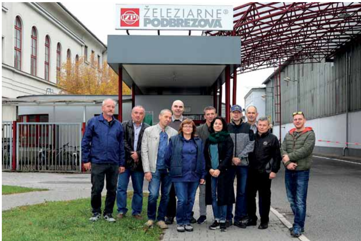
Komisia BOZP Rady OZ KOVO pred bránou starého závodu.

„Hlavnou úlohou komisie je pravidelne hodnotiť stav a vývoj legislatívy v oblasti bezpečnosti a ochrany zdravia pri práci, ako aj sledovať smerovanie zabezpečenia BOZP priamo v podnikoch pôsobnosti OZ KOVO. Pravidlom býva, že každé zasadnutie komisie je spojené s návštevou vybraného zamestnávateľa. Týmto spôsobom si členovia komisie môžu v praxi overiť,