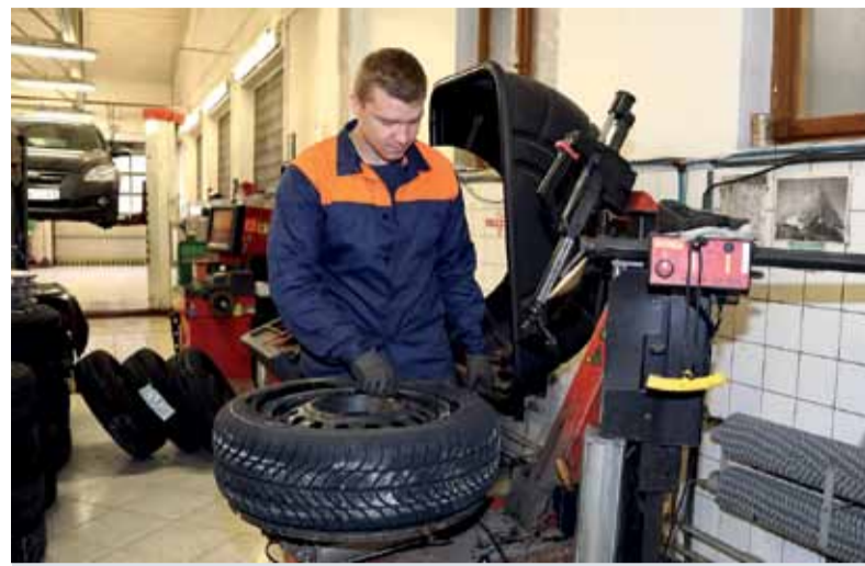
Pracovník doprava pri kontrole pneumatiky.

- Okrem zimnej prípravy a plnenia výrobných požiadaviek na prepravu cestnou aj železničnou dopravou, pripomíname v rámci školení BOZP, našim zamestnancom pravidlá bezpečného