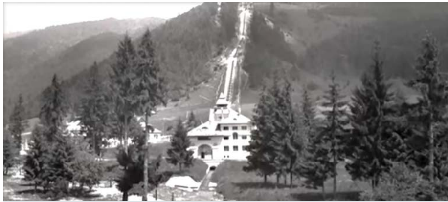
Hydrocentrála Jasenie – stav okolo roku 1930

Raveň. Po vyčerpaní týchto ložísk postupne otvorili podpovrchové zlatonosné náplavy, tromi hlavnými šachtami na severnú a jednu na južnú stranu.