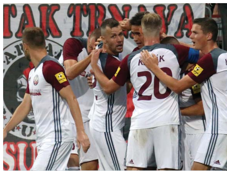
Radosť hráčov Podbrezovej po strelenom góle.

FC Spartak Trnava: Rusov – Lupták, Hladík, Tóth, Čonka – Greššák, Grendel (84. Pekár) – Jirka, Dangubič (63. Jarovič), Mieseböck (65. Sloboda) – Bakoš.