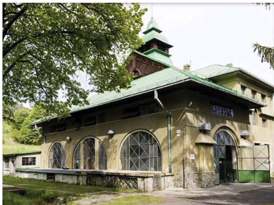
Súčasný stav hydrocentrály Jasenie

zastavená. Po jej skončení a množstve problémov sa projekty prepracovali a povolenie na výstavbu hydrocentrály v lokalite Spálená huta pred Suchou dolinou vydal župný úrad vo Zvolene v roku 1918. Napriek tomu, že elektrárň bola dobudovaná už v roku 1925, jej prevádzka bola spustená až v roku 1928 pre problémy s distribu-