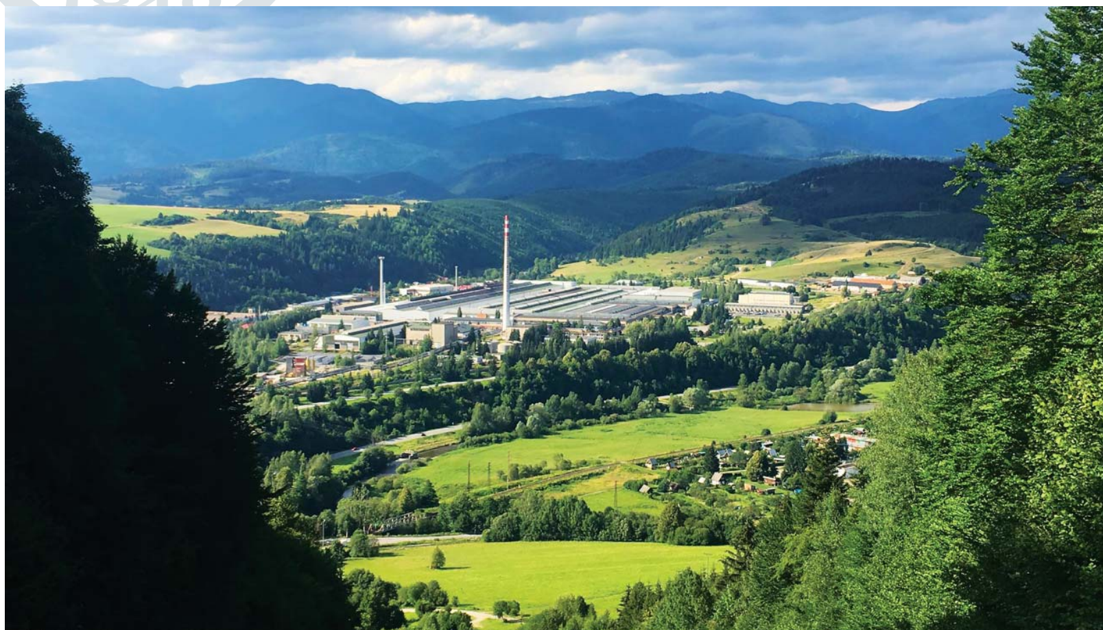
Letný pohľad na nový závod.