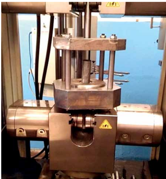
Prípravok na ťahanie rúr s meraním ťažnej sily.

Dôležitý je poznávací proces, ktorý robia ľudia v železiarňach v prevádzkárňach, v našom výskumno-vývojovom centre a na univerzitách, ktoré vzdelávajú ľudí v tejto oblasti, čiže tu budú vychovávaní špecialisti pre plastickej deformáciu za studena a vplyvu tribologickej dvojice na geometrickej stálosti rozmerov. Sú to diplomové práce, doktorandské práce a samozrejme, očakávame, že títo ľudia prídu k nám pracovať.