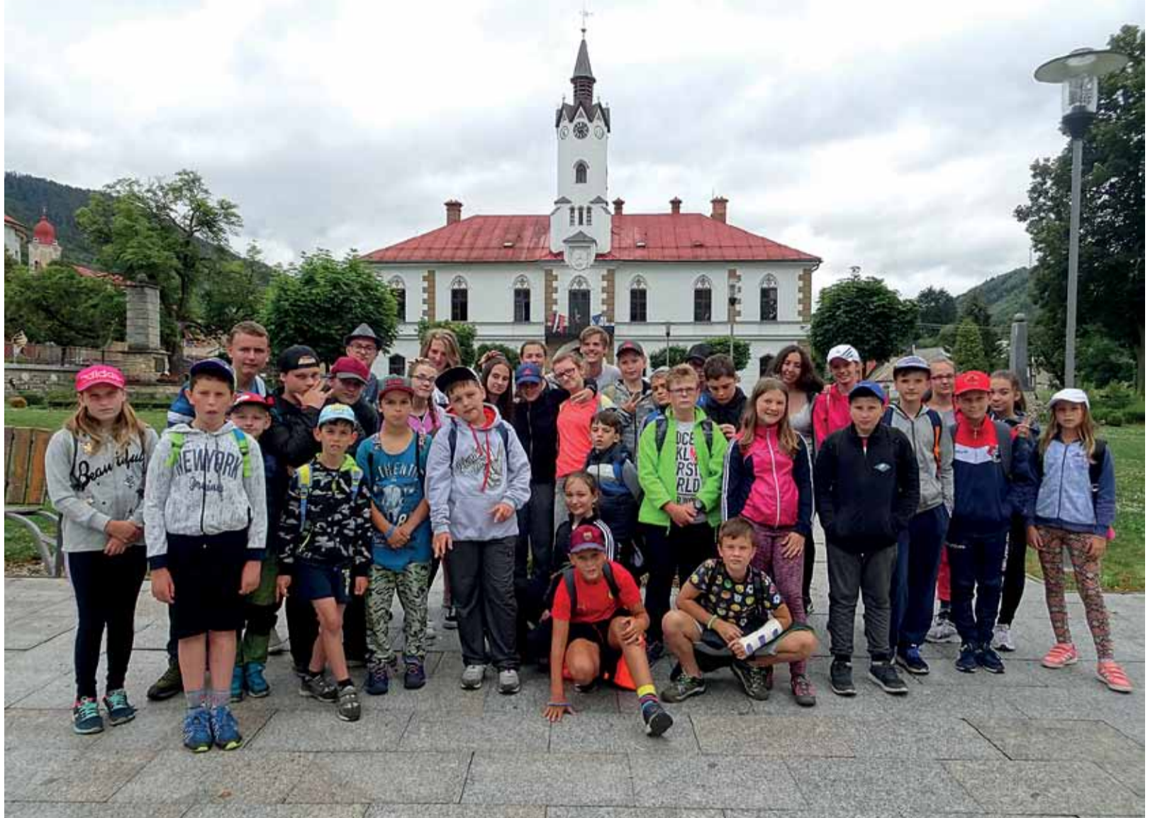
Deti na námestí v Ľubietovej.

- Páči sa mi tu, až na to počasia, ktoré nám až tak nedoprialo, pršalo nám zatiaľ tri dni. Keď je zlé počasia tak sa hráme také hry, ako napríklad, že píšeme si na papier anglické slová, vety a odpovede a potom z toho tvoríme vety a nakoniec z toho vznikne taká nezmyselná veta, ale to je vlastne podstata tej hry a je to zábavné. V takomto pobytovom tábore som už štvrtýkrát a v Speaklande som prvýkrát. Prihlásil ma tu otcino, ktorý robí v Podbrezovej, aby som si zlepšil angličtinu. Chodil som do denných táborov, ale viac sa mi páči takto, pretože som stále s kamarátmi.