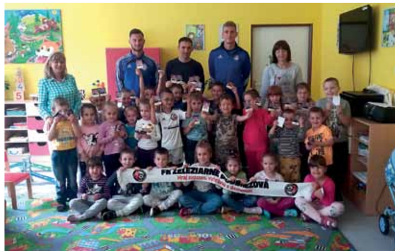
V rámci projektu Futbolmania navštívili hráči MŠ v Podbrezovej