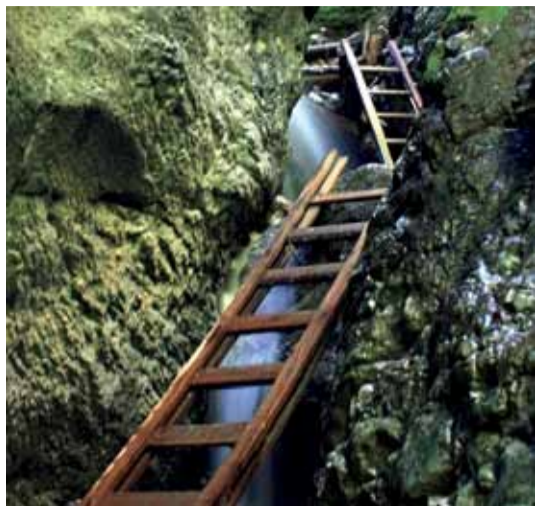
Drevenými rebríkmi sú zaistené tri miesta