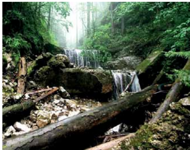
Pohľad do Čertovej doliny.