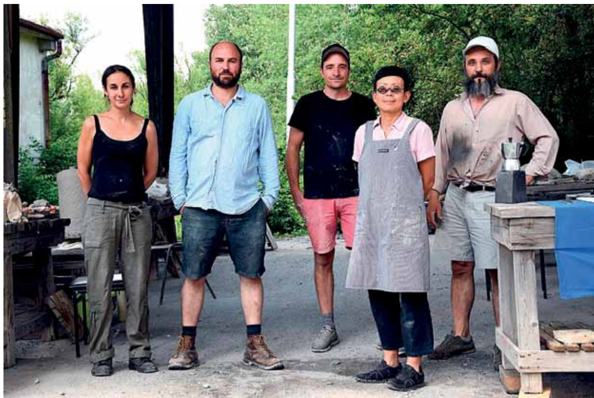
Keramické sympóziu Kalinovo 2018.