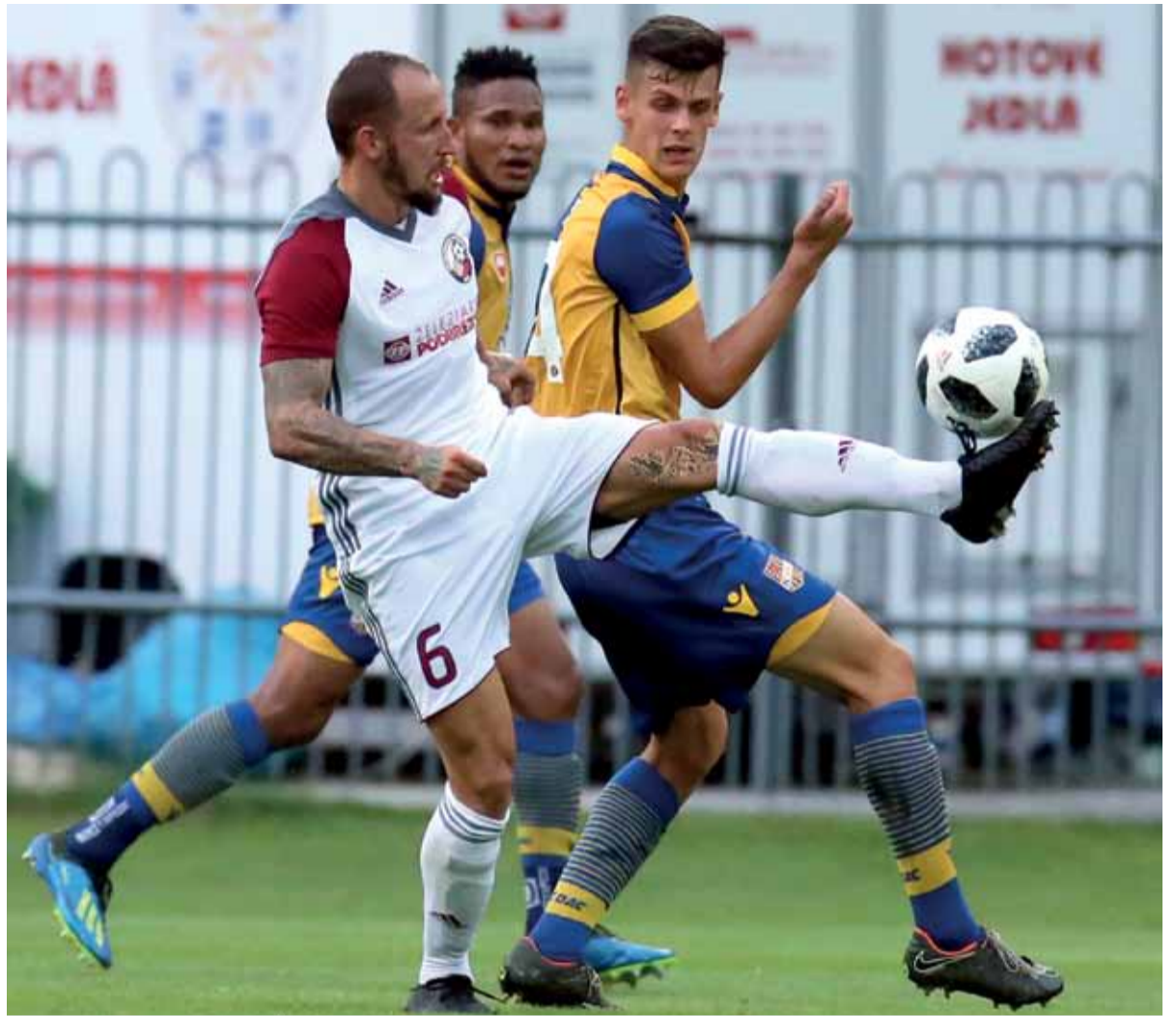
Domáci zápas s DAC Dunajská Streda.