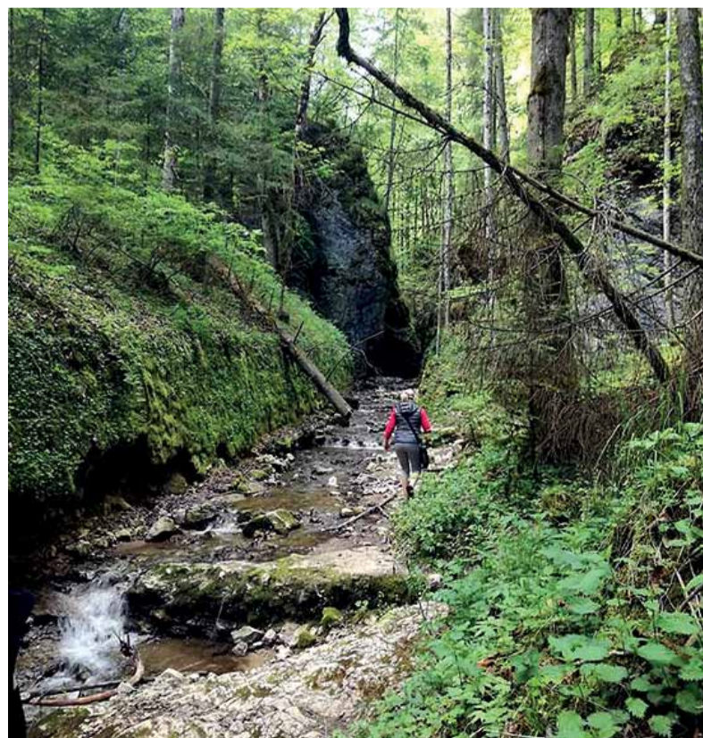
V náročnejšom teréne sa bez pevnej obuvi nezaobídete.

Do Čertovej doliny sa môžete vybrať viacerými trasami. Najznámejšia je od sedla Zbojská, kde nájdete ná-