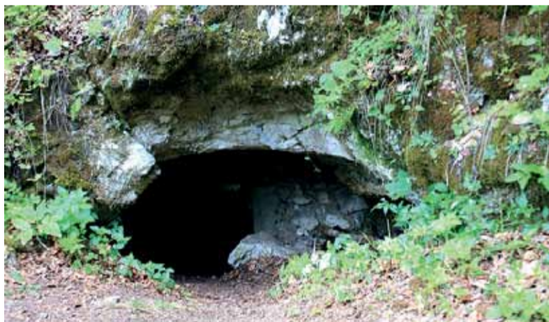
Zbojnícka jaskyňa vraj ukrýva poklad, ktorý tam nechala Surovcova družina.

V obdobiach silných dažďov a v zimnom období môže byť prechod tiesňavou Čertovej doliny veľmi nebezpečný.