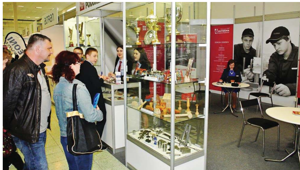
Návštevníkov zaujal náš duálny systém vzdelávania.

zamestnanosti a európski partneri verejných služieb zamestnanosti s reálnymi pracovnými miestami, s pracovnými príležitostami a poradenstvom pre oblasť slovenského a európskeho trhu práce, ale aj vzdelávacie agentúry, ktoré ponúkajú širokú paletu služieb od poradenstva cez testovanie jazykových zručností, počítačových zručností, až po hodnotenie osobnosti.