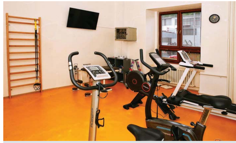
V telocvičniach sa cvičí okrem iného aj SM Systém a Vojtova metóda

9. Imunoregulácia. Laserové svetlo priamo ovplyvňuje stav imunity sti-