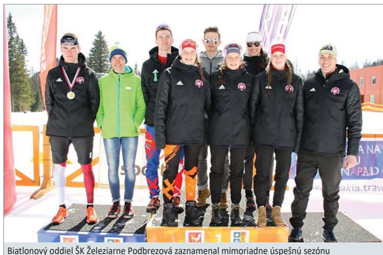
Biatlonový oddiel ŠK Železiarne Podbrezová zaznamenal mimoriadne úspešnú sezónu