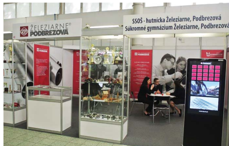
Náš stánok objektívom O. Čiefovej

Na najväčšom veľtrhu práce Job Expo mali Železiarne Podbrezová možnosť prezentovať svoju spoločnosť pred širokou verejnosťou a vybrať si priamo budúcich zamestnancov či nadviazať kontakty s budúcimi partnermi. Uchádzači o zamestnanie našli na tomto veľtrhu asi 220 zamestnávateľov zo Slovenska i zahraničia, ktorí ponúkali voľné pracovné miesta. Pripravené bolo aj množstvo sprievodných podujatí – prednášok, workshopov. Úrad práce, sociálnych vecí a rodiny zabezpečil bezplatnú dopravu