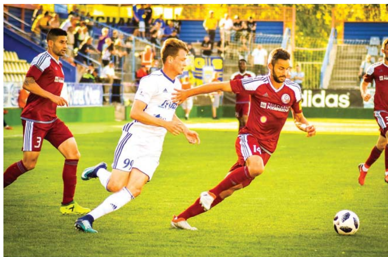
Na Zemplíne sme prehrali najtesnejším rozdielom.

1. FC Tatran Prešov: Lukáč – Bartek, Luberda, Prikryl, Petko – Dzurik, Keresťeš, Katona (60. Kraľovič), Streňo (85. Udeh) – Gatarič, Hošek (75. Dupkala). FK Železiarne Podbrezová: Kuciak – Turňa, Djordjevič, Krivák, Viazanko – Sedláček, Baez – Leško (90 + 3. Lepieš), Njire (76. Tereščenko), Bernadina (66. Breznaník) – Więzik.