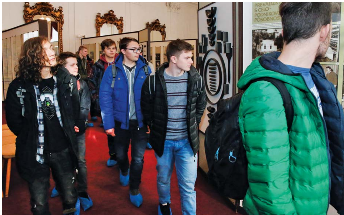
Prvých pätnásť tretíakov elektrotechnikov SPŠ J. Murgaša, ktorí začali s praxou v Železiarňach Podbrezová, prvýkrát navštívilo našu spoločnosť 14. februára 2018. Absolvovali lekársku prehliadku, navštívili oceliareň a oboznámili sa s bohatou históriou našej firmy prehliadkou Hutníckeho múzea ŽP. Praxujú každú druhú stredu od 9.30 do 14.30 hod. a zaradení sú do centrálnej údržby a do energetiky.

- Mne sa tu veľmi páči, som rád, že som mohol vidieť ako to funguje v takom veľkom podniku, to ma vlastne zaujalo najviac. Po škole plánujem ísť skôr na vysokú školu, uvažujem nad odbornými priemyselnými informatikami alebo programovaním. Nevylučujem, že by som potom raz nastúpil do práce aj v tejto fabrike.