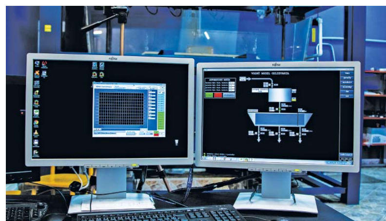
Operátorská PC stanica pre snímání, záznam a vizualizáciu veličín a riadenie prietokov

Pomocou stopovacej látky je možné pri modelovaní prúdenia ocele