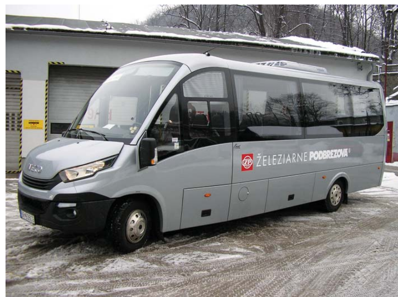
Nový 25 miestny midibus v prevádzkarni doprava.