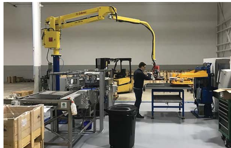
Inštalácia linky rovinného povrchového brúsenia profilov od španielskej firmy GER Máquinas Herramienta S.L. v dcérskej spoločnosti Transmеса USA, Inc. v Sterling Heights, štát Michigan

- V uplynulom roku TRANSMESA spolu s dcérskou spoločnosťou TAP vyrobili 8 646 ton, respektíve 23,8 milióna metrov presných oceľových rúr a profilov v sortimente s priemernou metrovou hmotnosťou 0,36 kilogramu na meter. To predstavuje šesťpercentný medziročný nárast. Z tohto objemu bolo 2 680 ton finalizovaných elektrolytickým pozinkovaním a 2 223 ton mechanickým delením, počet nadelených kusov sa tak za ostatné dva roky zdvojnásobil na pätnásť miliónov. Spoločnosti dodali svojim odberateľom výroby a tovar v celkovom objeme 13 711 ton a konsolidovaný obrat z predaja tovaru, výrobkov a služieb, tak dosiahol 36,3 milióna eur. Na štrnásťpercentnom medziročnom náraste tržieb má významný podiel predaj tovaru zo Železiarní Podbrezová a.s., ktorý predstavoval 5,7 milióna eur. Spomedzi 37 krajín, do ktorých TRANSMESA expedovala svoje výrobky a tovar, dosiahol domáci španielsky trh 30,7 percentný podiel. Za uvedených podmienok bol dosiahnutý konsolidovaný zisk pred zdanením vo