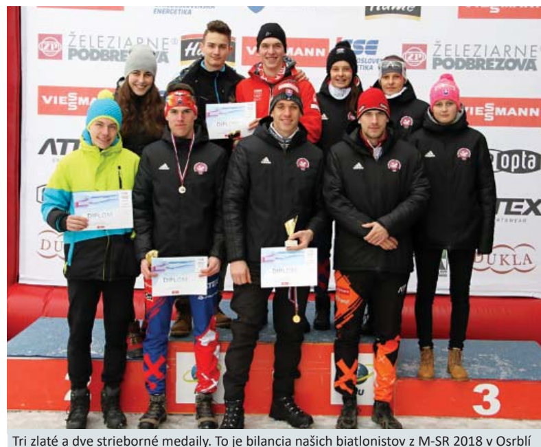
Tri zlaté a dve strieborné medaily. To je bilancia našich biatlonistov z M-SR 2018 v Osrblí