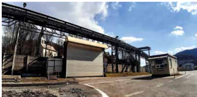
Aj brána strážneho stanovišťa „pod kostolom“ ostane počas leta zatvorená.

Počas prvej fázy opravy cestnej komunikácie I/66, boli dočasne