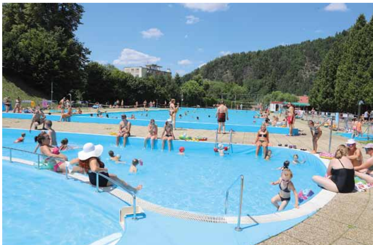
Návštevníci relaxujú pri bazéne.

Za akých podmienok a či sa vôbec kúpalisko otvorí, nikto nevedel dopredu povedať. Prevádzkovatelia rátať s rôznymi scenármi. V hre bolo aj to, že do bazénov pustia len zlomok ľudí. „Na covid semafore sme dlho neboli v zelenej farbe. Reálne hrozilo, že budeme môcť pustiť len pätinu, maximálne polovicu návštevníkov. Zatiaľ fungujeme bez obmedzení, akurát musíme viac dbať na hygienu. Čiže častejšie upratovať a dezinfikovať sprchy či toalety,“ spresnila.