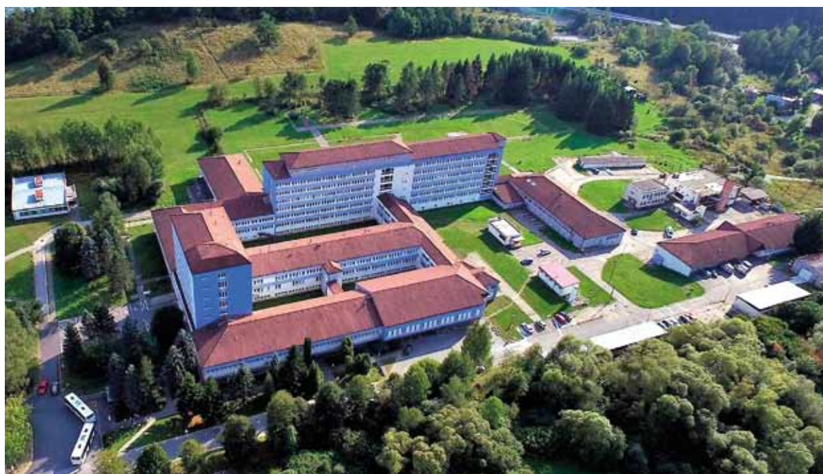
Nemocnica v Brezno je každým rokom modernejšia.

Popri ústavnej lekárskej nemocnici prevádzkuje aj dve verejné lekárske (jednu v nemocnici a druhú v Polomke), jednu pobočku (v Pohronskej Polhore), dopravnú zdra-