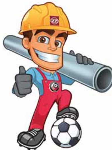
O tom, aké meno bude mať nový maskot, rozhodujú fanúšikovia

Domáce zápasy bude od novej sezóny sprevádzať aj nový maskot. Jeho meno vyberajú fanúšikovia na klubovom webe. Zároveň môžu vyhrať vecné ceny. „Nový maskot bude neodmysliteľnou súčasťou domácich zápasov. Symbolizuje