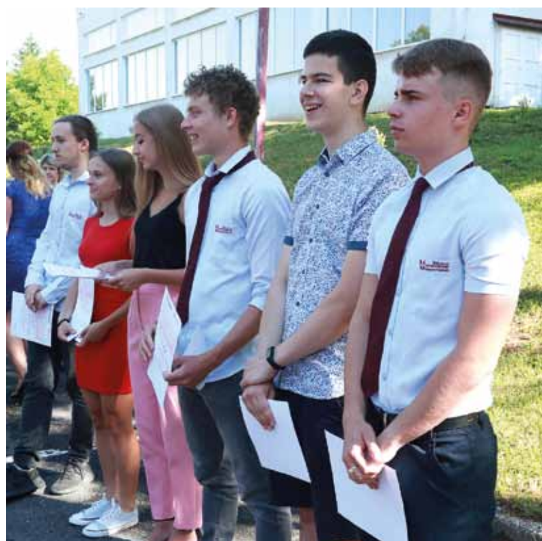
Ocenení žiaci dostali darčkové poukážky na nákup v knihkupectve.

svojho príhovoru popriala všetkým pekné prázdniny.