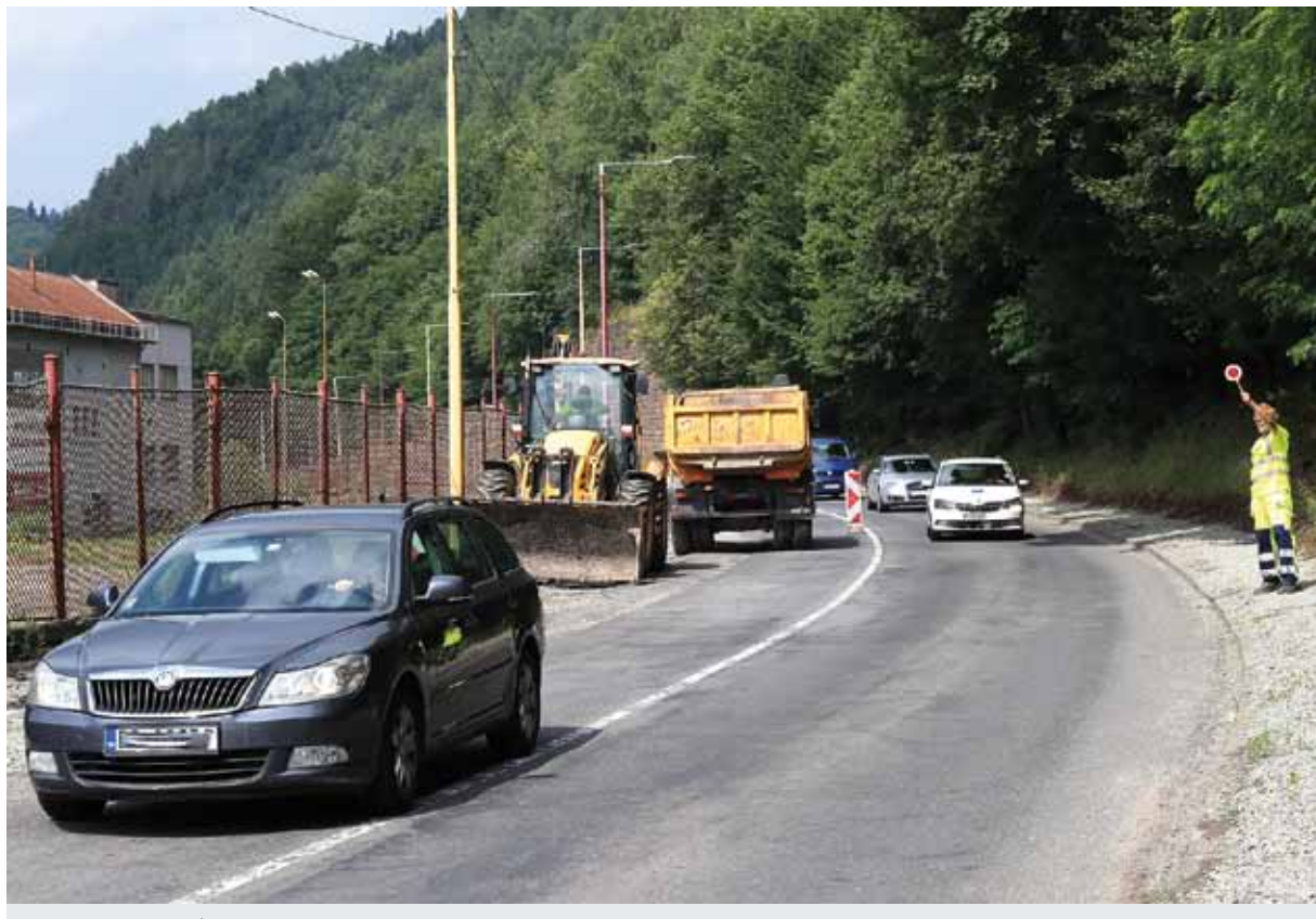
Aj keď bola cesta I/66 v časti opravovaného úseku začiatkom júla obojsmerne spojzadnená, predsa len budú práce počas leta naďalej prebiehať. Zdržanie by malo byť minimálne, nakoľko budú dopravu usmerňovať regulovčiaci.

Ešte v júli by mala začať oprava a reprofilácia oporného múru. Podľa predpokladu by mala trvať tri mesiace, do konca septembra. Tieto práce budú obmedzovať dopravu na železničnej vlečke ŽP a.s., na koľaji č. 22, smerujúcej popod oporný múr k prevádzkarni oceliarení a skladu hotovej výroby valcovne bezšvíkových rúr. S investorom a dodávateľom je dohodnuté, že práce budú môcť byť vykonávané počas desaťhodinových blokov výluky, od 7. do 19. hodiny, kedy bude koľaj zabezpečená a vylúčená z prevádzky.