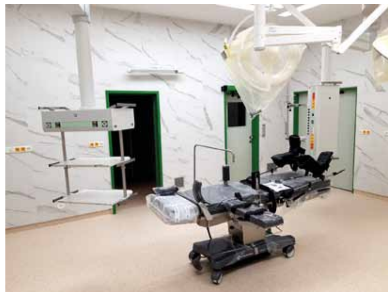
Aj vďaka vynoveným operačným sálam sa NsP Brezno postupne premieňa na modernú európsku regionálnu nemocnicu.

Pred niekoľkými mesiacmi prešla Nemocnica s poliklinikou (NsP) Brezno, n.o. veľkou rekonštrukciou. Aj v súčasnosti je realizovaný nákup rôznej techniky, ktorá skvalitňuje poskytované služby a tým aj zvyšuje spokojnosť pacientov na Horehroní. Nedávno sa v médiách objavili informácie o rušení niektorých nemocničných oddelení, ktoré majú nastať v rámci veľkej reformy slovenských nemocníc. Tá je podľa rezortu zdravotníctva potrebná, nakoľko výdavky nemocníc presahovali príjmy a rástla nespokojnosť pacientov, aj zdravotníkov. Jej cieľom má byť lepší manažment pacienta, efektívnejšie využívanie lôžok a peňazí, ktoré budú smerované do oblastí, v ktorých budú najviac potrebné.