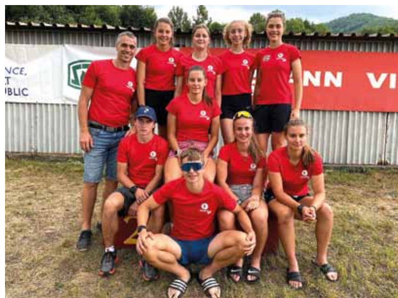
Naším biatlonistom sa v Revúcej darilo

Moravě, po ktorých nás v tomto stredisku v závere augusta čakajú letné majstrovstvá sveta na kolieskových lyžiach.“