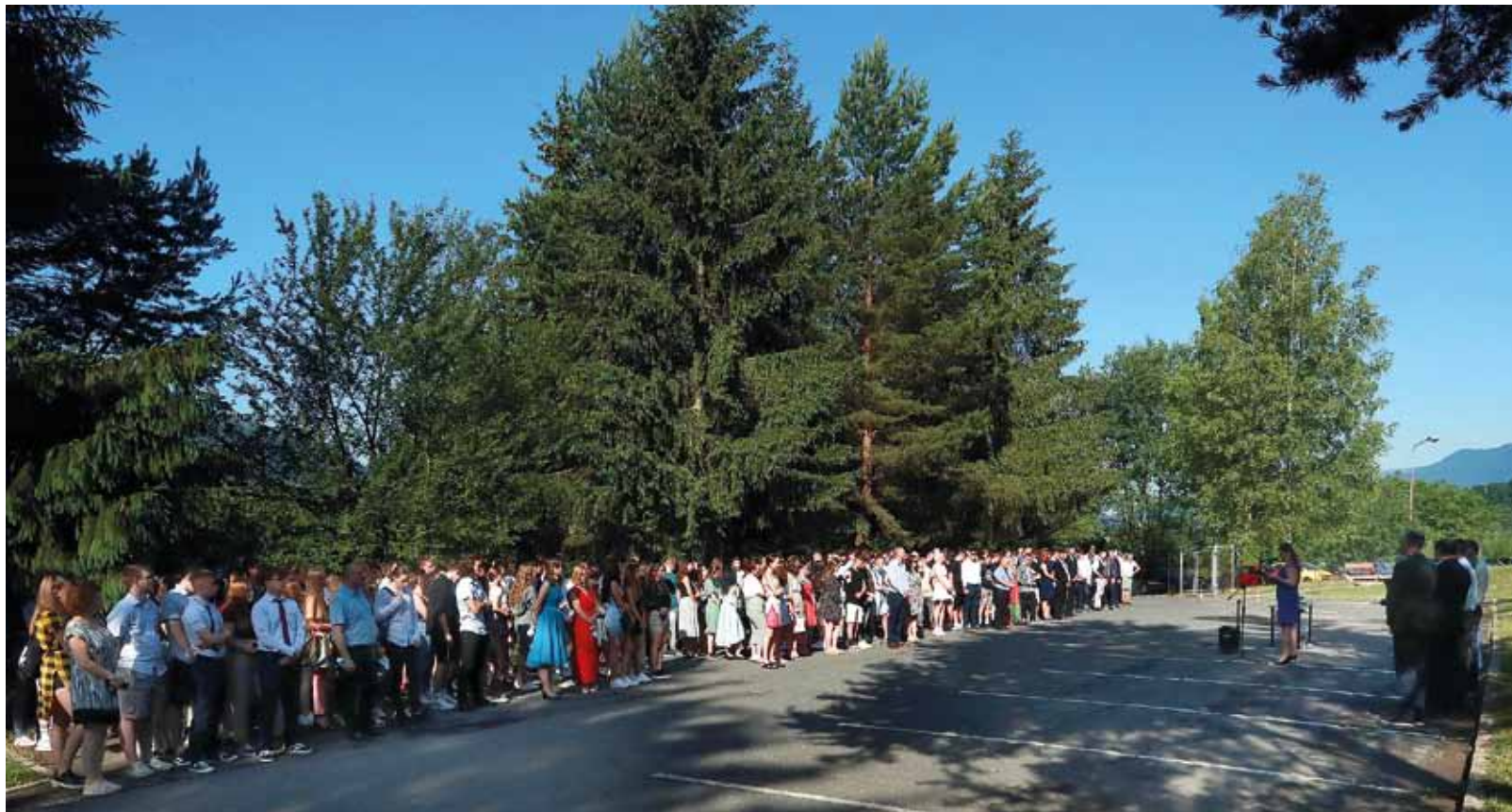
Koniec školského roka