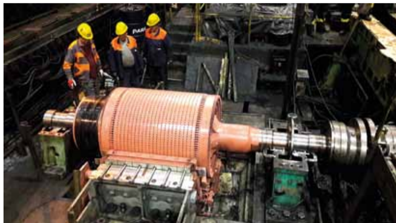
Pohľad na výmenu rotora pravého motora pohonu ozubenej tyči na pretlačovacej stolici

Na záver je možné konštatovať, že tak, ako aj v predchádzajúcich opravách, odvedli kolektívy všetkých zamestnancov zúčastnených na oprave veľké množstvo práce, za čo im zaslúžene patrí poďakovanie.