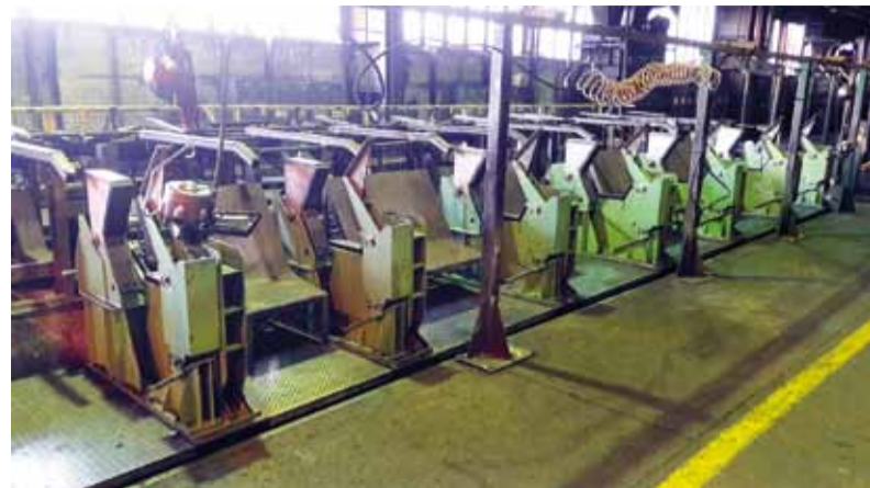
Pohľad na vymenený formovací šesťhran za značiacim zariadením REIKA v stredisku expedície

V redukovní boli vymenené dopravné valce na vstupnom do-