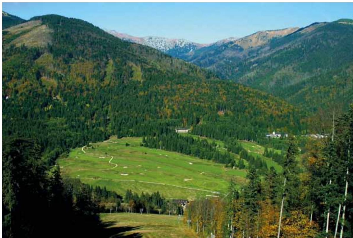
Zamestnanci sa regenerujú v nádhernej prírode.

- Som tu druhýkrát a som veľmi spokojná. Ako spomínal manžel, doobeda sú procedúry a poobede chodíme na prechádzky. Škoda, že nevyšlo počasie, ale napriek tomu som so všetkým spokojná. Strava aj ubytovanie sú na veľmi dobrej úrovni.