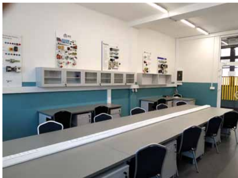
Pohľad do zmodernizovanej dielne

Dielne odborného výcviku určené pre štúdium mechatroniky