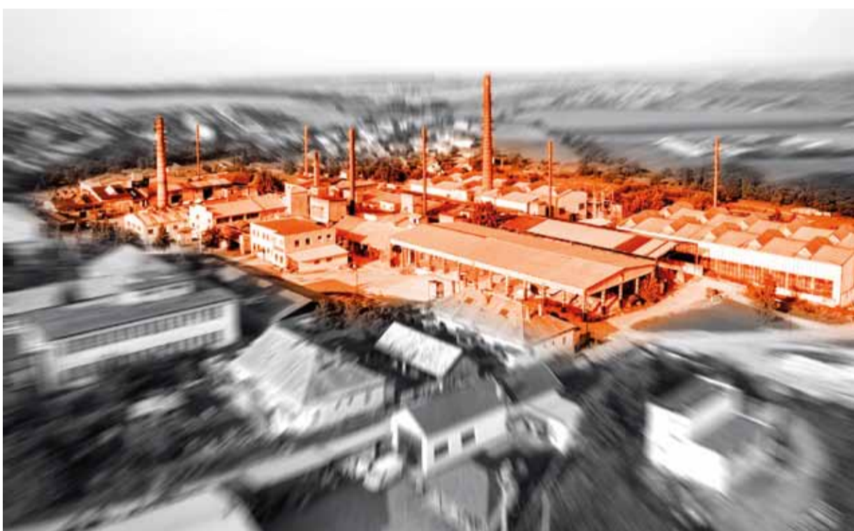
Za stotridsať rokov prešla kalínovská šamotka rôznymi etapami vývoja, od účastinnej spoločnosti cez štátny podnik Slovenské magnezitové závody, Žiaromat, štátny podnik až po začlenenie do ŽP Group.