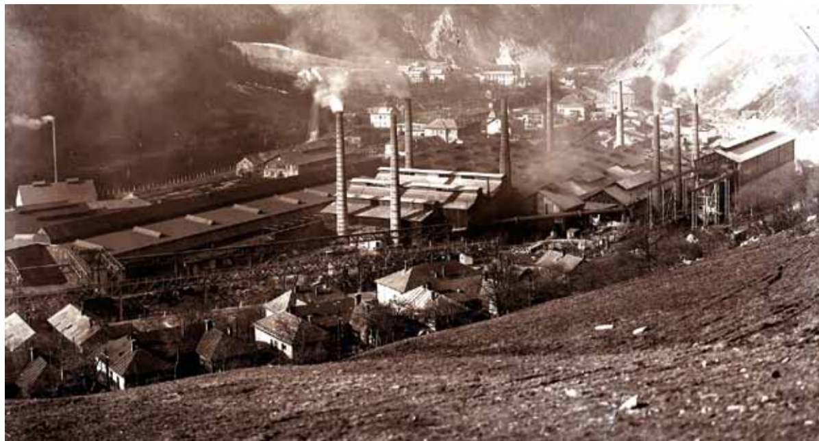
Stredoslovenské železiarne boli premenované na Švermove železiarne v roku 1949.

Z tejto križovatky možno pokračovať rôznymi smermi. Jednou je Veľké Borové. Obcou preteká potok Borovianka, ústiaci tieňovitým úsekom s ponorom a vodopádmi do Kvačianskej doliny. Tesne pred sútokom s Kvačiankou na Oblazoch ešte priteká ráztocský potok, tečúci z obce Jóbova Ráztoka, vytvárajúci úzku roklinu s osemmetrovým Ráztocským vodopádom. Na juhozápade sa nad obcou rozprestiera rozsiahla krasová plošina Svorad, nesúca názov podľa benediktínskeho pustovníka sv. Andreja Svorada, žijúceho na prelome 10. a 11. storočia. Cez Veľké Borové, Svorad a Prosiecku dolinu, návrat do Kvačian trvá päť hodín.