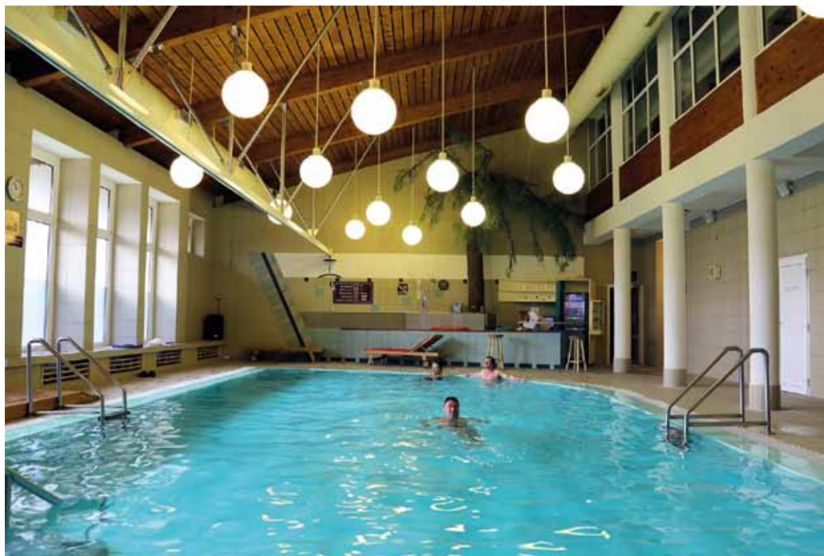
V polovici júna sa opäť rozbehli rekondičné pobyty na Táloch.

- Na rekondičnom pobyte som prvýkrát. Zatiaľ sa mi veľmi páči, len keby bolo lepšie počasie, ale to nemôžeme ovplyvniť. Doobeda máme procedúry a poobede voľnejší program. Vo voľnom čase tu športujem, chodím behávať, bicyklovať alebo zjdem do posil-