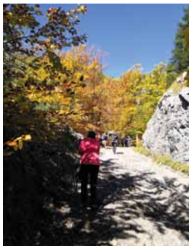
Trasa je vhodná pre každého a v každom ročnom období.

Así po hodine kráčania prídete k drevenej tabuli smerujúcej k odbočke Oblazy, kde môžete odbočiť k mlynom. Je to trochu strmé klesanie, ak poprší, pozor, šmykľavé, ale oplatí sa zísť a naskytne sa vám rozprávkový pohľad. Pri sú-