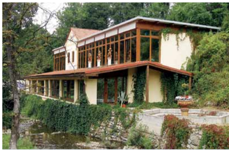
Sklené Teplice objektívom V. Kúkolovej

Liečebné procedúry: relaxačný program na dve noci 3 procedúry za pobyt (1x termálny kúpeľ – zrkadlisko, 1x čiastočný bahenný zábal, 1 klasická masáž – čiastočná), tri noci 4 procedúry za pobyt (1x termálny kúpeľ – zrkadlisko, 1 čiastočný bahenný zábal, 1 klasická masáž – čiastočná, 1x hydroterapia), štyri noci 6 procedúr za pobyt (1x termálny kúpeľ – zrkadlisko, 1x čiastočný bahenný zábal, 1x klasická masáž čiastočná, 1x hydroterapia/perličkový kúpeľ, 1x soľná jaskyňa/oxygenoterapia, 1x severská chôdza/skupinový telocvik), päť nocí 8 procedúr za pobyt (2x termálny kúpeľ – zrkadlisko, 1x čiastočný bahenný zábal, 2x klasická masáž čiastočná, 1x hydroterapia/perličkový kúpeľ, 1x soľná jaskyňa/oxygenoterapia, 1 severská chôdza/skupinový telocvik), šesť nocí 9 procedúr za pobyt (2x termálny kúpeľ – zrkadlisko, 1x čiastočný bahenný zábal, 2x klasická masáž čiastočná, 1 hydroterapia/perličkový kúpeľ, 1x soľná jaskyňa/oxygenoterapia, 2x severská chôdza/skupinový telocvik), sedem nocí 11 procedúr za pobyt (2x termálny kúpeľ – zrkadlisko, 1x čiastočný bahenný zábal, 2x klasická masáž čiastočná, 3x hydroterapia/perličkový kúpeľ, 1x soľná jaskyňa/oxygenoterapia, 2x severská chôdza/skupinový telocvik).