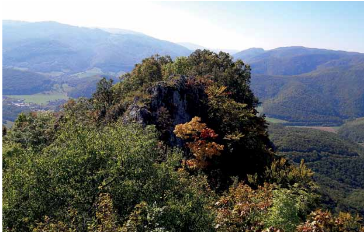
Jesenný pohľad z muránskeho hradu

FK Železiarní Podbrezová, účastník Fortuna ligy, 2. ligy a všetkých najvyšších mládežníckych futbalových súťaží bude hrať na domácich ihriskách Zelpo arény a FK ŽP.