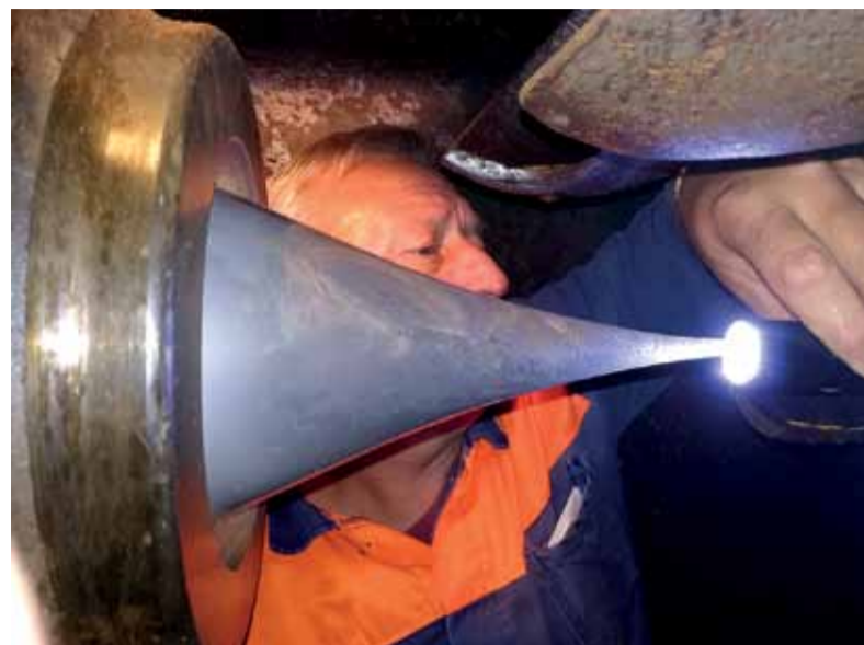
Kontrola ihlového uzáveru TG2 v HC Jasenie

- Nakoľko začalo vykurovacie obdobie je dôležité, pre zabezpečenie vytvorenia optimálnych pracovných podmienok, aby boli vykurovacie sú-