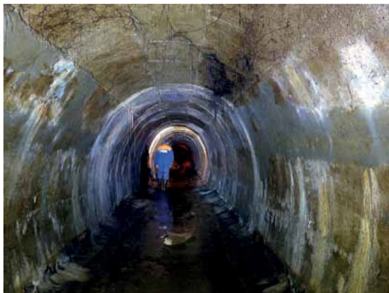
Kontrola privádzača Diel – Hnusno