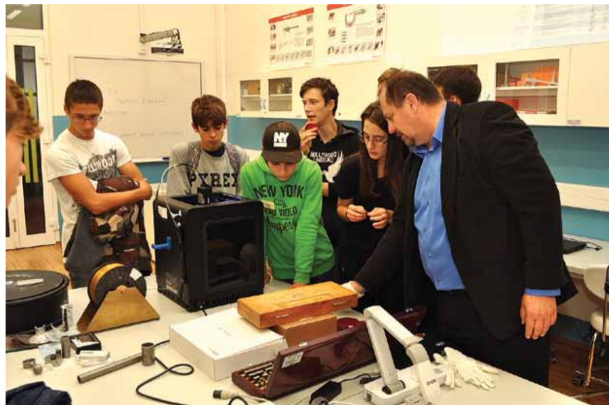
V dielňach SSOŠH ŽP