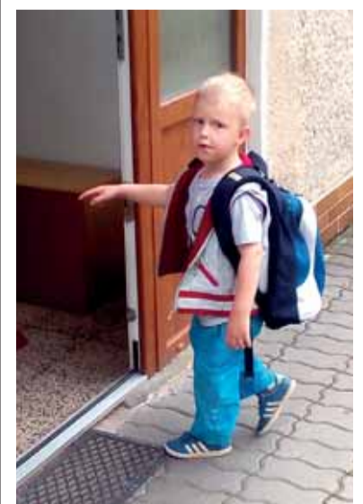
Ešte dnes to musím zvládnuť, ale zajtra už prázdninujem...