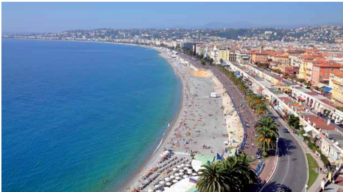
Dovolenka pri Azúrovom pobreží objektívom Ferdinanda Hrablaya

• Bravčový rezeň s pečenu, zemiaky, uhorka • Morčacie soté na zelenine, slovenská ryža, šalát • Bageta moravská.