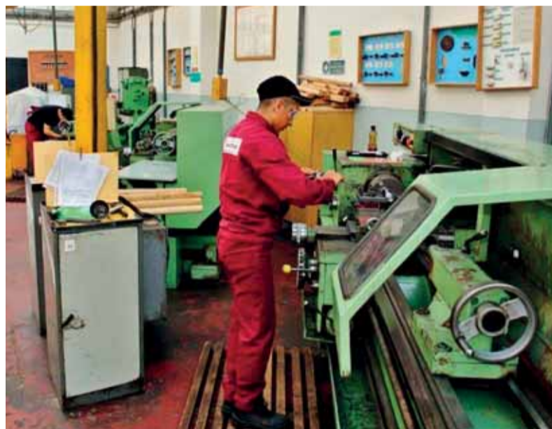
Praktická časť záverečnej skúšky na frézach

Členovia skúšobnej komisie hodnotili samostatnosť odpovedí žiakov, používanie odbornej terminológie a aplikovanie získaných vedomostí v praxi. Preukázané vedomosti a zručnosti žiakov boli na primeranej úrovni a v súlade s ich hodnotením počas štúdia.