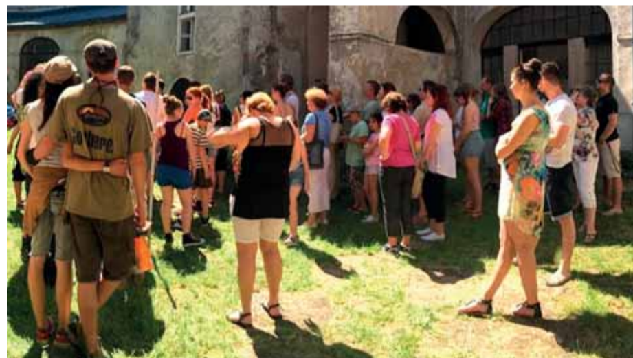
Ilustračné foto S. Ihringová