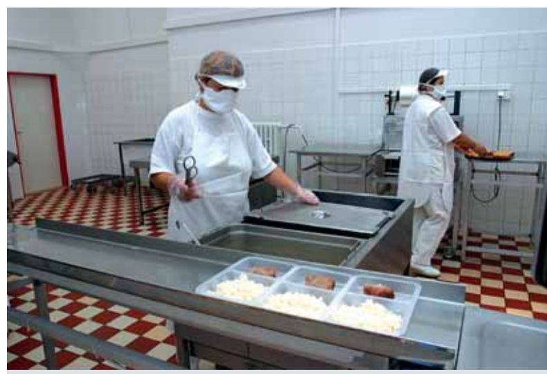
Ilustračné foto I. Kardhordová

- Stanovili sme si úlohy na riešenie a komisia sa znova stretne v septembri a prehodnotí ich plnenie. Prieskumy budeme robiť aj v budúcnosti a pevne verím, že v nich budú iba podnetné a reálne pripomienky. Reálne preto, že sme podnikové stravovanie a nie hotelová reštaurácia, ale zabezpečujem vás, že nám záleží a bude záležať na tom, čo zamestnancom ponúkame. V spolupráci s našou dcérskou spoločnosťou ŽP - Gastroservis, s.r.o. budeme aj do budúcnosti v tomto trende pokračovať. Všetkým, ktorí sa ankety zúčastnili, ďakujem.