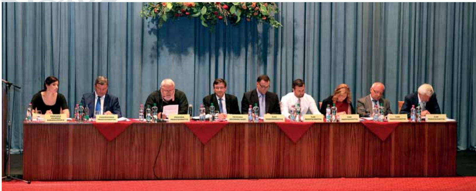
Z 24. valného zhromaždenia