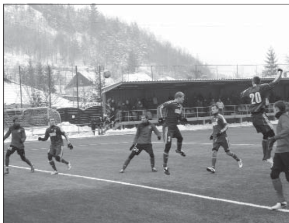
V druhom prípravnom zápase koncom januára s Duklou gól nepadol

v úvode sezóny, budú zlé terény, ktoré budú výhodou pre družstvá s defenzívnou taktikou, ale s tým sa my budeme musieť vyrovnávať