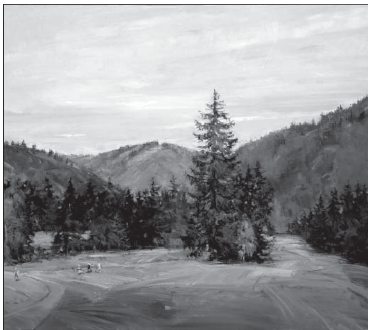
Vladimír Latincev, Krajina na Táloch, olej