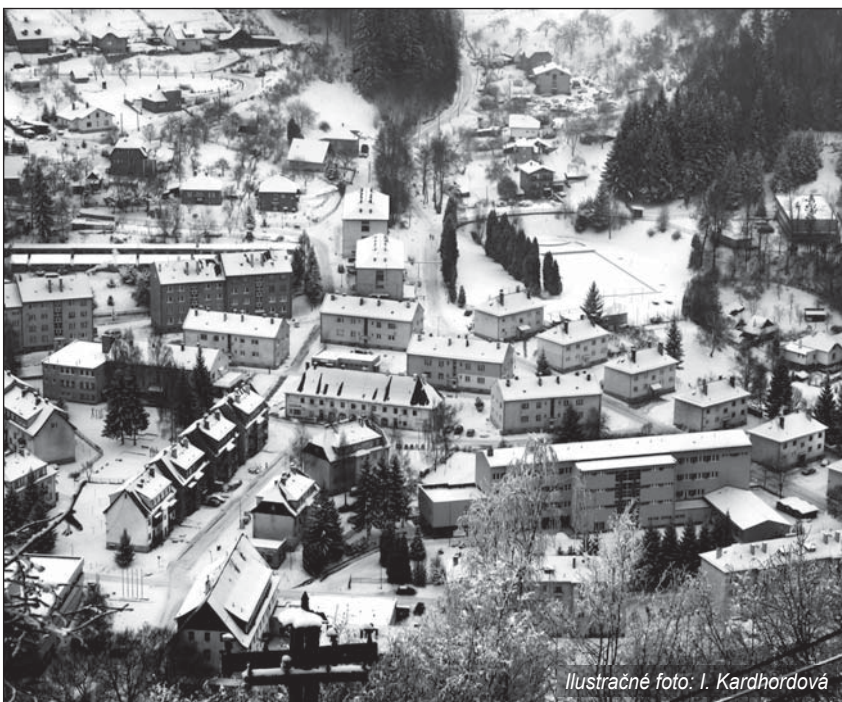
Ilustračné foto: I. Kardhordová