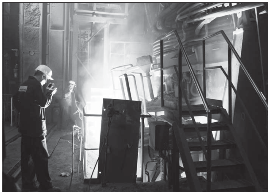
V oceliarni odliali po osemnástich rokoch 5 - miliónu tonu ocele.