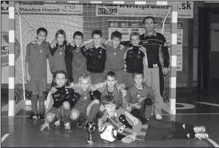
Víťazi halového turnaja v Handlovej.