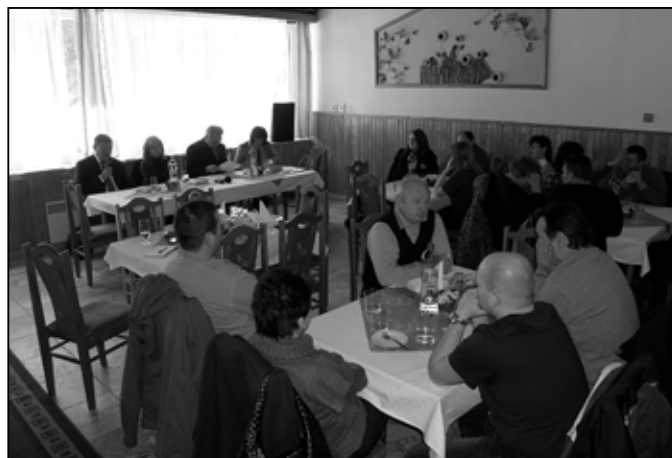
Pohľad na účastníkov zasadnutia.