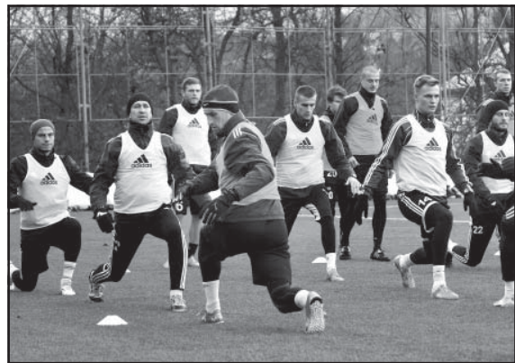
Od 11. januára prebieha zimná príprava fortuniligového tímu na umelom trávniku na Skalici.

- Áno, máte pravdu. Hlavnou témou bude skvalitnenie už dobrého a zároveň potlačenie toho nedostatočného. Program bude zaujímavý, začíname v domácich podmienkach sústredení na Tálchoch v hoteli Golf od 12. januára. Pokračujeme doma, kde odohráme tri prípravné zápasy s druholigovými súpermi, 19. januára so Slovanom Duslo Šaľa, 23. januára s 1. FC Tatran Prešov a 26. januára so ŠFK Sereď. Vrcholom bude sústredenie v tureckom Kemere od 30. januára do 11. februára. Tam nás čakajú kvalitní medzinárodní súper - 31. januára Dinamo Batumi, 6. februára FC Paksi a 9. februára BK Odense. Záver bude prebiehať opäť doma, kde doladíme detaily a generálkou našej prípravy na jarnú časť Fortuna ligy, začíname 27. februára so Senicou, bude 13. feb-