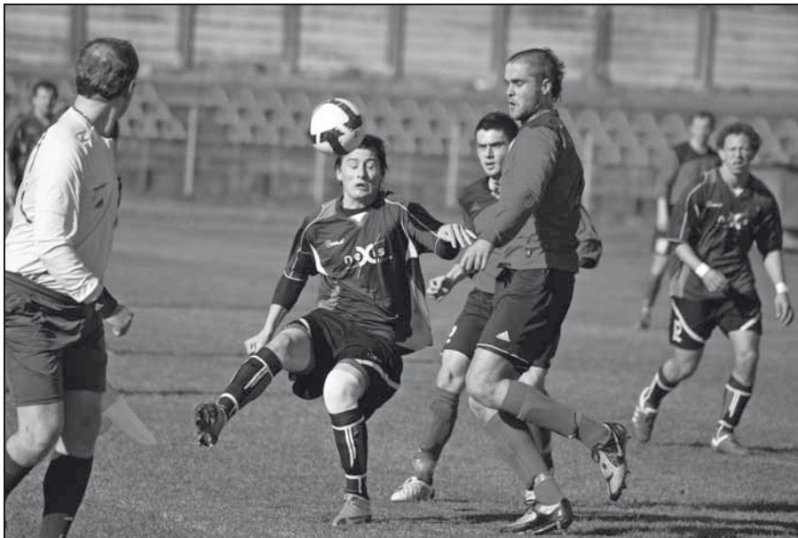
Zo zápasu ŽP B – HSC Humenné.