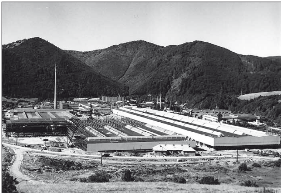
Celkový pohľad na výstavbu nového závodu – ťahárne rúr 2 (r. 1978).

Sto sedemdesiat rokov existencie zaraďuje podbrezovské železiarne medzi najstaršie firmy na Slovensku. Prešli 19., 20. a ocitli sa v 21. storočí. Počas tohto obdobia sa vystriedali roky úspechov i neúspechov, niekoľkých svetových hospodárskych kríz, dvoch svetových vojen a štyroch zmien štátneho usporiadania – od monarchie až po demokraciu. Významné udalosti zásadnou mierou ovplyvňovali aj vnútorné dianie. Železiarne sa v ich priebehu menili, zdokonaľovali, rozširovali a nakoniec transformovali na mini hutu.