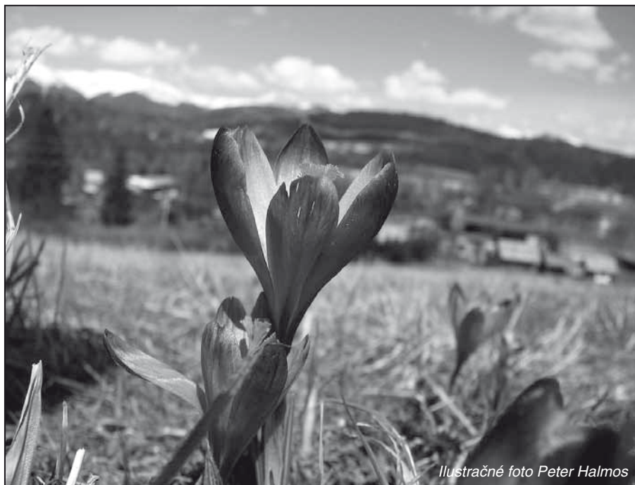
Ilustračné foto Peter Halmos