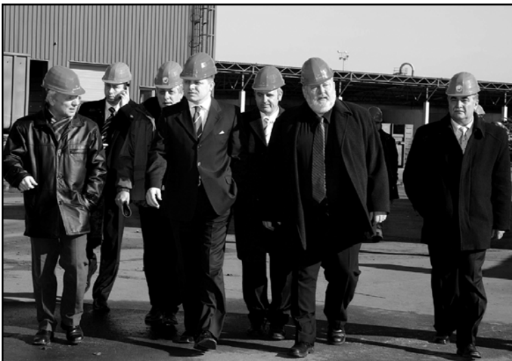
Predseda vlády si s obdivom prezrel najmodernejšie zariadenie na spracovanie ocelového odpadu.