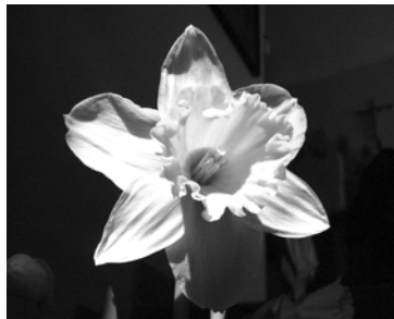
Bliži sa prvý jarný deň.