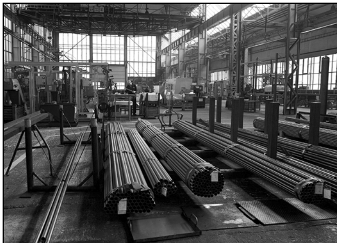
Medzi najvýznamnejšie investície technologického charakteru v minulom roku patrila úpravárenská linka presných rúr v prevádzkarni ťaháreň rúr. F. A. Nociarová

– Bohužiaľ, globálna hospodárska a finančná kríza pozna-