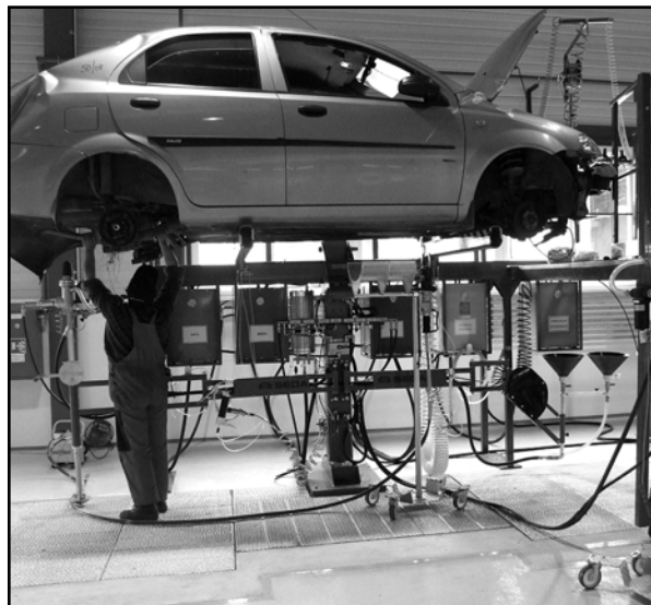
Zariadenie dokáže spracovať celé automobily (bez nebezpečných náplní, pneumatík, autobatérií...)

8. Nové auto je potrebné prihlásiť na polícii na človeka, ktorý bol majiteľom zošrotovaného auta. Podáte žiadosť o zapísanie, treba mať osvedčenie o evidencii, doklad o nadobudnutí (faktúru), doklad o zaplatení zákonnej poisťky, doklad totožnosti a zaplatíte kolok v sume 66 eur.