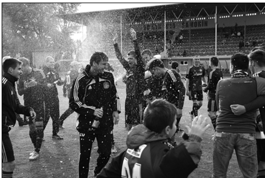
Postup do Corgoň ligy je najväčším úspechom podbrezovského futbalu v jeho takmer storočnej histórii – čítajte na 8. strane.