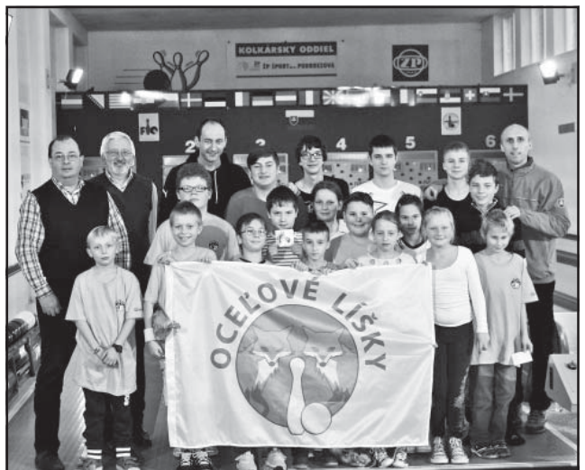
Spoločná foto mládeže z mikulášskej akcie v Dome športu ŽP