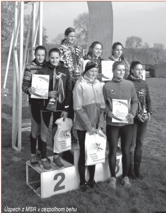
Úspech z MSR v cezpoľnom behu

Súkromná SOŠ HUTNICKÁ Železiarne Podbrezová