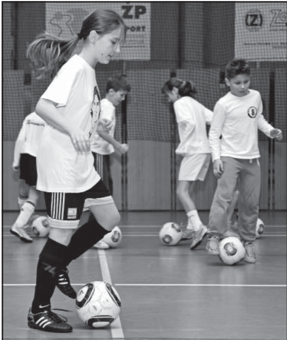
V telocvični na Štiavničke počas zimnej prípravy družstvo U11