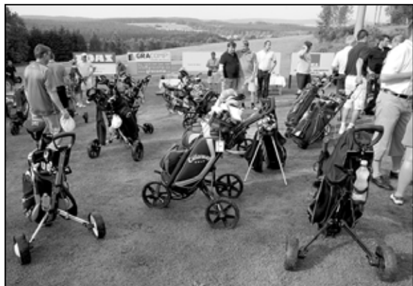
Golfové ihrisko Svratka bolo 19. augusta dejiskom výročného GOLF Cupu ŽDAS 2011