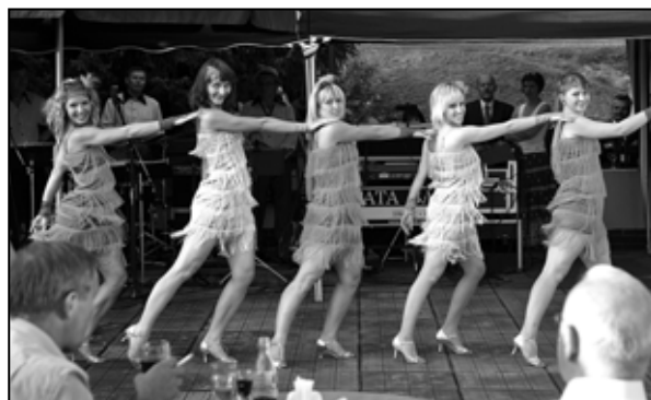
V kultúrnom programe sa predstavili pôvabné tanečnice zo zjednotenia Hotch – Potch.

V nasledujúci deň prebehlo známy tradičný turnaj ŽDAS Golf Cupu. Vzorne pripravené ihrisko poskytlo dobré podmienky pre výborné výkony. Bohužiaľ počasie, ako by si chcelo vybrať svoju daň za predchádzajúci krásny večer, prerušilo hru po prvom kole. Dosiahnuté výkony aj tak preukázali pripravenosť účastníkov a sú príslubom do ďalšieho ročníka turnaja. Iba organizátorom pridalo počasie vrásky na čele, i keď prechod fronty bol rýchly a tak sa tretí deň osláv prebudil do krásneho rána. To na žďárskom námestí otvoril už o deviatej hodine ráno koncert veľkého dy-