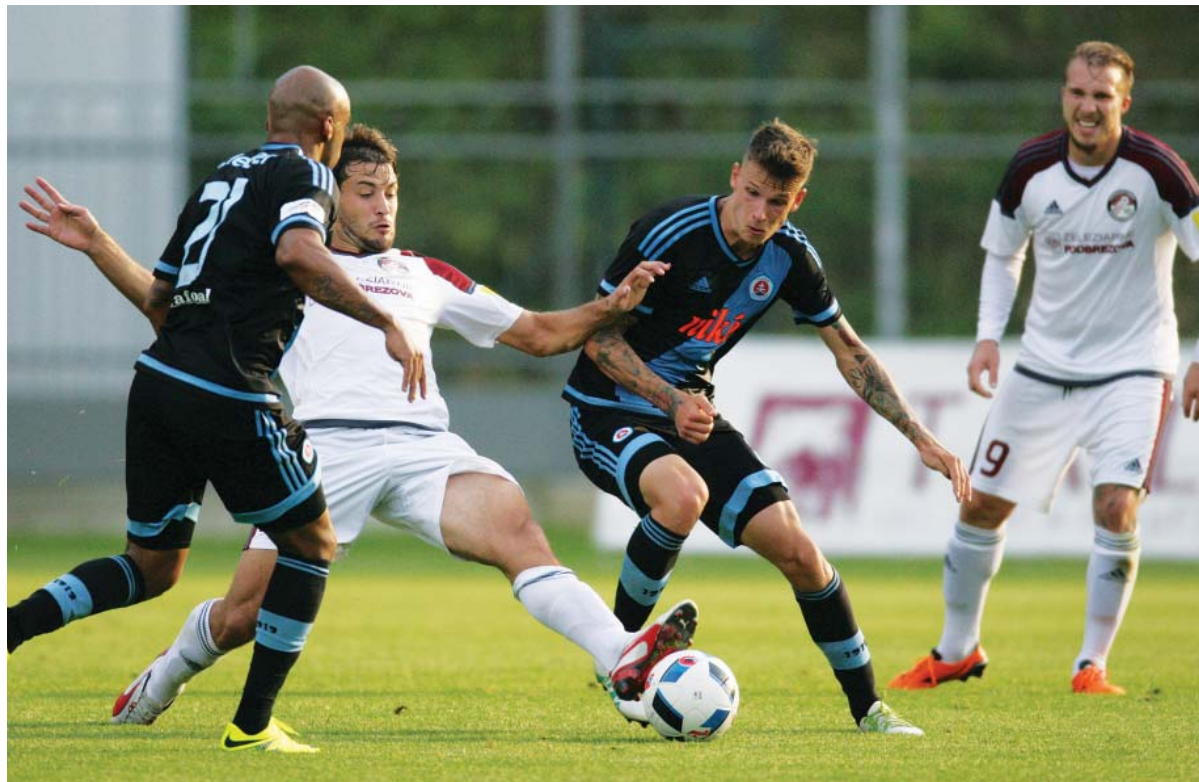
Archívna snímka z domáceho stretnutia nášho fortuniligového tímu so Slovanom objektívom A. Nociarovej