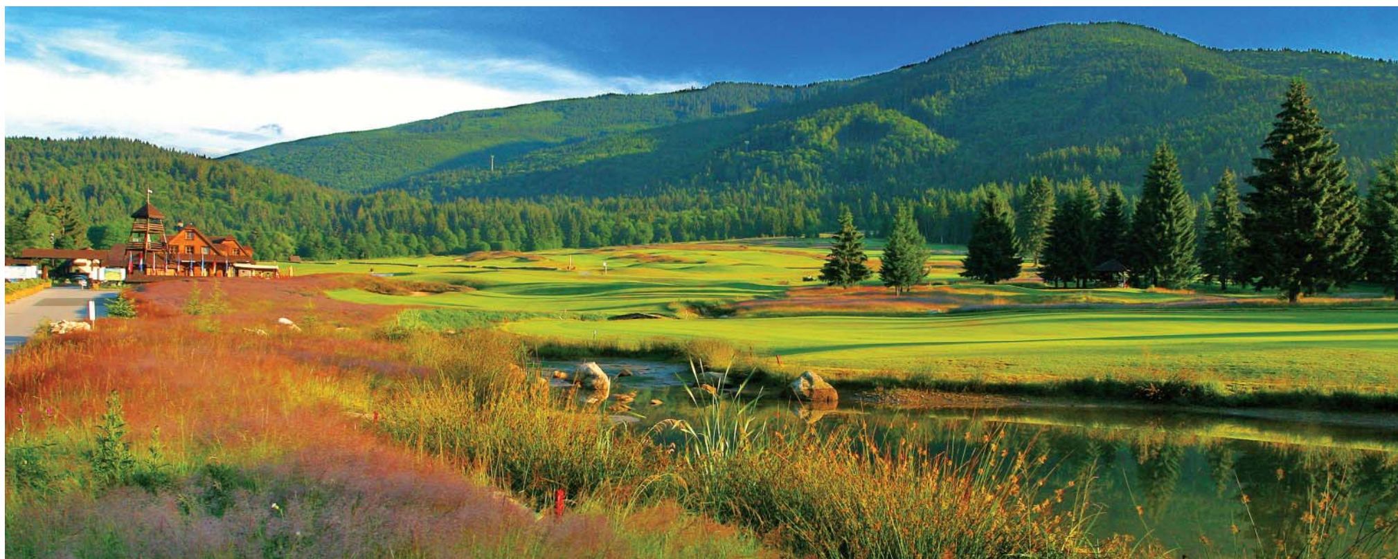
Ilustračné foto A. Nociarová