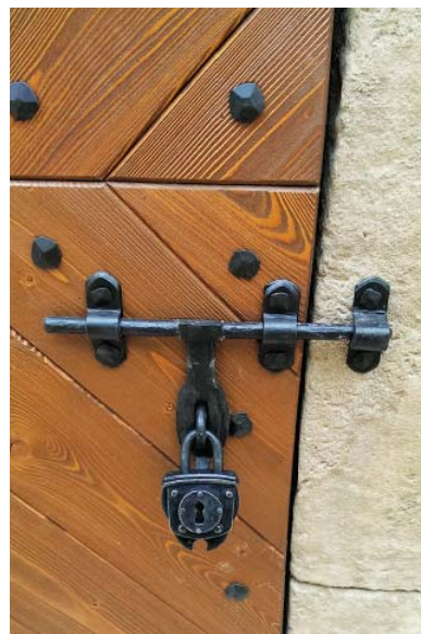
Nová zámka s hasprou

Podľa Benátskej charty sú pamiatky nositeľmi duchovného posolstva minulosti. V súčasnosti sú živým svedectvom zanikajúcich alebo stratených hodnôt a tradícií. Železiarne Podbrezová sa od roku 2002 snažia hrad odovzdať budúcim generáciám v jeho plnej rozmanitosti a historickej pôvodnosti. Možno sa nájsť takí, ktorí by spochybnili tento ušľachtilý cieľ, ale pozrite sa okolo seba a položte si otázku. Kde by bol hrad teraz bez nového majiteľa? Vo svojom okolí sa stretávame s pamiatkami, ktoré sa po rokoch chátrania z našich životov úplne vytrácajú. Pozrite sa na súčasnú podobu hradu v Slovenskej Ľupči a porovnajte to so stavom pár rokov dozadu. Pochopíte, že hrad bol pod správou železiarní vzkriesený a je pripravený čeliť novým výzvam.