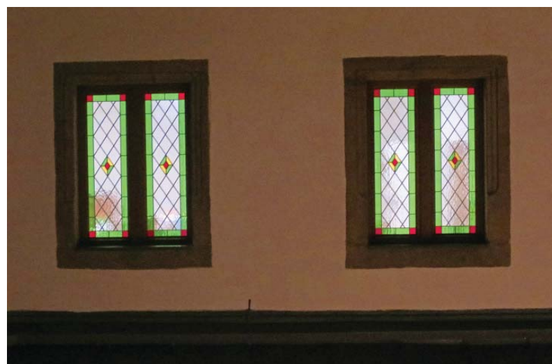
Vitráže v noci

čím sa predišlo inštaláciám rušivých vypínačov na pôvodné murivá. To isté sa dá povedať o citlivo zrealizovaných zábradliach alebo označeniach hydrantu vytesaním písmena „H“ do dlažby. Pod ryolitovou dlažbou sa ukrývajú výhrevné rohože, ktoré v zimnom období budú rozpúšťať sneh.