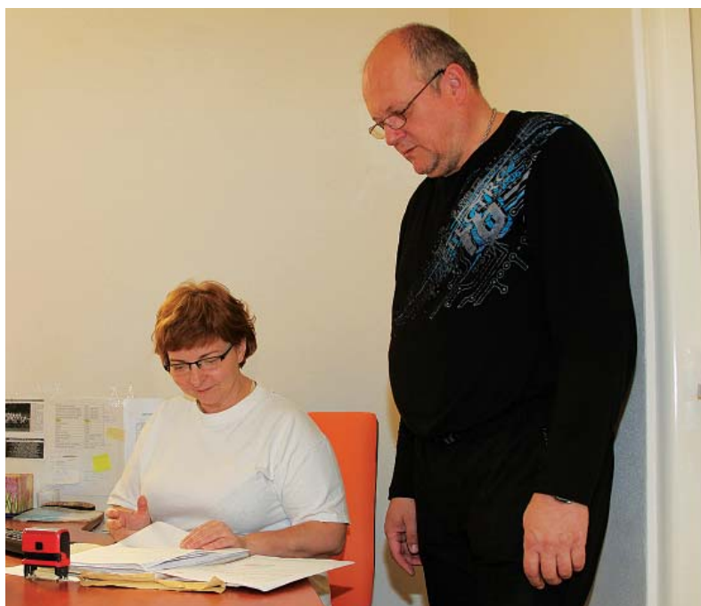
Ilustračné foto I. Kardhordová

Zamestnanci podniku môžu absolvovať na rehabilitačnom pracovisku rekondičné rehabilitačné balíčky s procedúrami, ktoré majú liečebno - preventívny charakter. Tieto balíčky obsahujú procedúry, ktoré nevyžadujú lekárske vyšetrenie. Na ich využitie je potrebné prihlásiť sa v ŽP REHABILITÁCIA s.r.o. Zamestnanci môžu absolvovať aj aplikáciu laseroterapie, avšak táto liečba musí byť schválená lekárom, preto je potrebné sa