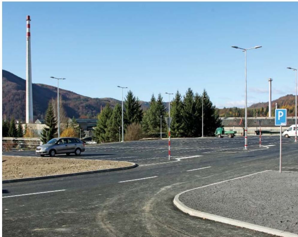
Budovanie parkoviska pred finišom.