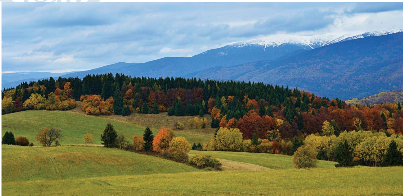
Jeseň objektívom Miroslava Bukovinu