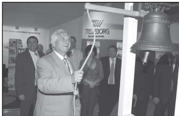
Náš stánok poctil svojou návštevou aj minister hospodárstva SR Lubomír Jahnátek.

Pätnásty ročník medzinárodného strojárskeho veľtrhu v Nitre, prebiehal v dňoch od 20. do 23. mája 2008. Veľtrh otvoril minister hospodárstva Slovenskej republiky Lubomír Jahnátek.