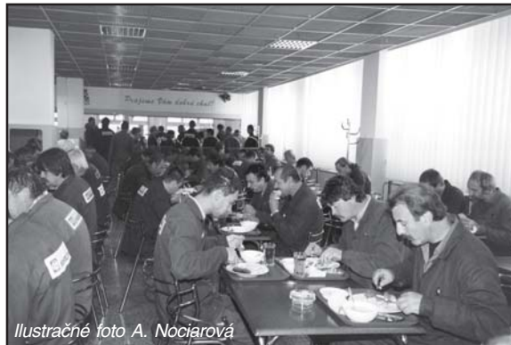
Ilustračné foto A. Nociarová

- Z dôvodu rozsiahlej generálnej opravy sociálnej budovy oce-