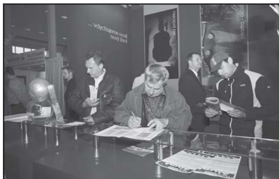
O návštevy sme nemali núdzu.