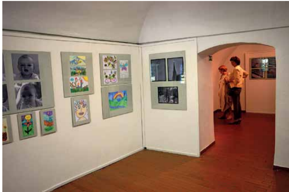
Pohľad do výstavných priestorov

Tí, ktorí majú záujem bližšie sa oboznámiť s tvorbou spomínaných autorov, majú možnosť urobiť tak do konca júna.