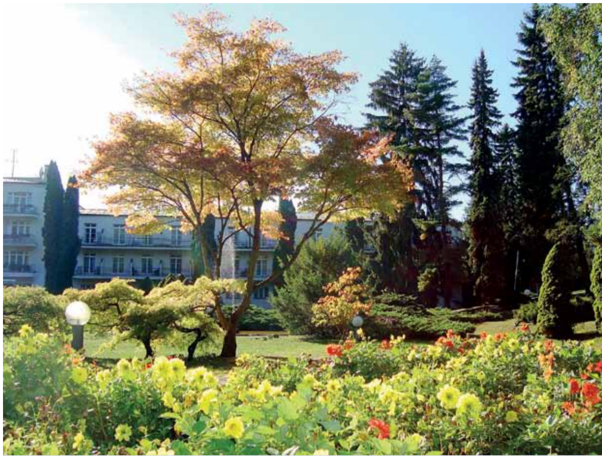
Kúpele Sliach objektívom V. Kúkolovej

Liečebné procedúry: relaxačný program na dve noci 3 procedúry za pobyt (1x termálny kúpeľ – zrkadlisko, 1x čiastočný bahenný zábal, 1 klasická masáž – čiastočná), tri noci 4 procedúry za pobyt (1x termálny kúpeľ – zrkadlisko, 1 čiastočný bahenný zábal, 1 klasická masáž – čiastočná, 1x hydroterapia), štyri noci 6 procedúr za pobyt (1x termálny kúpeľ – zrkadlisko, 1x čiastočný bahenný zábal, 1x klasická masáž čiastočná, 1x hydroterapia/perličkový kúpeľ, 1x soľná jaskyňa/oxygenoterapia, 1x severská chôdza/skupinový telocvik), päť nocí 8 procedúr za pobyt (2x termálny kúpeľ – zrkadlisko, 1x čiastočný bahenný zábal, 2x klasická masáž čiastočná, 1x hydroterapia/perličkový kúpeľ, 1x soľná jaskyňa/oxygenoterapia, 1 severská chôdza/skupinový telocvik), šesť nocí 9 procedúr za pobyt (2x termálny kúpeľ – zrkadlisko, 1x čiastočný bahenný zábal, 2x klasická masáž čiastočná, 1 hydroterapia/perličkový kúpeľ, 1x soľná jaskyňa/oxygenoterapia, 2x severská chôdza/skupinový telocvik), sedem nocí 11 procedúr za pobyt (2x termálny kúpeľ – zrkadlisko, 1x čiastočný bahenný zábal, 2x klasická masáž čiastočná, 3x hydroterapia/perličkový kúpeľ, 1x soľná jaskyňa/oxygenoterapia, 2x severská chôdza/skupinový telocvik).