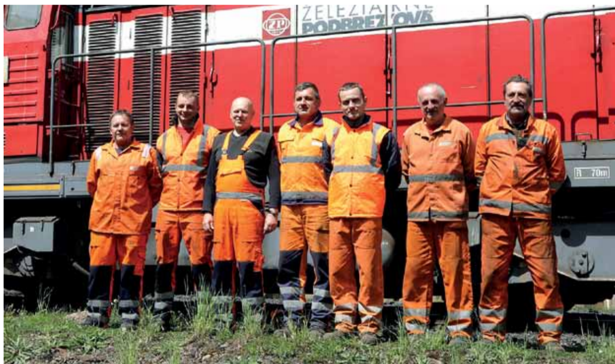
Vítaná zmena A z koľajovej dopravy