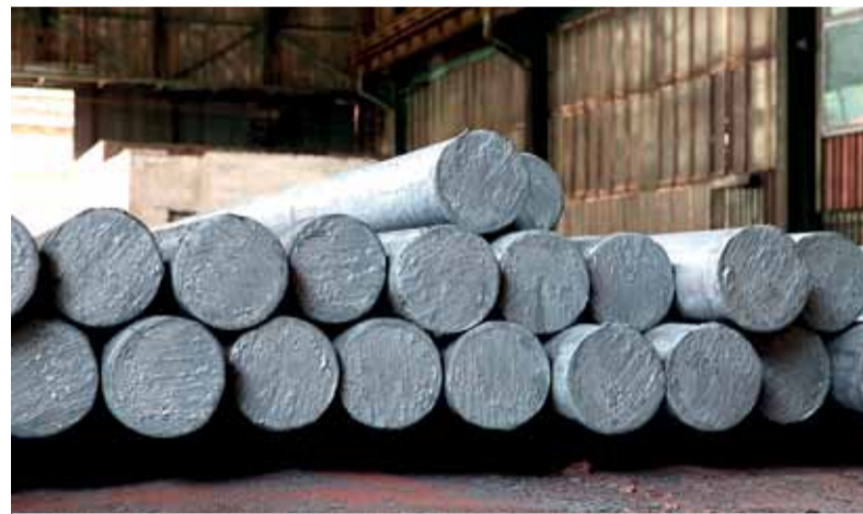
Ilustračné foto A. Nociarová

- Narodil som sa v Poprade a detstvo som prežil v malom podtatranskom mestečku vo Svite. Po štúdiách na strednej a vysokej škole v Košiciach som začal pracovať v Železiarňach Podbrezová. Som šťastne ženatý, mám dve deti – dcéru a syna. Mimochodom, svoju manželku som spoznal v železiarňach, keď som ju sprevádzal na exkurzii po oceliarni. Mám rád hory, nakoľko od narodenia žijem pod Tatrami, či už zmlada pod Vysokými alebo teraz pod Nízkyami. V zime rád lyžujem a v lete obľubujem turistiku.